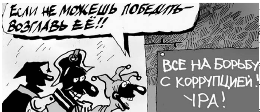
НА РИС.: ВЛАСТЬ НАЧАЛА БОРЬБУ С КОРРУПЦИЕЙ, ПРИКРЫВАЯ ПЕРЕДЕЛ СОБСТВЕННОСТИ

— Ни для кого не секрет, что коррупция пронизала всю вертикаль власти