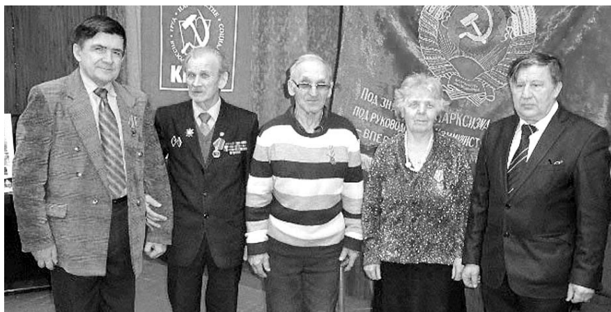
НА ФОТО: АКТИВИСТЫ СОВЕТСКОГО РАЙКОМА КПРФ