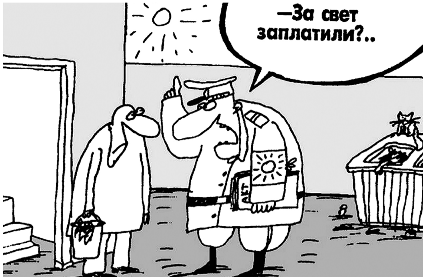
НА РИС: СКОРО С НАС И ЗА СОЛНЕЧНЫЙ СВЕТ БУДУТ ДЕНЬГИ БРАТЬ. СОЛНЦЕ — ОНО ВЕДЬ ТОЖЕ ОБЩЕДОМОВОЕ ПОЛУЧАЕТСЯ