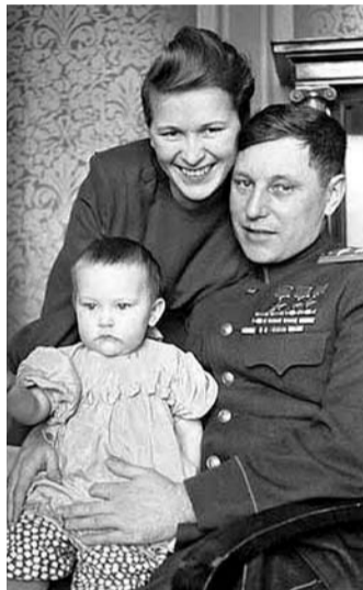
НА ФОТО: ТРИЖДЫ ГЕРОЙ СССР А. ПОКРЫШКИН В КРУГУ СЕМЬИ

«Высота — скорость — маневр — огонь!» — формула Александра Ивановичем ПОКРЫШКИНЫМ в воздушных сражениях, стала для него девизом всей жизни. Все чистое, высокое, благородное соединено в этом русском витязе неба. «Лучше уж убится, чем терпеть позор!», — отвечал он на укоры командиров, осуждавших его за смертельный риск, за отчаянную удачу в схватках с немецкими асами.