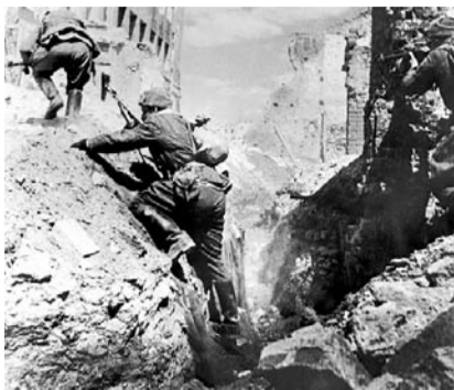
НА ФОТО: В СТАЛИНГРАДЕ БОИ ШЛИ ЗА КАЖДЫЙ ДОМ, ЭТАЖ, ПОДВАЛ...

А в боях за Сталинград генерал Чуйков показал, что умеет с максимальной эффективностью использовать основную огневую силу — артиллерию. Если минометы и противотанковые орудия были в боевых порядках батальонов, то тяжелую дивизионную и армейскую артиллерию он сосредоточил на левом берегу Волги, которая в нужный момент всегда поддерживала наши части. Так было создано новое формирование — армейская артиллерийская группа,