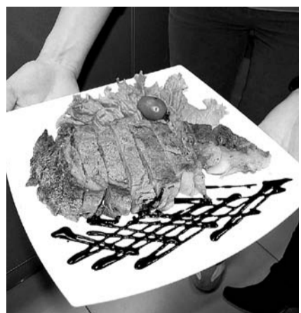
НА ФОТО: ХЛЕБ-СОЛЬ, КАК ГОВОРИТСЯ

Правительство Новосибирской области потратит около 4,5 млн. рублей на питание гостей во время приемов и других мероприятий. При составлении меню власти не скупилась и не скромничала. Мраморная говядина, ростбиф с маринованным лучком, язык в коньячном соусе, 18-летний виски и коньяк — далеко не весь список «мер по продвижению имиджа Новосибирской области».