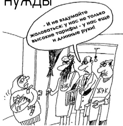
НА РИС.: ОТ РЕФОРМЫ ЖЖХ НЕ СКОРЕШЬСЯ!

Согласно тексту документа, необходимость изменения правил возникла из-за вала обращений граждан, недовольных резким ростом платы, и невозможности вычислить фактически потребленные объемы услуг. Своим обращением Госдума признает, что нормативная база несовершенна и не