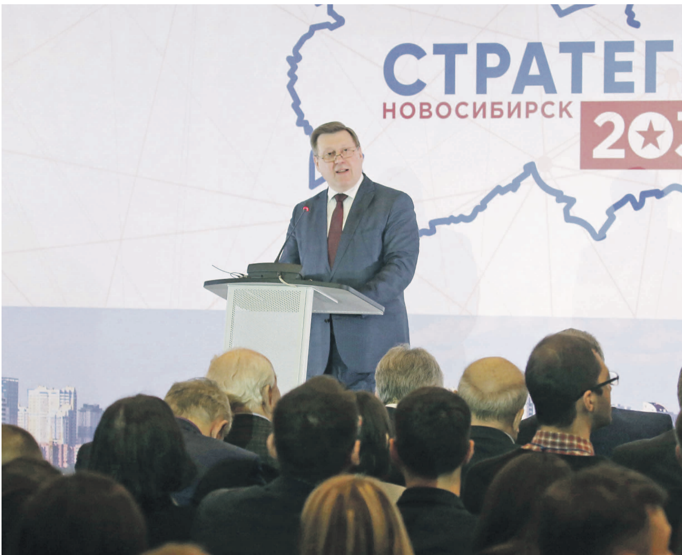
НА ФОТО: МЭР НОВОСИБИРСКА ДАЛ СТАРТ ОБСУЖДЕНИЮ СТРАТЕГИИ РАЗВИТИЯ ГОРОДА