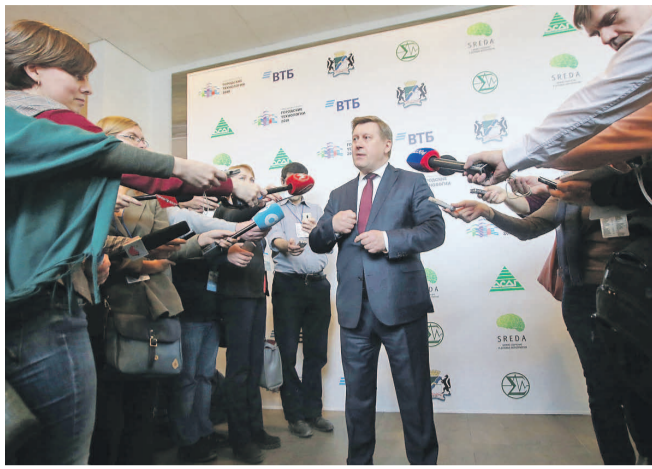
НА ФОТО: АНАТОЛИЙ ЛОКОТЬ ОТВЕЧАЕТ НА ВОПРОСЫ ЖУРНАЛИСТОВ