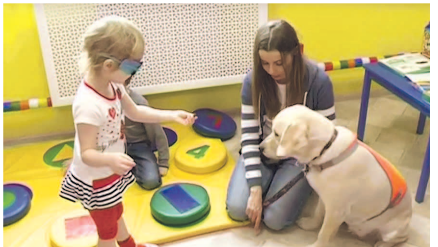
НА ФОТО: ЛАПА — ЛЮБИМИЦА ДЕТЕЙ

— Это не просто центр, куда приходят люди, чтобы чем-то заниматься и восстанавливаться. Слепота — это навсегда. Людям надо дать возможность