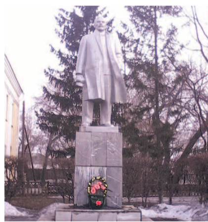
НА ФОТО: ПАМЯТНИК ТАИТ В СЕБЕ УГРОЗУ

— За памятником и территорией вокруг мы всегда следили сами, — рассказала первый секретарь Чистоозерного