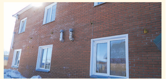
НА ФОТО: ДОМ ПО УЛИЦЕ МИРА