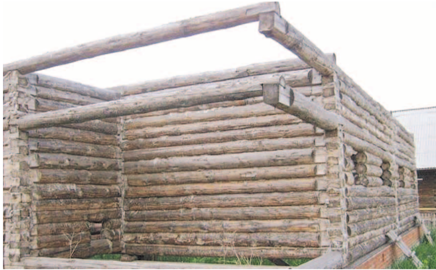
НА ФОТО: СРУБ ПОСТАВЛЕН В ДОЛГ, НА ДАЛЬНЕЙШЕЕ СТРОИТЕЛЬСТВО ДЕНЕГ НЕТ