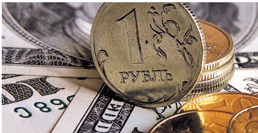
НА ФОТО: ЗА 1 ДОЛЛАР В НОВОСИБИРСКИХ ОБМЕННИКАХ ПРОСЯТ 65 РУБЛЕЙ

Документ также предлагает ужесточить санкции против российских госбанков, заблокировав любые опера-