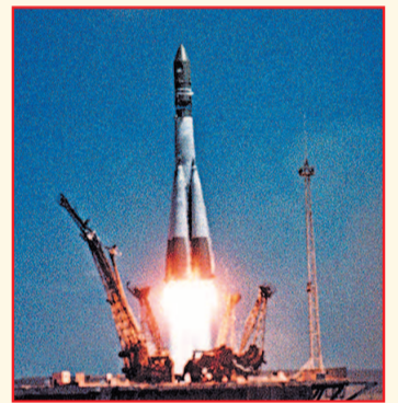
НА ФОТО: СТАРТ «ВОСТОК-1»

12 апреля 1961 года стал в нашей стране днем национальной гордости и славы. Юрий ГАГАРИН первым в мире на космическом корабле «Восток-1» совершил полет на околоземную орбиту. Этот триумф стал возможным благодаря таланту, огромному труду и мужеству всех работников ракетно-космической отрасли. Полет продолжительностью всего 108 минут ознаменовал начало новой эры в развитии человечества.