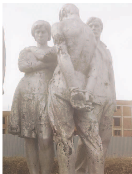
НА ФОТО: ПАМЯТНИК В КАРАСУКЕ

Скульптурная группа, изображающая героев, павших в борьбе за установление Советской власти в Сибири, расположена в самом центре Карасука.