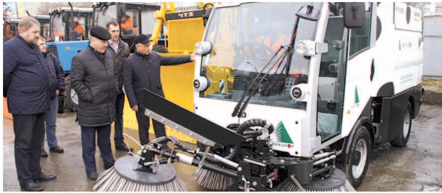
НА ФОТО: НОВАЯ ТЕХНИКА СДЕЛАЕТ ГОРОД ЧИЩЕ

11 апреля площадка ДЭУ-1 превратилась в своеобразную «выставку достижений» уборочной техники — именно отсюда должен был дан старт работе новых машин, закупленных мэрией Новосибирска. Посмотреть на то, как функционирует техника, пришел мэр Новосибирска Анатолий ЛОКОТЬ .