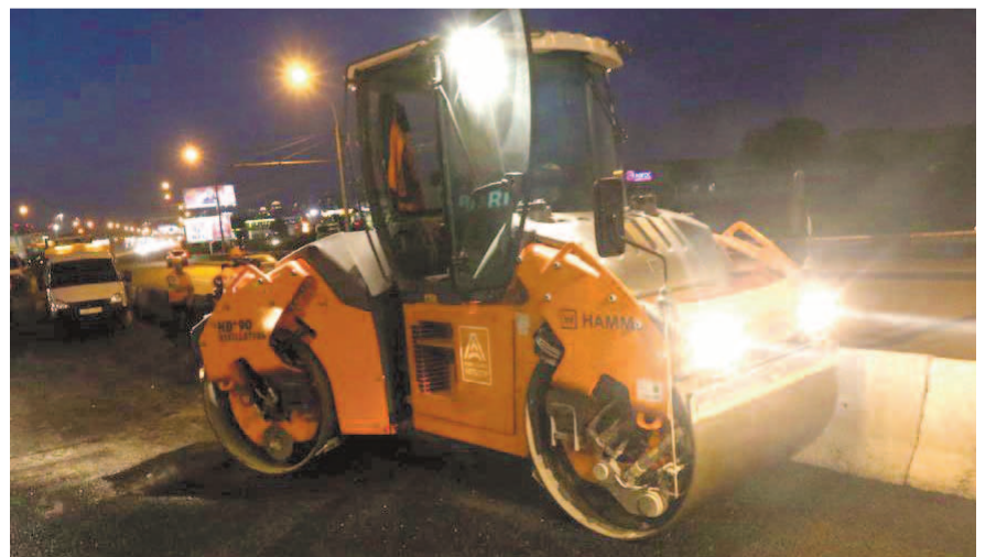
НА ФОТО: МАГИСТРАЛИ НОВОСИБИРСКА РЕМОНТИРУЮТ ДАЖЕ НОЧЬЮ

На дорогу укладывают горячую смесь, ее температура должна быть