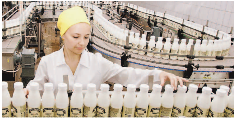
НА ФОТО: ЗАРПЛАТЫ НА БЕЛОРУССКИХ ПРЕДПРИЯТИЯХ ОБОГНАЮТ РОССИЙСКИЕ

Исследование подтвердило те факторы, которые указывались ранее, а именно — воздействие экономического кризиса 2014-2015 годов, девальвации рубля на уровень реальной заработной платы. Уровень 2012 года оказался преодолен только в 2017 году — по методике специалистов, реальная средняя заработная плата в 2017