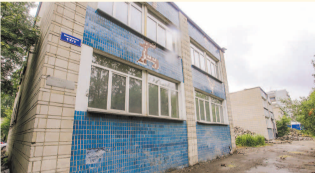
НА ФОТО: РЕКОНСТРУКЦИЯ ИДЕТ ПОЛНЫМ ХОДОМ