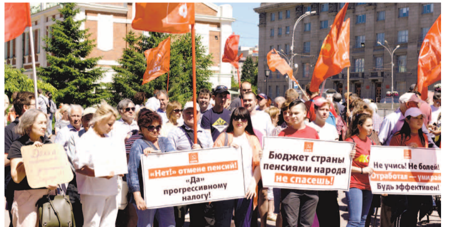
НА ФОТО: НОВОСИБИРЦЫ МИТИНГУЮТ ПРОТИВ ПОВЫШЕНИЯ ПЕНСИОННОГО ВОЗРАСТА