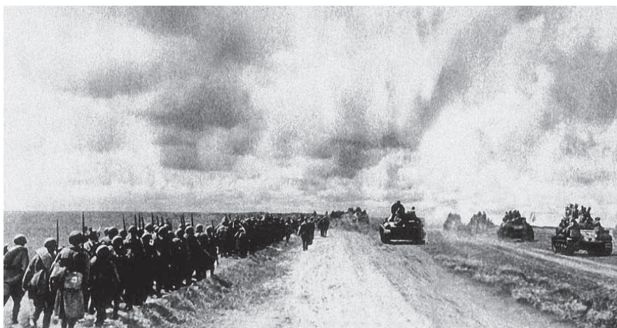
НА ФОТО: СОВЕТСКИЕ ВОЙСКА ВЫДВИГАЮТСЯ К ПЕРЕДНИМ РУБЕЖАМ ОБОРОНЫ. КУРСКАЯ ДУГА

19 июля войска 6-й гвардейской армии (Воронежский фронт), в которую вошла 67-я гвардейская стрелковая дивизия, начали контрнаступление и к 23 июля вышли на рубежи, занимаемые перед началом сражения. Части дивизии 7 августа освободили поселок