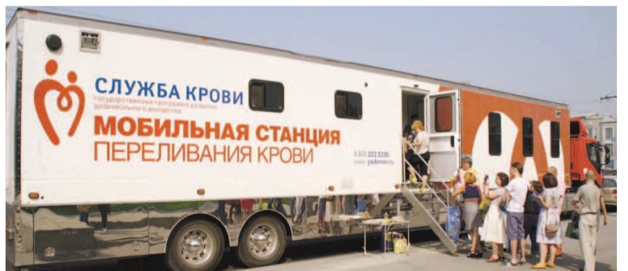
НА ФОТО: НОВОСИБИРЦЫ ПРИНЯЛИ АКТИВНОЕ УЧАСТИЕ В ДОБРОВОЛЬНОЙ СДАЧЕ КРОВИ

По словам Загребневой, обычно компания предоставляет организаторам 200-300 пачек мороженого. Но в этот раз, в честь праздника, на пункт сдачи крови привезли полтысячи штук.