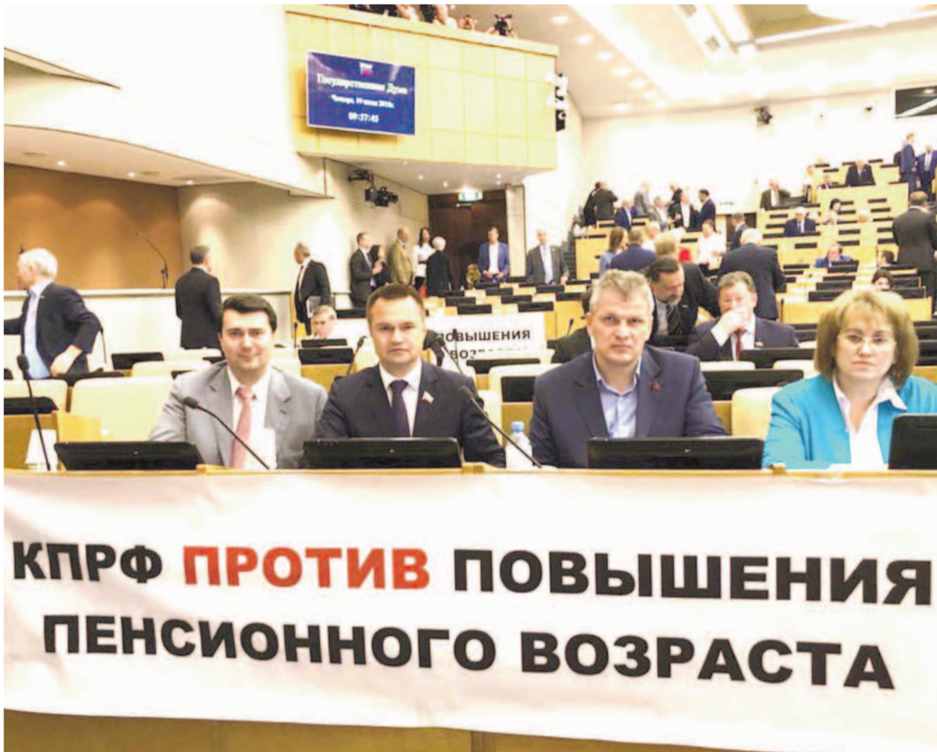
НА ФОТО: ФРАКЦИЯ КПРФ В ГОСУДАРСТВЕННОЙ ДУМЕ ЗАЩИЩАЕТ ИНТЕРЕСЫ ПРОСТЫХ ГРАЖДАН