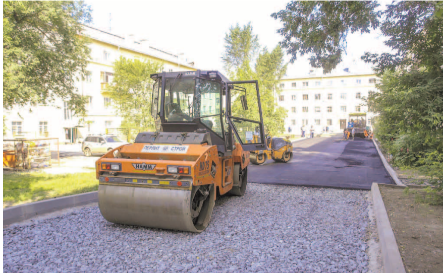
НА ФОТО: ВО ДВОРАХ ЛЕНИНСКОГО РАЙОНА КИПИТ РАБОТА ПО БЛАГОУСТРОЙСТВУ

— В этом году значительно улучшилось взаимодействие между структурами мэрии, жильцами, общественниками и подрядными организациями. Это отмечают все, и это, безусловно, существенно повышает качество ра-