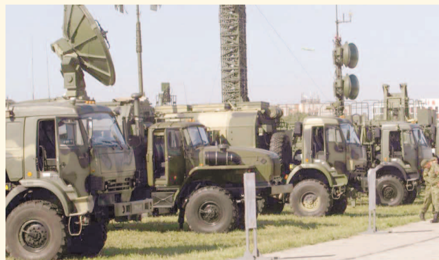
НА ФОТО: «КРАСУХА» НА СТРАЖЕ НЕБА РОДИНЫ

Учения подразделений радиоэлектронной борьбы прошли в Сибири, на Урале и в Поволжье.