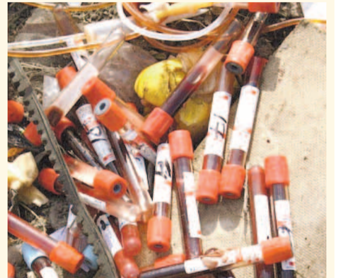
НА ФОТО: АМПУЛЫ С КРОВЬЮ НА СВАЛКЕ В УБИНСКОМ