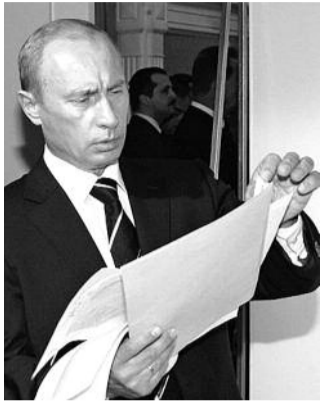
● НА ФОТО: ПУСТЬ ПОЧИТАЕТ!