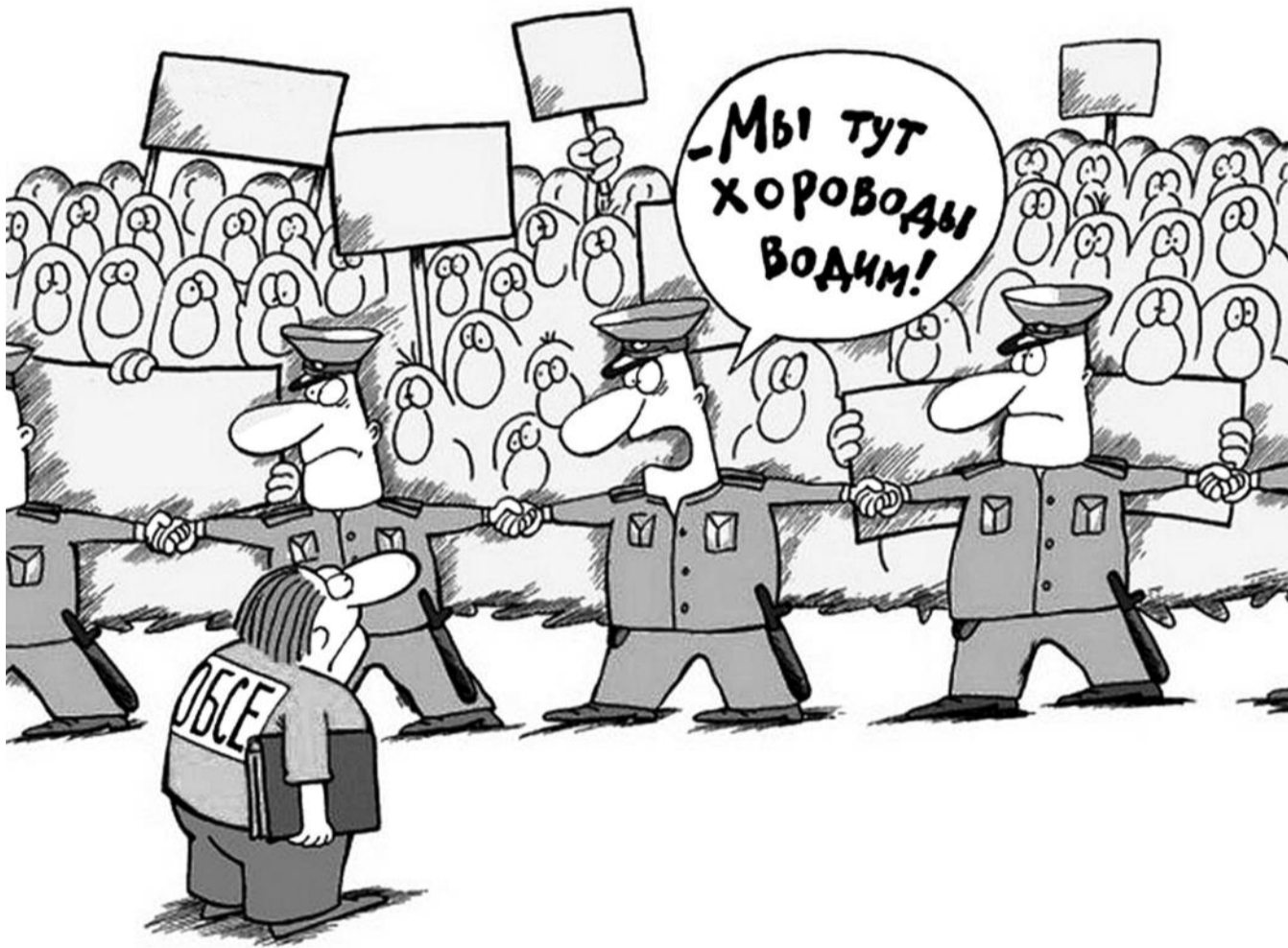
● НА РИС.: ЗАКРУЧИВАНИЕ ГАЕК ПРОДОЛЖАЕТСЯ — СКОРО ВОКРУГ КАЖДОГО ИЗ НАС ТАКИЕ ХОРОВОДЫ БУДУТ ВОДИТЬ