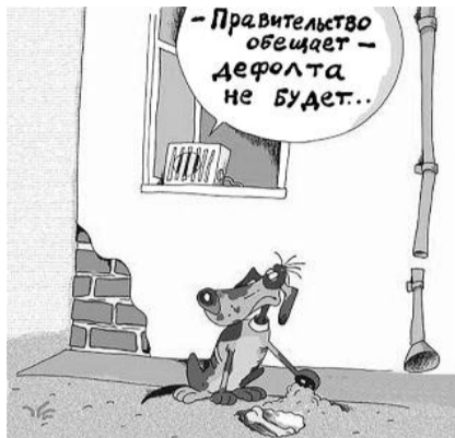
НА РИС.: ДАЖЕ СОБАКИ НЕ ВЕРЯТ

— Выиграют от этого страны-импортеры, которые станут за нефть платить меньше, — говорит Ренат Сулейманов. — Что же касается экспортеров, в первую очередь