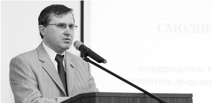
● НА ФОТО: ОДИН ИЗ АВТОРОВ ЗАКОНОПРОЕКТА «О НАРОДНОМ ОБРАЗОВАНИИ» ОЛЕГ СМОЛИН

ров и преподавателей. В-третьих, проект закона «О народном образовании» 25 января внесен группой депутатов от КПРФ в Государственную думу. В июле должен быть внесен правительственный законопроект «Об образовании в Российской Федерации». Мы, естественно, будем требовать принятия нашего закона, или, как