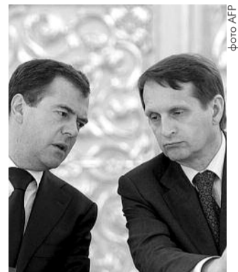
● НА ФОТО: СЕРГЕЙ НАРЫШКИН НЕ ХОЧЕТ В «ЕДИНУЮ РОССИЮ»

Сергей НАРЫШКИН объявил о своем решении не вступать в ряды «Единой России», хотя он и входит в состав ее руководства. Эксперты считают, что председатель Государственной думы приспосабливается к новым условиям. Ведь когда оппозиция сильна, игнорировать ее не получится, поэтому с ней необходимо будет вести диалог. Не являясь членом «ЕдРа», шансы для организации нормального диалога выше.