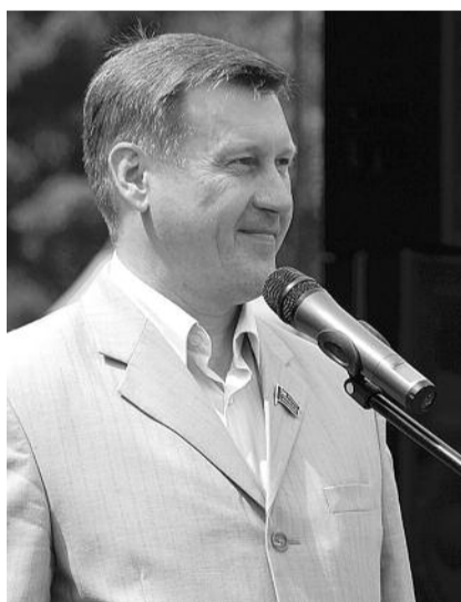
● НА ФОТО: АНАТОЛИЙ ЛОКОТЬ НА ОТКРЫТИИ «ДНЯ ПРАВДЫ» В 2011 ГОДУ

И еще один аспект. Особое значение имеет такая дата, как день рождения А.С. ПУШКИНА. Это очень важная дата. Именно по инициативе КПРФ президент России указом утвердил День русского языка и День рождения Пушкина. Это наша инициатива, и пройти мимо мы не можем. Мы живем в такие времена, что русский язык, нашу литературу надо защищать. Нужно проводить мероприя-