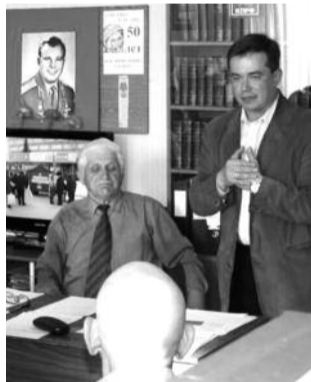
■ НА РИС.: ЗАСЕДАНИЕ РАЙКОМА

11 мая в Заельцовском райкоме КПРФ прошла отчетная конференция, которая подвела итоги работы коммунистов района за год. Вспомнить можно было многое, но главным достижением заельцовцев был признан триумф районной организации на выборах в Заксобрание — все четыре депутата в районе избраны от КПРФ.