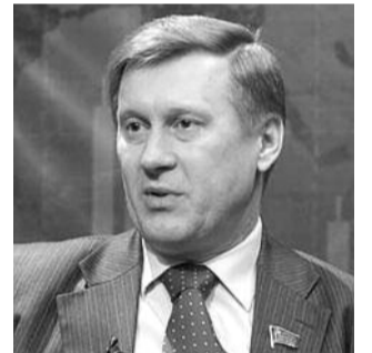
● НА ФОТО: АНАТОЛИЙ ЛОКОТЬ

«Формат Правительственного часа мог бы быть и открытым, потому что многие вещи, которых касались сегодня, открыто обсуждаются в СМИ. Я думаю, что уход от публичности во многом говорит о запущенности этого вопроса.