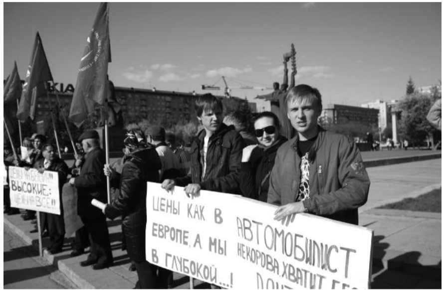
● НА ФОТО: АВТОМОБИЛИСТ — НЕ КОРОВА!

— Участниками мероприятия было сделано все, чтобы не создавать аварийно-опасной ситуации. Мы пытались продемонстрировать, что может произойти с любым автомобилистом при нынешней политике власти в отношении цен на бензин.