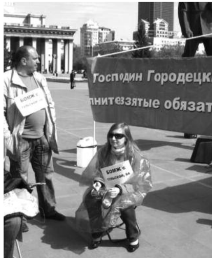
● НА ФОТО: БЕЗДОМНЫЕ ПО ВОЛИ ВЛАСТИ