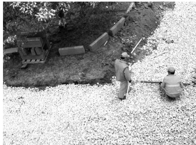
● НА ФОТО: А КАК СДЕЛАЮТ — ПРОВЕРИМ!