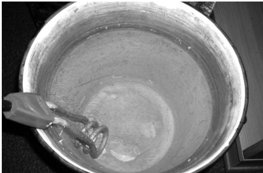
● НА ФОТО: ОТКЛЮЧИЛИ ГОРЯЧУЮ ВОДУ — КИПАТИЛЬНИК, ПЛЮС СЧЕТА ЗА ЭЛЕКТРИЧЕСТВО!

Депутат отметил, что в постановлении правительства РФ «О порядке предоставления коммунальных услуг гражданам» значится, что в случае непредоставления коммунальных услуг или предоставления коммунальных услуг ненадлежащего качества потребитель уведомляет об этом аварийно-диспетчерскую службу. Сообщение о непредоставлении коммунальных услуг или предоставления коммунальных услуг ненадлежащего качества может быть сделано потребителем в письменной форме