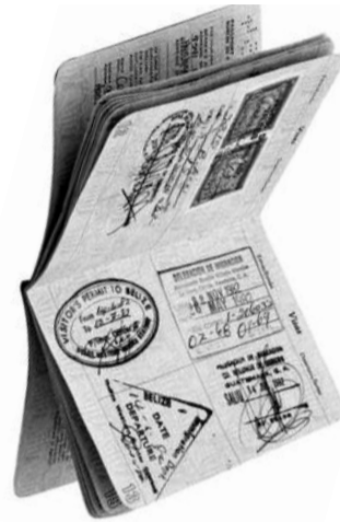
● НА ФОТО: ШТАМП... И ПРОЩАЙ, РОДИНА!

За две недели перед ее отъездом (они ждали рейс на Ганновер здесь) мы о многом вспоминали, иногда хохотали до слез, как бывало раньше (мне казалось, что я разучилась смеяться за годы после возвращения в Россию из Казахстана, где прожила 40 лет). Жалко, что покинули нас эти