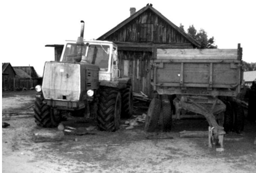
■ НА ФОТО: ЧТО ТЕПЕРЬ, СТАВИТЬ ТРАКТОРА НА ПРИКОЛ?