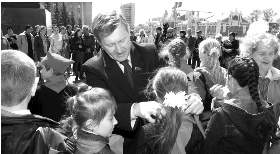
● НА ФОТО: ПРИЕМ В ПИОНЕРЫ 19 МАЯ 2009 ГОДА НА ПЛОЩАДИ ЛЕНИНА