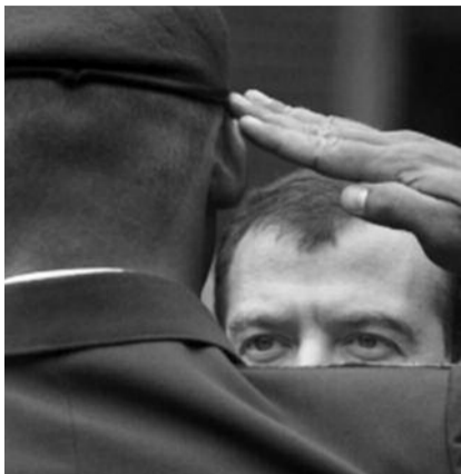
● НА ФОТО: ПРИНИМАЙТЕ «ПАРАД!»

Многим военнослужащим, а также гражданам, уволенным с военной службы, отказано в предоставлении ранее распределенного жилья в связи с незначительным превышением метража общей жилой площади. Это случилось в результате принятия Госдумой 08.12.2010г. поправок в ФЗ «О статусе военнослужащих». После незначи-