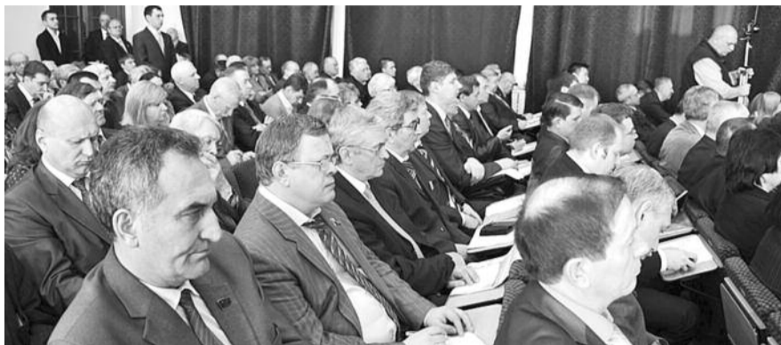
НА ФОТО: 31 МАРТА СОСТОЯЛСЯ XII СОВМЕСТНЫЙ ПЛЕНУМ ЦК И ЦКРК КПРФ

— Совещание началось с оценки положительного опыта Новосибирской областной организации. Поскольку в этом году празднуется 100-летие газеты «Правда», а новосибирские коммунисты уже в пятый раз проведут фестиваль левой прессы «День Правды», Геннадий Зюганов рекомендовал всем партийным организациям использовать опыт Новосибирска и провести массовые праздники, посвященные юбилею старейшей газеты страны и нашей главной партийной газеты.