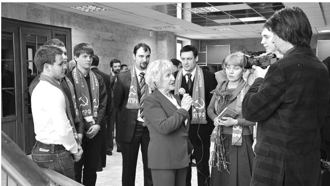
● НА ФОТО: РАБОТАЕТ СЪЕМОЧНАЯ ГРУППА ТЕЛЕВИДЕНИЯ КПРФ

Иван МЕЛЬНИКОВ, первый заместитель Председателя ЦК КПРФ