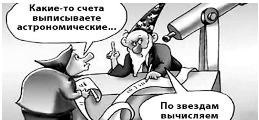
● НА РИС.: «КОММУНАЛЬНЫЕ АСТРОНОМЫ»