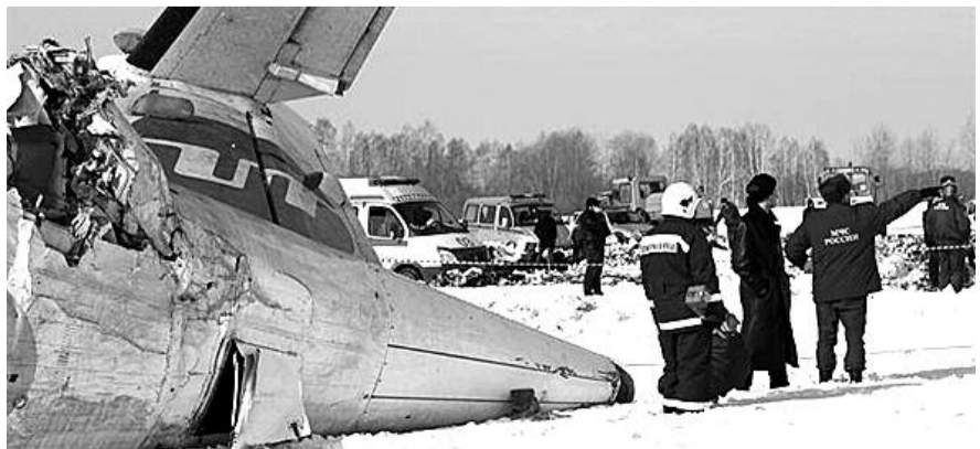
■ НА ФОТО: НА БОРТУ ВОЗДУШНОГО СУДНА НАХОДИЛИСЬ 43 ЧЕЛОВЕКА