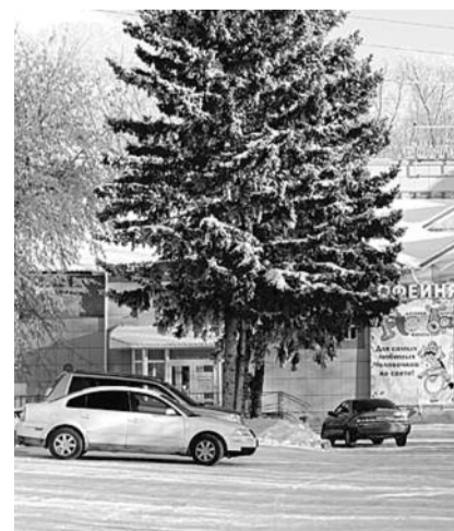
■ НА ФОТО: РАЗВЛЕКАТЕЛЬНОМУ ЦЕНТРУ НЕ ХВАТАЕТ ПАРКОВОЧНЫХ МЕСТ

На основании обращений жителей Левобережья и ТОС «Больничный городок» в апреле 2011 года расположенному рядом с парком развлекательному центру было выписано предписание в оформлении документации по уходу за прилегающей территорией, т.е. за сквером. Но руководство этого предприятия, проигнорировав предписание, не стало оформлять документы, а занялось вырубкой деревьев. Чтобы расширить себе автостоянку, коммерсанты вырубали 24 березы, выкопали 10 туй, убрали цветник в десять метров и засыпали эту территорию галькой. На прилегающей территории Доски истории микрорай-