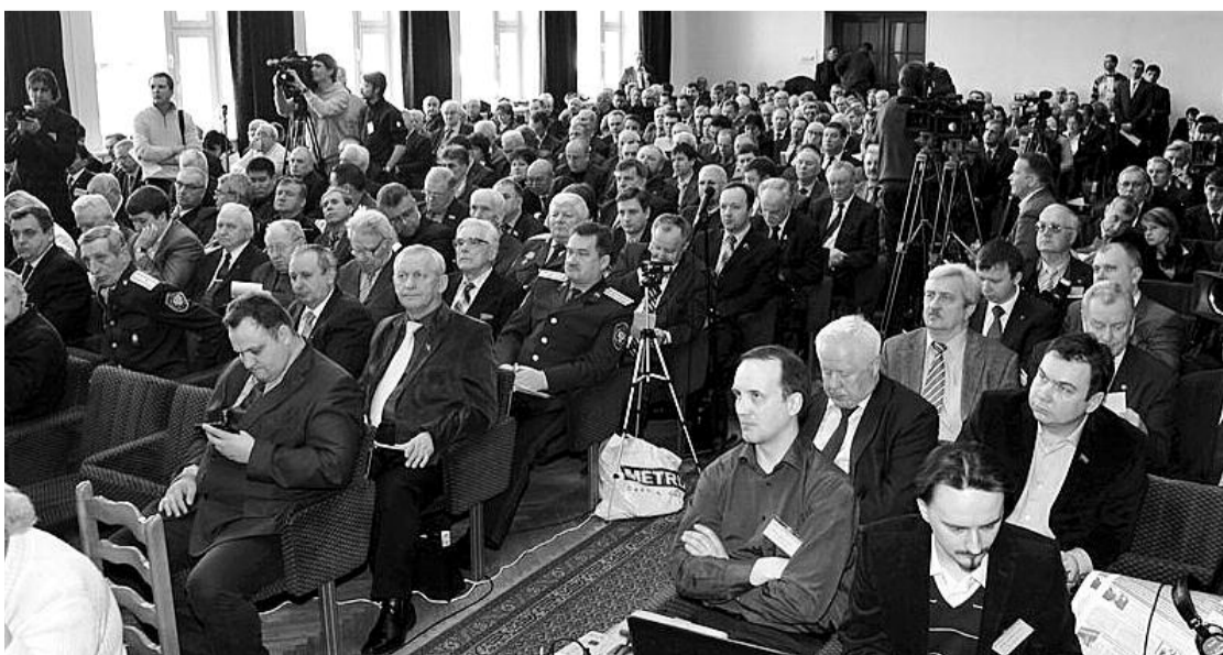
● НА ФОТО: ИДЕТ РАБОТА XII СОВМЕСТНОГО ПЛЕНУМА ЦК И ЦКРК КПРФ