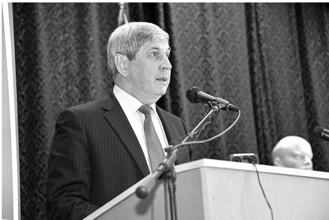
● НА ФОТО: ПЕРВЫЙ ЗАМЕСТИТЕЛЬ ПРЕДСЕДАТЕЛЯ ЦК КПРФ ИВАН МЕЛЬНИКОВ ВЫСТУПАЕТ НА ПЛЕНУМЕ ЦК И ЦКРК КПРФ

Однако во время выборов Президента России ничего подобного не было, оранжевая карта разыгрывалась в конъюнктурных интересах. Достаточно напомнить, что и на Украине, и в Грузии, и в Киргизии, и в Молдове поводом к протестным акциям стали поражения на парламентских выборах прозападно ориентированных политических партий, активисты и сторонники которых были ангажированы и бескомпромиссны. В России же основной силой, у которой на парламентских выборах украли голоса, была наша партия. При честном подсчете в шестом