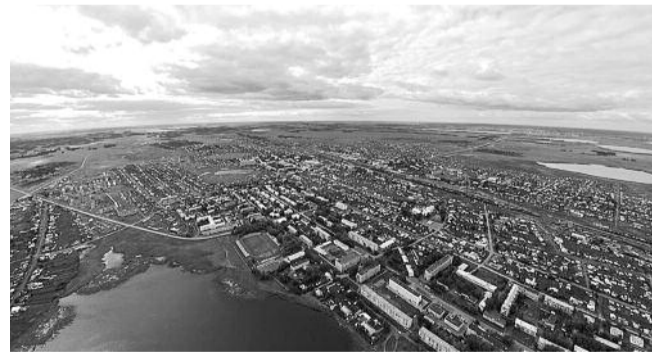
● НА ФОТО: В РЕЕСТРЕ ВЕТХОГО ЖИЛЬЯ БАРАБИНСКА ЧИСЛИТСЯ 61 ДОМ

— На заседании бюджетного комитета я узнала, что Барабинск не получит ничего на реализацию данных программ. А людям грозит гибель в ветхих домах, которые могут в любой момент обвалиться, — говорит депутат.