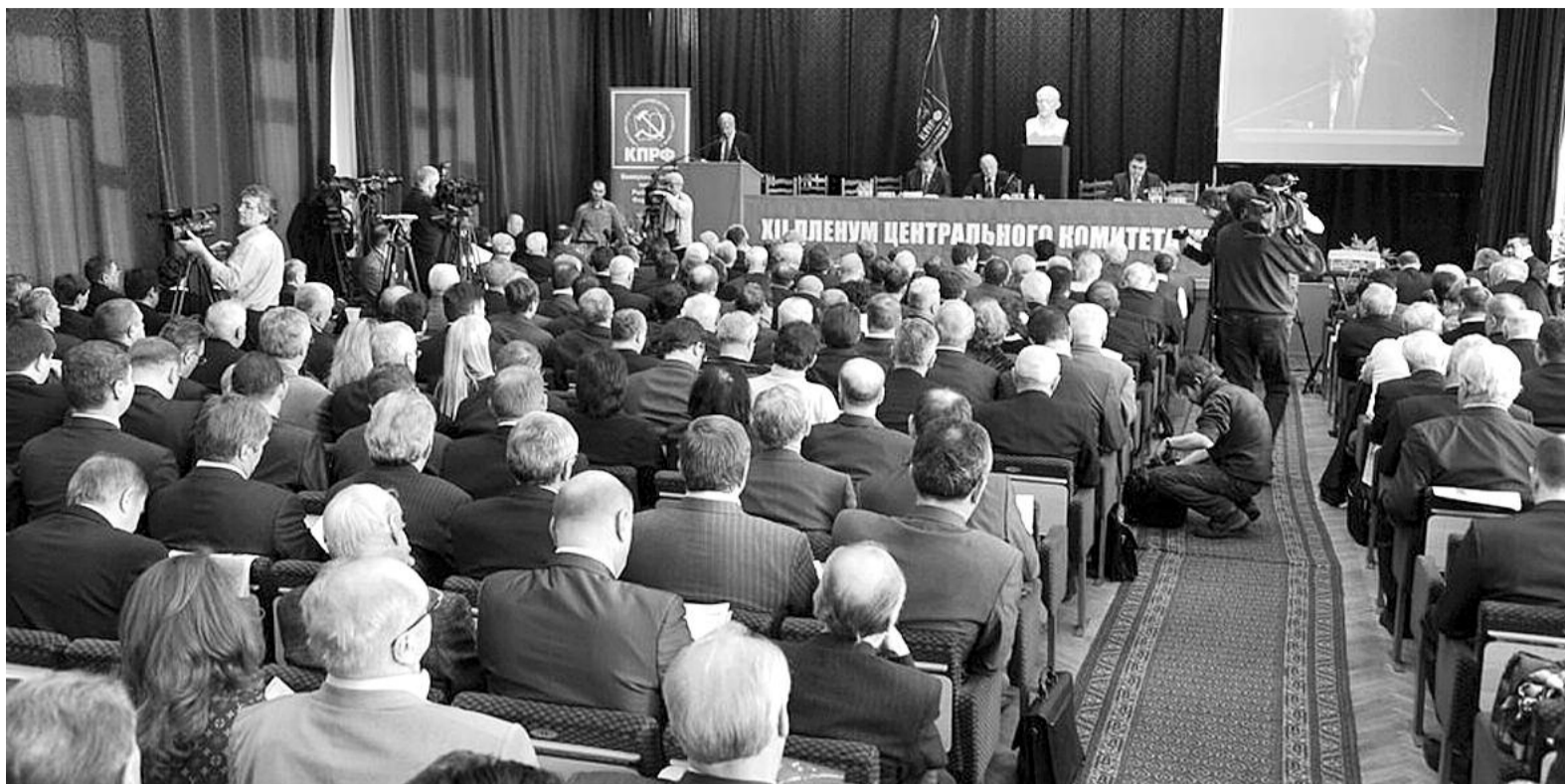
● НА ФОТО: ИДЕТ XII СОВМЕСТНЫЙ ПЛЕНУМ ЦК И ЦКРК КПРФ

Например, 15 марта Комитет по собственности, которым руководит наш депутат С.А. Гаврилов, принял решение рекомендовать Государственной думе принять в первом чтении законопроекты по вопросам национализации, деприватизации награбленной в 90-е собственности. А ведь сколько лет мы не могли вынести