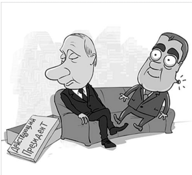
карикатура Сергея ЕЛКИНА / РОУТ.РУ