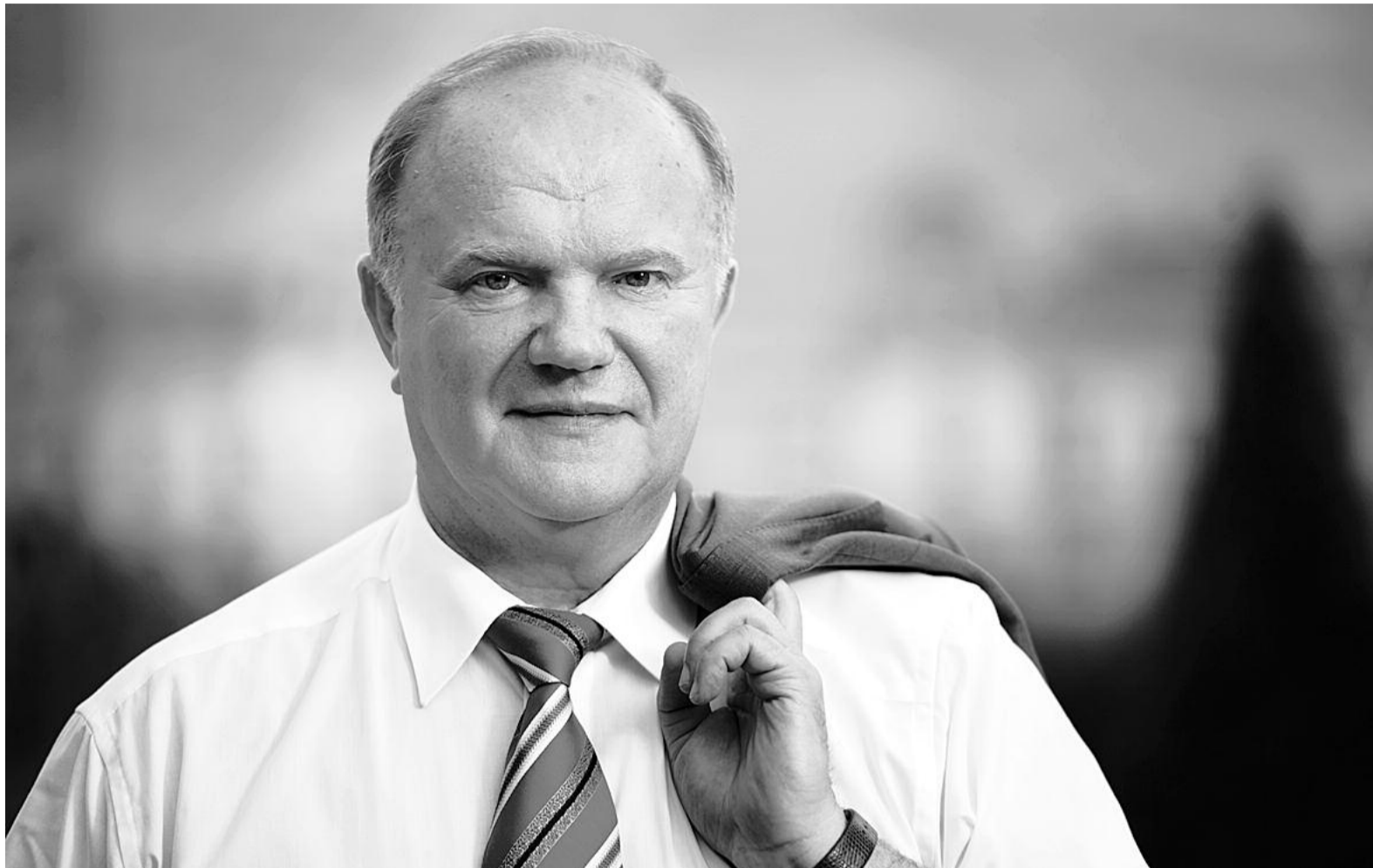
● НА ФОТО: ПРЕДСЕДАТЕЛЬ ЦК КПРФ ГЕННАДИЙ ЗЮГАНОВ

Но даже с учетом этих чудовищных условий результат КПРФ на парламентских и президентских выборах нас не устраивает. Демонстрировать обществу воровство голосов и чиновничий произвол крайне необходимо, но жаловаться на него бессмысленно. Мы знаем, с кем имеем дело. Эта публика будет бесчинствовать и воровать до тех пор, пока мы оставляем ей для этого малейшую возможность. Прервать череду сфальсифицированных выборов — это не значит пробудить совесть у представителей правящего режима.