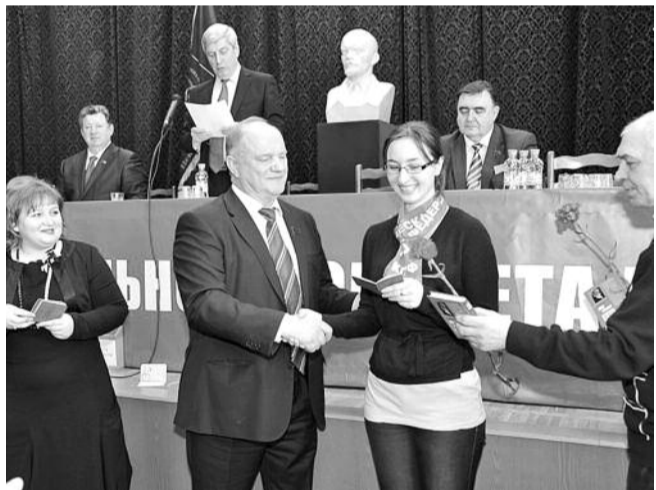
НА ФОТО: ПЛЕНУМ НАЧАЛСЯ С ВРУЧЕНИЯ ПАРТИЙНЫХ БИЛЕТОВ

— Все наши выводы, которые мы сделали на пленуме Новосибирского обкома КПРФ, были подтверждены. В частности, в своем докладе Иван Иванович МЕЛЬНИКОВ подчеркнул, что результаты выборов — это драматический факт, причем даже не для партии, а для Российской Федерации. Было отмечено, что власть добивалась этого результата не просто медийными, политическими или финансовыми ресурсами, а силой. В своем докладе Иван Иванович обрисовал пять основных технологий, с помощью которых власть добивалась результата: накрутка явки, переносные урны для голосования, дополнительные списки избирателей, карусели и манипуляция с протоколами. По нашей оценке, область манипуляций составила не менее 15% голосов избирателей.