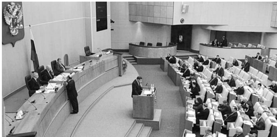
■ НА ФОТО: ПРОЕКТ ЗАКОНА «О НАЦИОНАЛИЗАЦИИ» ВЫНЕСУТ НА ОБСУЖДЕНИЕ ГОСДУМЫ

лежащих приватизации в приватизируемые. А как быть, если сложились экономические условия для перевода в госсобственность? Механизм такого нет. Ярчайший пример — «Юкос». Ну, отобрали его у ХОДОРКОСКОГО , не собираюсь лить слезы по олигарху, речь не о нем, а о работавшей организации, которая фактически была разрушена. Если б закон давал возможность перевести ее в государственную собственность — не было бы необходимости все ломать. Сменился собственник — и все.