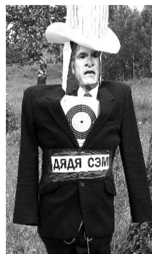
● НА ФОТО: АКЦИЯ «АНТИНАТО» 15 ИЮЛЯ 2006 ГОДА

Мэрия отказала в проведении пикета против размещения транзитного пункта НАТО в Ульяновске под надуманным предлогом. КПРФ не пойдет на поводу у мэрии и проведет пикет, несмотря на самоуправство местной власти.