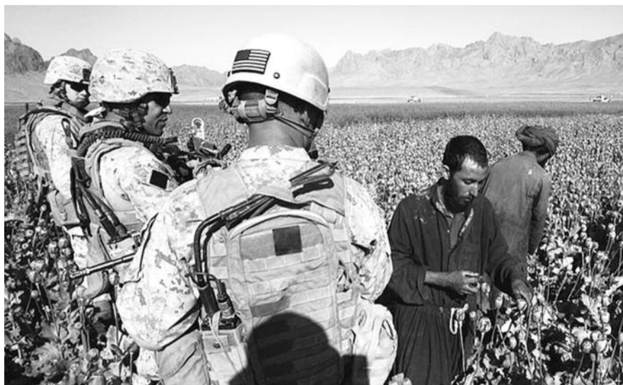
● НА ФОТО: АФГАНСКИЙ НАРКОТРАФИК «ПОД КОНТРОЛЕМ»

О заинтересованности в коммерческой составляющей у российской стороны в этой «сделке» не стесняются рассуждать и высокопоставленные российские чиновники. Особенным цинизмом отличился заместитель председателя правительства Дмитрий РОГОЗИН , который на своей страничке в интернете заявил, комментируя возмущение по поводу НАТО в Ульяновске: «Не думаю, что транзит через