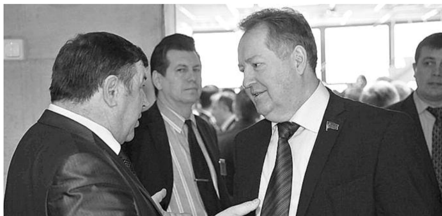
НА ФОТО: В КУЛУРАХ ПЛЕНУМА. ПЕРВЫЙ СЕКРЕТАРЬ КРАСНОЯРСКОГО КРАЙКОМА КПРФ ПЕТР МЕДВЕДЕВ (СЛЕВА) И ЗАМЕСТИТЕЛЬ ПРЕДСЕДАТЕЛЯ ЦК КПРФ ВЛАДИМИР КАШИН (СПРАВА)