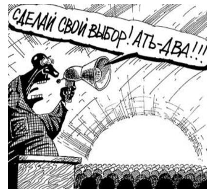
● НА РИС.: В ПРИКАЗНОМ ПОРЯДКЕ!