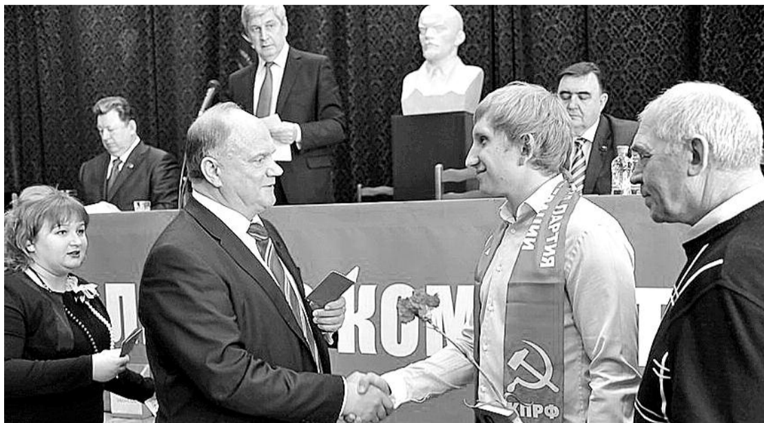
● НА ФОТО: ГЕННАДИЙ ЗЮГАНОВ НА ПЛЕНУМЕ ВРУЧИЛ ПАРТИЙНЫЕ БИЛЕТЫ НОВЫМ ЧЛЕНАМ КПРФ

Подчеркиваю, что борьба за принятие этих федеральных законов — задача не только фракции в Госдуме. Партийный