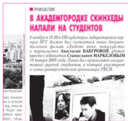
■ НА ФОТО: О СТРЕЛЬБЕ В НГУ НАША ГАЗЕТА ПИСАЛА В ПРОШЛОМ НОМЕРЕ («ЗНВ» №53)

На следующий день в средствах массовой информации появилось сообщение о возбуждении против нападавших уголовного дела по статье «Хулиганство, совершенное группой лиц». Признаков экстремизма, фашистской пропаганды (угрожающие крики нападавших «Кто тут против фашизма?») и других более серьезных статей