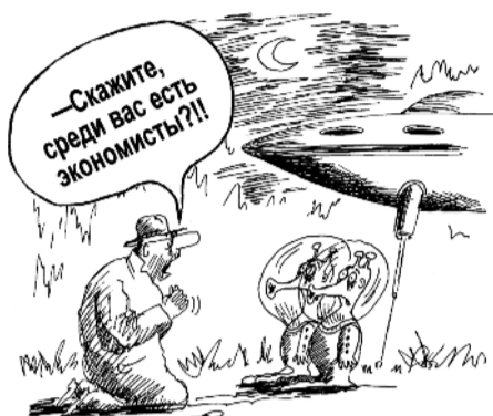
● НА РИС.: НЕЗЕМНЫЕ СЧЕТОВОДЫ

Запланированное не было выполнено. Вот некоторые реальные показатели: доля