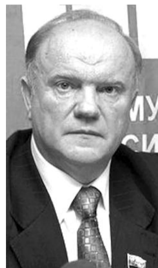
● НА ФОТО: ЛИДЕР КПРФ

В последние 20 лет в России была издана масса самых разнообразных учебных и «не очень» пособий по новейшей истории страны. О качестве большинства из этих «учебников» говорить не приходится, однако критика их не выходила чаще всего из учительских комнат, где учителя-историки комментировали данные «опусы». И вот после выхода учебника «История России. 1917-2009», написанных серьезными авторами, профессорами МГУ, разразился шум и гам на федеральном уровне.