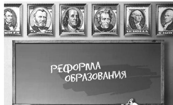
■ НА РИС.: НАШИХ ДЕТЕЙ ЖДЕТ «ДОЛЛАРОВОЕ» ОБРАЗОВАНИЕ

заказ будет дан по факту, то это будет одним из вариантов выхода из ситуации.