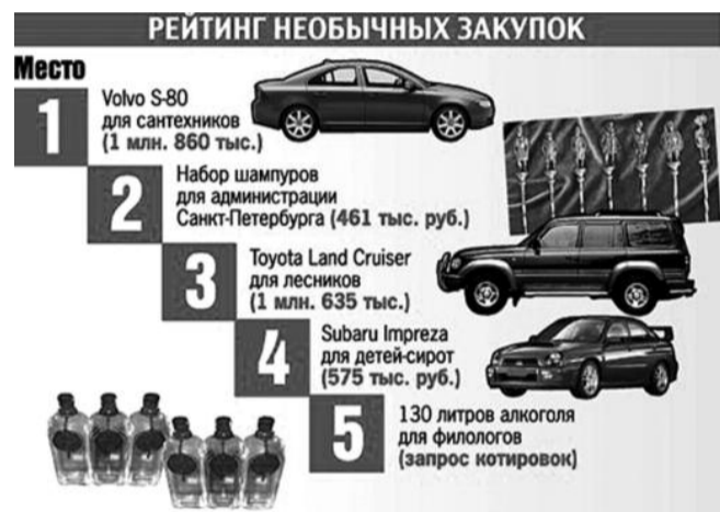
● НА РИС.: САМЫЕ ЭКЗОТИЧЕСКИЕ ГОСЗАКУПКИ В ИСТОРИИ РОССИИ

Хозяйственное управление мэрии Новосибирска купило два автомобиля: Toyota Camry за 1,22 млн. рублей и Audi за 3,6 млн. рублей, говорится в документации аукциона от 8 ноября 2010 г. За что платятся такие огромные деньги, можно узнать, прочитав рекламный буклет автодилера: «Благодаря роскошному интерьеру Audi A8 каждая поездка превращается в комфортное, расслабляющее путешествие. Большой запас свободного пространства порадует каждого пассажира, а передние и задние сиденья в новом исполнении обеспечивают высочайший уровень комфорта». По данным НГС.Новости, мэрии продана Audi A8 Quattro с 4,2-литровым двигателем мощностью 372 лошадиные силы. В техническом задании к конкурсу указано, что Audi цвета «серый улун» укомплектована, в частности, 13 динамиками повышенной мощности и сабвуфером, декоративными планками из корня орехового дерева, пакетом для курильщика и проч. Кто будет ездить с таким неземным комфортом по городу, не оправившемуся от кризиса, пока остается тайной.