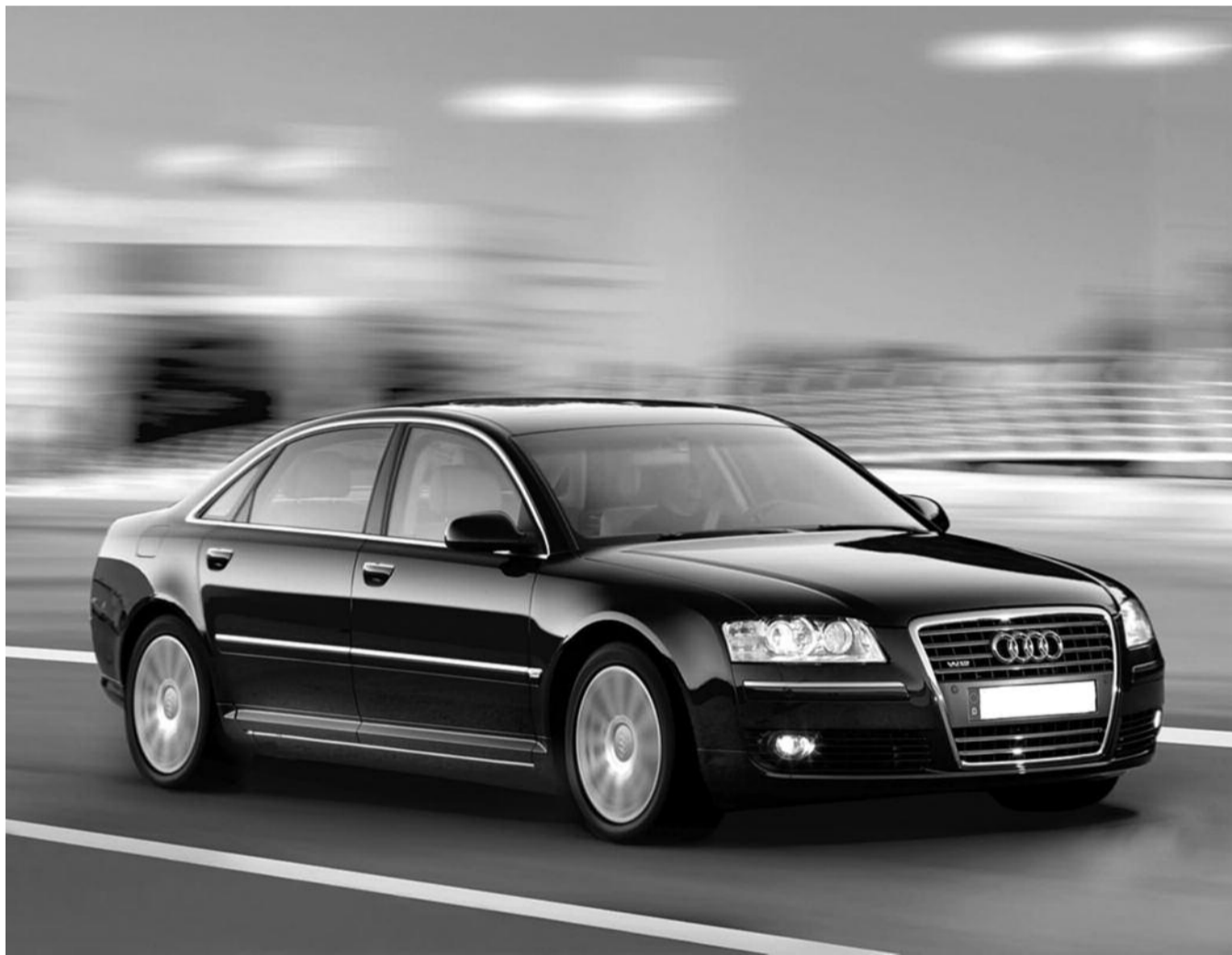
● НА ФОТО: НА ТАКОЙ МАШИНЕ И НА РАБОТУ ЕЗДИТЬ ПРИЯТНО