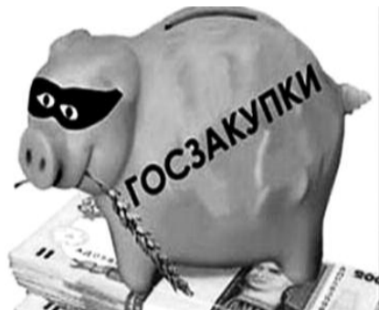
● НА РИС.: КОПИЛКА ДЛЯ НАШИХ НАЛОГОВ

Притчей во языцех стала закупка «золотых кроватей» для МВД. Но этот случай далеко не единственный — другие ведом-