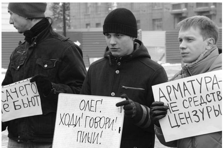
● НА ФОТО: ДЕПУТАТ АРТЕМ СКАТОВ (В ЦЕНТРЕ) ПОДДЕРЖАЛ ЖУРНАЛИСТОВ НА ПИКЕТЕ