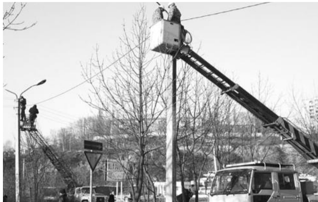
■ НА ФОТО: ИДЕТ РЕМОНТ УЛИЧНОГО ОСВЕЩЕНИЯ