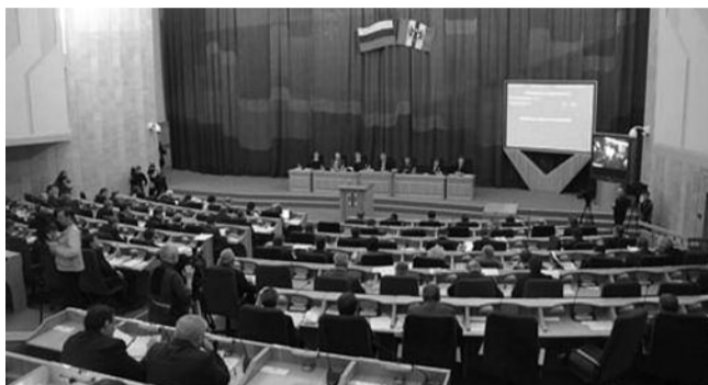
● НА ФОТО: НА СЕССИИ ЗАКОНОДАТЕЛЬНОГО СОБРАНИЯ

На состоявшейся 11 ноября сессии Законодательного собрания Новосибирской области депутаты-коммунисты не голосовали за бюджет на 2011 и на плановый период 2012 и 2013 годов.