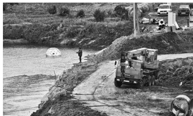
● НА ФОТО: НА МЕСТЕ БУДУЩЕГО ТРЕТЬЕГО МОСТА ПОКА ЛОВЯТ РЫБУ...