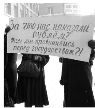
■ НА ФОТО: ПЕНСИОНЕРЫ СКАЗАЛИ «СПАСИБО» ГУБЕРНАТОРУ

Всколыхнулись новосибирские пенсионеры после решения губернатора В.А. ЮРЧЕНКО сократить количество льготных поездок в городском транспорте. Пикеты, митинги!