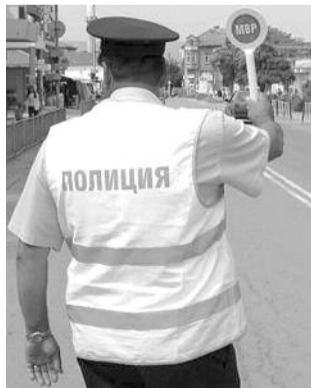
■ НА ФОТО: А НУ-КА, НА РЕФОРМУ СКИНУЛИСЬ

удостоверения сотрудников заменят на «полицейские» в течение текущего года. Главной проблемой на пути превращения милиции в полицию будет нехватка денег. Предложение о выделении МВД дополнительных средств на полицейскую реформу планируется направить в ведомство Алексея КУДРИНА во втором квартале. В сентябре министр финансов РФ Алексей Кудрин заявлял, что в целом реформа МВД обойдется стране в 217 млрд. рублей!