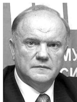
● НА ФОТО: ЛИДЕР КПРФ

8 февраля после завершения закрытых слушаний в Госдуме, посвященных проблемам безопасности и борьбе с терроризмом, Геннадий Зюганов рассказал о позиции КПРФ по этому вопросу.