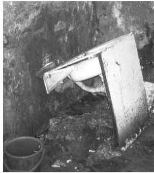
● НА ФОТО: ЖИТЕЛИ ДОМА №48 ПО УЛ. СИБИРЯКОВ-ГВАРДЕЙЦЕВ ЖИВУТ БЕЗ КАНАЛИЗАЦИИ УЖЕ ЧЕТЫРЕ МЕСЯЦА

Жители аварийного дома в центре Кировского района на протяжении четырех месяцев вынуждены обходиться без водоснабжения и канализации. Чиновники обвиняют в этом самих жильцов. Вопрос о расселении остается открытым.