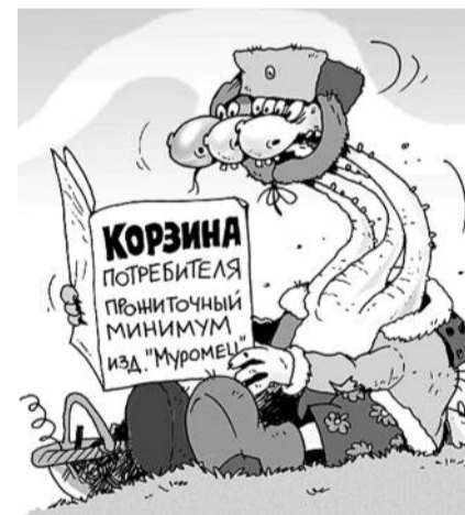
● НА РИС.: НА ТРОИХ ТОЧНО НЕ ХВАТИТ!

А теперь — к нашим, родным новосибирским ценам. Пройдемся по тому микрорайону, о котором уже писали («ЗНВ» №2 от 20 января 2011 года) и посмотрим на цены.