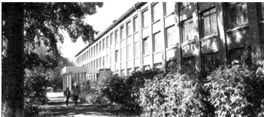
● НА ФОТО: УЧИТЕЛЯ ШКОЛЫ №74 НАЗЫВАЮТ ПЛАНЫ ЧИНОВНИКОВ «РЕЙДЕРСКИМ ЗАХВАТОМ»

— В нашей стране почему-то все школы хотят каким-то образом выделиться. Показать свою уникальность и значи-