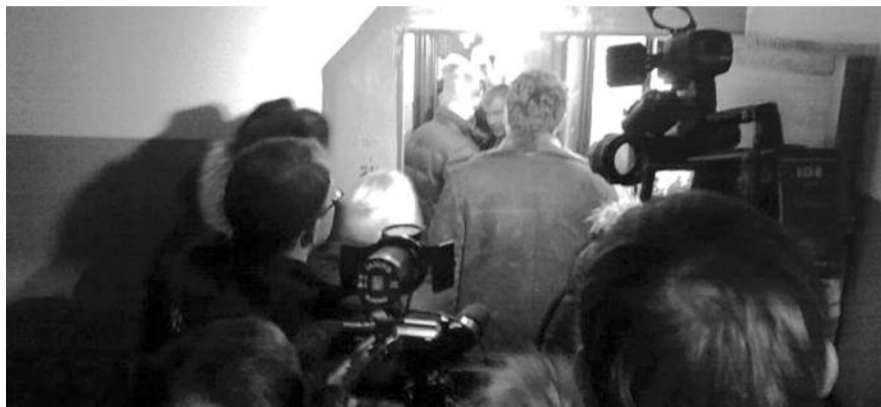
● НА ФОТО: ДВЕРЬ В КВАРТИРУ МЭРА В ОБЫЧНОМ ДОМЕ БЫЛА ВЗЛОМАНА БОЛГАРКОЙ

«Реально было смешно. Ну показуха какая-то, как будто не мэра брали, а отмо-