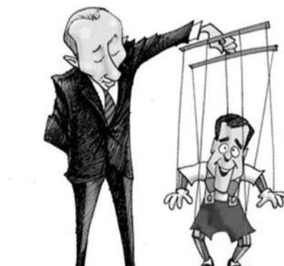
● НА РИС.: В ПРЕДДВЕРИИ ВЫБОРОВ—2012 ВНУТРИ ВЛАСТНОГО ТАНДЕМА ДЕЛЯТ РОЛИ...

Глава Следственного комитета Бастрыкин попробовал объяснить пре-