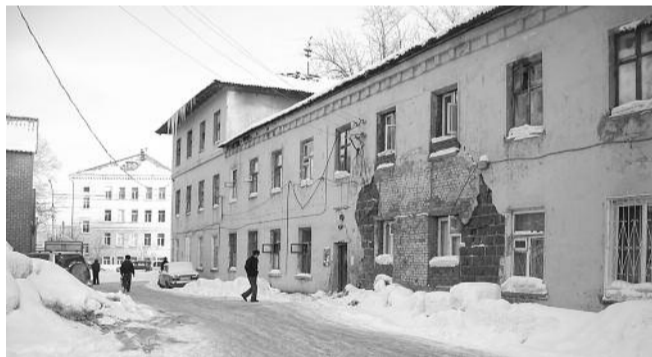
● НА ФОТО: ЧИНОВНИКИ ГОВОРЯТ, ЧТО ПРОВЕДЕНИЕ КАПРЕМОНТА НЕВОЗМОЖНО В СИЛУ ОТСУТСТВИЯ ФИНАНСОВЫХ СРЕДСТВ

Отчаявшиеся люди писали письма в инстанции — вплоть до администрации президента РФ, откуда пришел не очень обнадеживающий ответ, что дом ни сносу, ни расселению не подлежит.