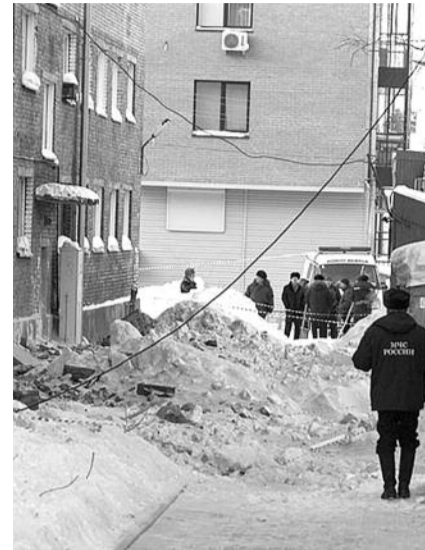
■ НА ФОТО: 4 ФЕВРАЛЯ ОБВАЛИЛАСЬ КРОВЛЯ ОБЩЕЖИТИЯ В ЦЕНТРЕ НОВОСИБИРСКА

— Нельзя допустить развала предприятия, потому что оно — градообразующее. В Чистоозерном в хорошие времена оно предоставляло поселку шестьсот рабочих мест. Нет только одного — политической воли заставить предприятие работать, — рассказал Локоть. — Люди, посвятившие всю жизнь этому предприятию, готовы работать там без зарплаты. Работать, толь-