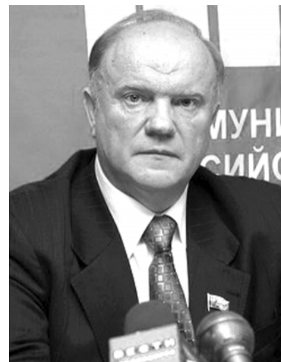
● НА ФОТО: ЛИДЕР КПРФ В НОВОСИБИРСКЕ

вами — это тоже результат Госсовета. Раньше нас не пускали на телевидение, а сейчас на вашем канале есть возможность хотя бы обсудить проблему. Но первый канал всячески уклоняется от этого. Ко мне приезжали из Парижа, взяли интервью, о Белоруссии, о выборах, сказали, будет прекрасный сюжет, специально 500 километров ехали. Звоню, спрашиваю, почему не показали, оказывается, я очень уважительно отнесся к выбору белорусского народа, к реформам, которые они провели. Вот если бы ругал, орал, то показали бы сразу и не один раз