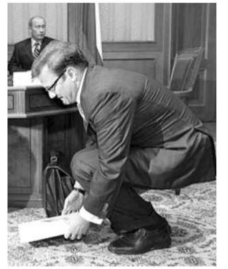
● НА ФОТО: ГЕРМАН ГРЕФ НА КОНЕ

Очередная «находка» правительства страны повергает в шок: «Сбербанк», колоссальное государственное финансовое учреждение, будет приватизировано.