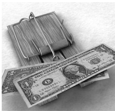
● НА ФОТО: НЕ УКРАДИ

По словам Чайки, возрастает число оправданных судами дел о коррупции. Только за первое полугодие 2010 года таких насчитывается уже 92 человека, что почти в два раза больше, чем в про-