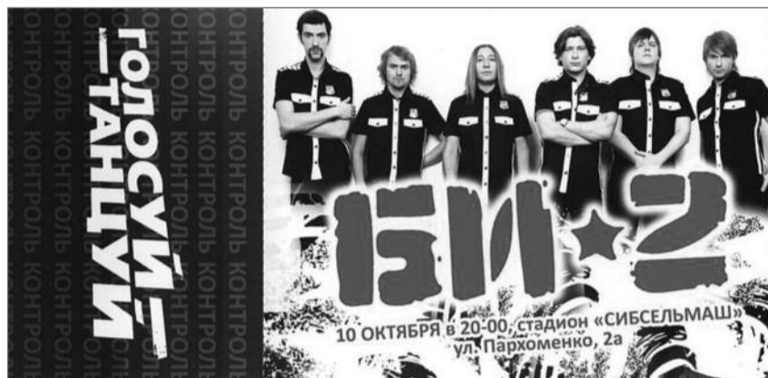
● НА ФОТО: АКЦИЯ «ГОЛОСУЙ-ТАНЦУЙ». ПРОГОЛОСОВАЛ — ПОЛУЧИЛ БИЛЕТ НА КОНЦЕРТ

Конечно, самым дорогими для власти на этих выборах стали голоса молодежи, для получения которых в разных районах были организованы концерты популярных