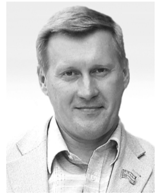
● НА ФОТО: АНАТОЛИЙ ЛОКОТЬ

Я хочу сказать спасибо, прежде всего, избирателям, поддержавших нас, но также я хочу поблагодарить и наших кандидатов. Тех, кто шел на выборы от Коммунистической партии Российской Федерации. Сегодня нужна смелость, чтобы выдвигаться по списку КПРФ. Нужно серьезное мужество кандидатов, чтобы противостоять тому административному ресурсу, который был направлен против них.