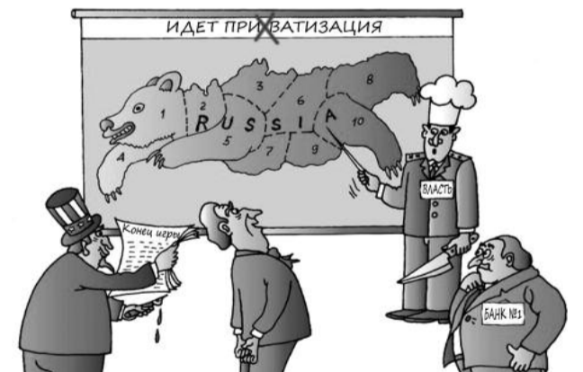
● НА РИС: ИДЕТ ПРОЦЕСС «РАСПИЛА» СТРАНЫ

Приватизировать «Сбербанк» его президент Герман ГРЕФ предложил еще в начале года. «Государству достаточно сохранить в «Сбербанке» долю в размере 25% плюс одна акция», — сказал он на форуме в Давосе в конце января, предложив начать с сокращения доли ЦБ до 50% плюс одна акция.