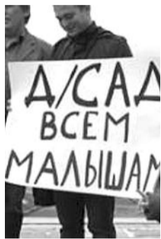
● НА ФОТО: ОСНОВНОЕ ТРЕБОВАНИЕ

Одновременно с выборами в Законодательное собрание в Новосибирске, как и во многих других российских городах, завершилась трехдневная голодовка участников Российского движения за доступное детское образование. Родители детсадовцев отказались от еды, чтобы привлечь внимание президента к проблеме.