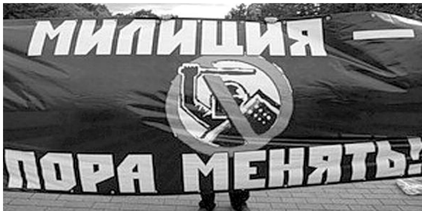
● НА ФОТО: ПОМОЖЕТ ЛИ ПРОСТОЕ ПЕРЕИМЕНОВАНИЕ?

Что касается реформы денежного довольствия сотрудников МВД после вступления в силу нового закона, то ее проведение потребует выделения из федерального бюджета 220 млрд рублей. В то же время Перова отметила, что в