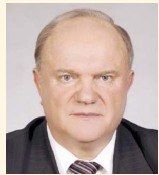
НА ФОТО: ГЕННАДИЙ ЗЮГАНОВ

— Мы в ближайшие дни отметим возвращение Крыма большим общенациональным митингом, в котором примет участие все народно-патриотическое движение во главе с Компартией, — рассказал Г.А. Зюганов. — Эта акция состоится здесь, в центре Москвы. Я бы очень хотел, чтобы она прошла как митинг единения и сплоченности.