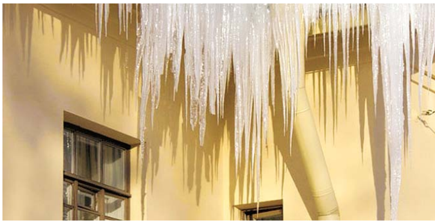
НА ФОТО: ЛЕД С КРЫШ ДОЛЖЕН БЫТЬ УБРАН