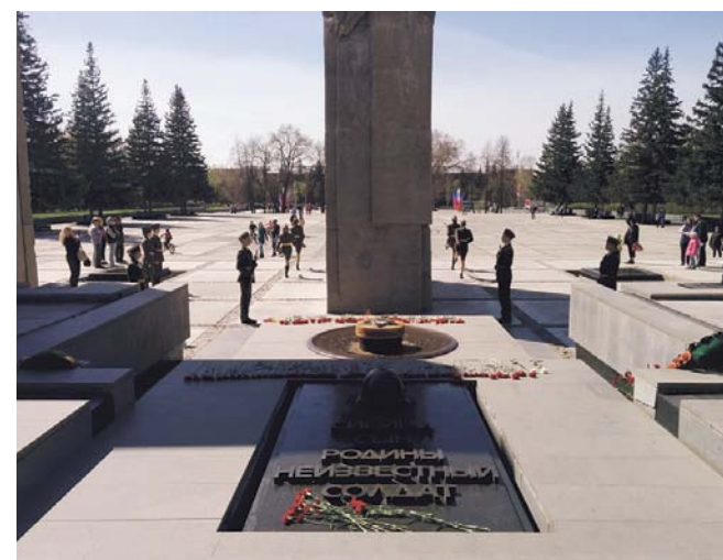
НА ФОТО: ПОСТ №1 В НОВОСИБИРСКЕ