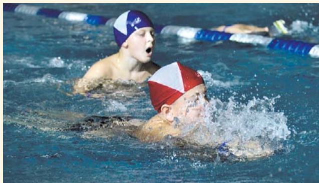
НА ФОТО: ШКОЛЬНИКИ СДАЮТ НОРМЫ ГТО