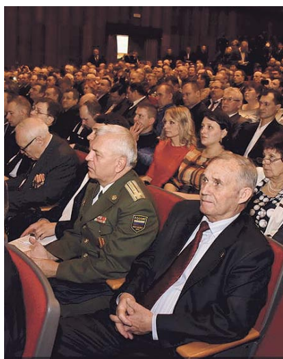
НА ФОТО: НА КОНФЕРЕНЦИИ

Перед присутствующими выступили представители трудовых коллективов, в том числе представители Мошковской области: директор «Совхоза