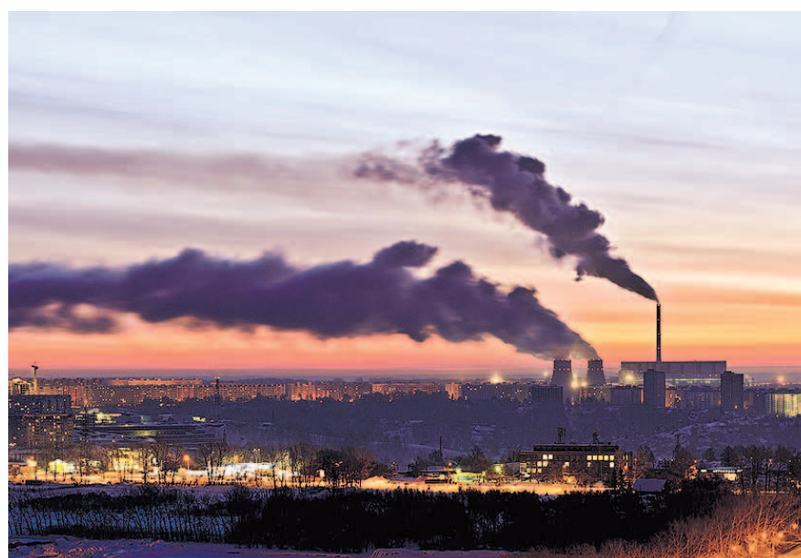
НА ФОТО: НОВОСИБИРСК — МЕГАПОЛИС, ДЛЯ КОТОРОГО ВАЖНА ЭКОЛОГИЧЕСКАЯ СИТУАЦИЯ

— За 5 лет было закрыто 7 угольных котельных. Какие-то переведены на газ, какие-то совсем закрыты, и объекты переведены на центральное теплоснабжение.