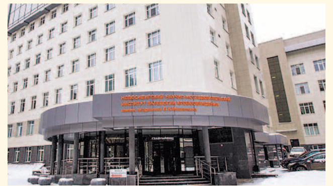
НА ФОТО: НОВОСИБИРСКАЯ КЛИНИКА ИМ. МЕШАЛКИНА