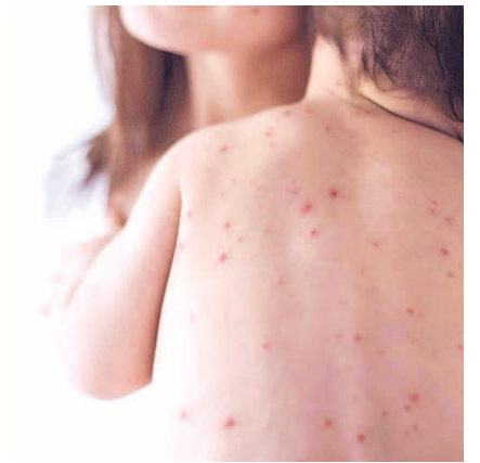
НА ФОТО: ЕДИНСТВЕННАЯ ЗАЩИТА ОТ КОРИ — СВОЕВРЕМЕННАЯ ВАКЦИНАЦИЯ

По словам Светланы Рычковой, болеют корью и дети, и взрослые, и статистика последних лет показывает, что в основном болеют именно взрос-