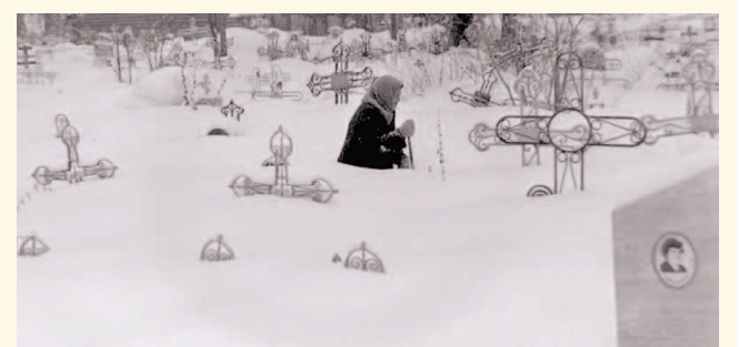
НА ФОТО: ДОБРАТЬСЯ ДО МОГИЛ ПОЧТИ НЕВОЗМОЖНО