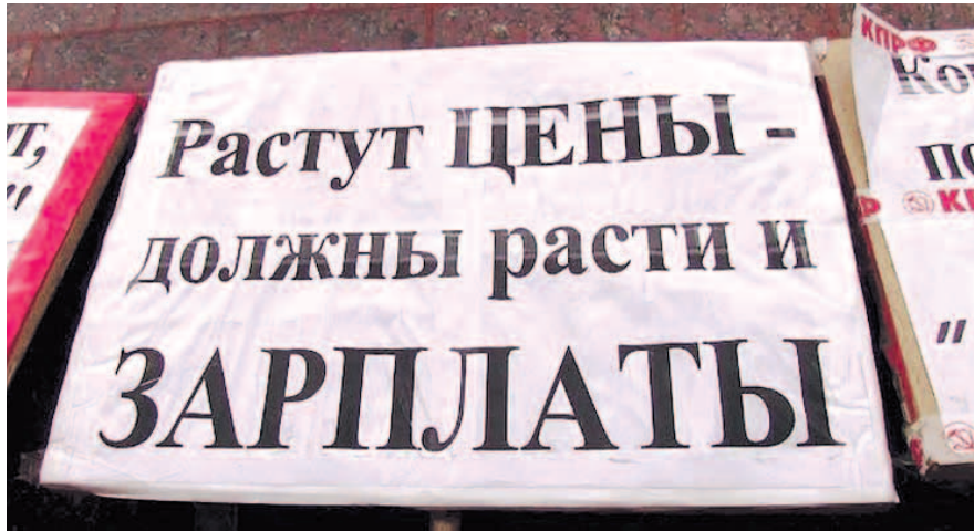
НА ФОТО: но чиновники ФАС так не считают

Возможно, малоадекватное реальности заявление Цыганова объясняется