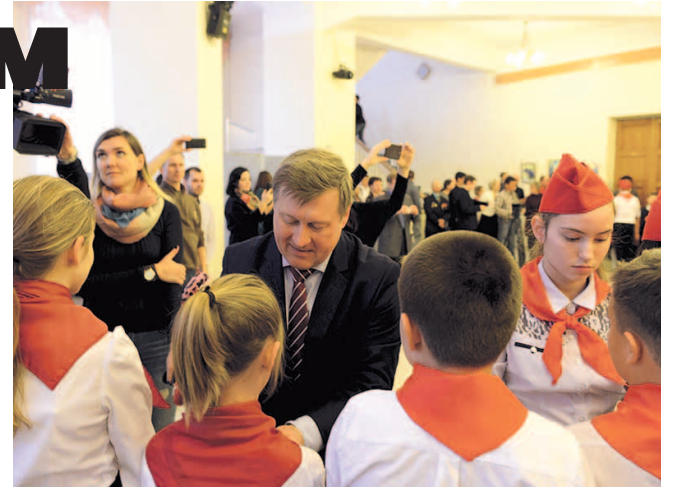
НА ФОТО: НОВОСИБИРСКИХ ШКОЛЬНИКОВ ПРИНЯЛИ В ПИОНЕРЫ

«В “Артеке” все к тебе дружелюбно, хотят помочь и взрослые, и дети. Мы всегда что-то придумывали, выступали. Там очень хорошая школа, в ней