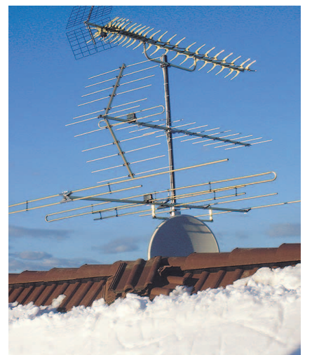
НА ФОТО: ГРЯДУТ НОВЫЕ ТЕХНОЛОГИИ

Для приема сигнала спутникового ТВ требуется тарелка в виде эллипса и приставка, работающая как декодер.