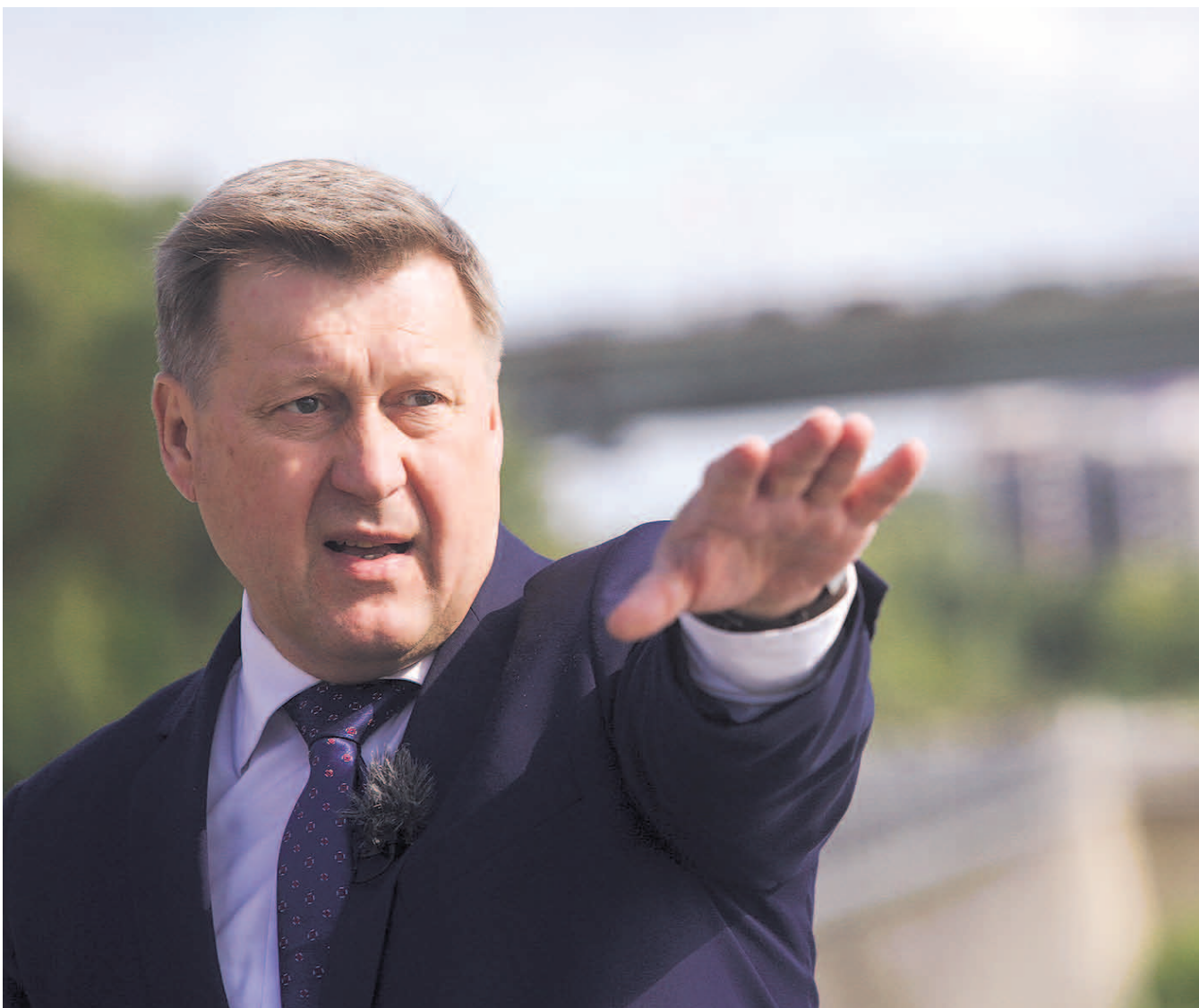
НА ФОТО: РЕЙТИНГ ПОДДЕРЖКИ НОВОСИБИРСКОГО ГРАДОНАЧАЛЬНИКА РАСТЕТ