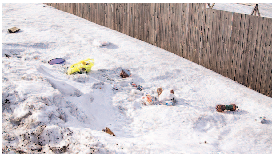
НА ФОТО: ЕСЛИ МУСОР ВЫСТАВЛЯТЬ В МЕШКАХ НА УЛИЦУ, ЕГО РАСТАЩАТ ЖИВОТНЫЕ

В Новосибирской области накаляются страсти вокруг ситуации с вывозом твердых коммунальных отходов: население сталкивается со все новыми «подводными камнями» мусорной реформы.