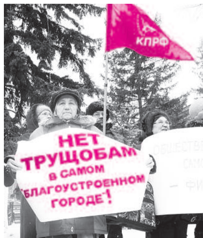
● НА ФОТО: ПРОТИВ БАРАКОВ И ТРУЩОБ