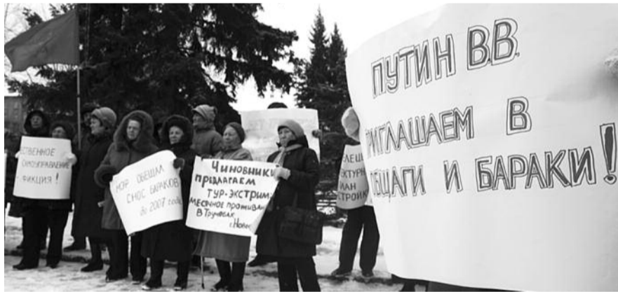
● НА ФОТО: НАРОД ПРИГЛАШАЕТ ЧИНОВНИКОВ НА ЭКСКУРСИЮ К СЕБЕ ДОМОЙ

Жители Ленинского района потребовали от властей незамедлительно провести на основании заявления собственников и нанимателей жилья экспертизу с признанием «жилых» помещений непригодными для проживания, а сами дома аварийными