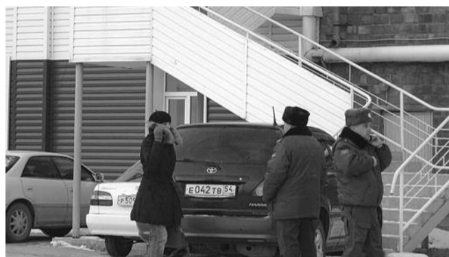
● НА ФОТО: БЕРДСКИМИ ЕДИНОРОССАМИ ЗАЙМЕТСЯ ПОЛИЦИЯ

Материал опубликован из средств избирательного фонда Новосибирского областного отделения партии «Коммунистическая партия Российской Федерации»