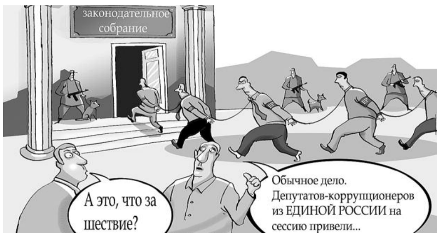
НА РИС.: ПАРТИЯ РЕАЛЬНЫХ ДЕЛ