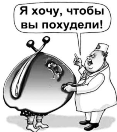
● НА РИС.: ТЕПЕРЬ ЗАКОНЕННОЕ ЖЕЛАНИЕ

Кроме того, среди недостатков законопроекта называли возможность бедных и попавших в трудную ситуацию родителей лишиться своих детей, которых могут у