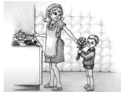
● НА РИС.: «С ПРАЗДНИКОМ, МАМОЧКА!»

Или вот еще довольно распространенная ситуация. К нам на горячую линию позвонила молодая мама, ее семейный доход состав-