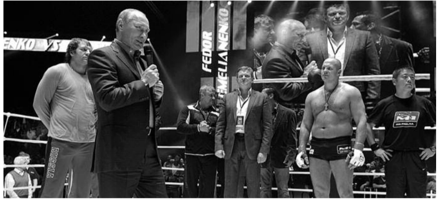
● НА ФОТО: ПУТИНСКИЙ ПИАР НАРОДУ НАДОЕЛ

«Те, кто там был, а также нормальные люди среди тех, кто смотрел, как все там происходило, прекрасно понимают, что люди кричали «ура» и хлопали в ладоши Путину, а «Уууу» кричали уносимому под руки проигравшему бойцу», — написал, к