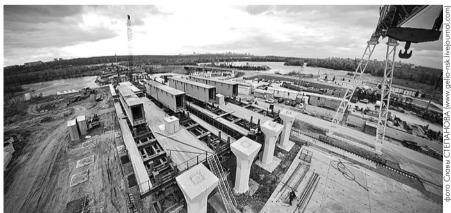
● НА ФОТО: ОЧЕРЕДНОЙ ДОЛГОСТРОЙ?

Кроме того, лидер фракции КППРФ в Законодательном собрании Виктор КУЗНЕЦОВ заметил, что 150 поправок — это очень много и свидетельствует только о том, что изначально законопроект бюджета был написан некачественно.