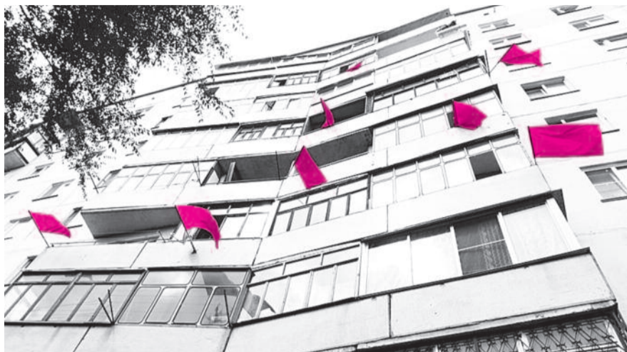
● НА ФОТО: ДЕПУТАТЫ-КОММУНИСТЫ ПОМОГЛИ ПРЕКРАТИТЬ ЗАСТРОЙКУ НА СИРЕНЕВОЙ

году собирало деньги с жителей, но не проводило реконструкции и не обеспечивало безопасности эксплуатации. Газораспределительная сеть поселка передана в ОАО «Сибирьгазсервис» в виде «дарения» на основе бумаги бывшего заместителя председателя правления общества, который действовал с превышением полномо-