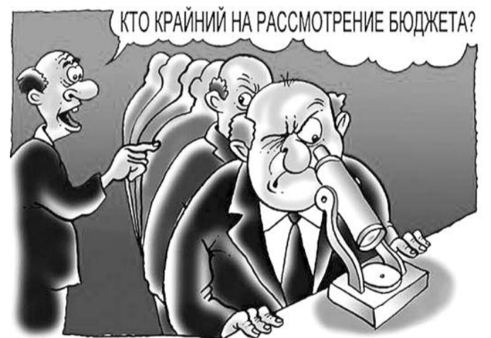
НА РИС.: БЕЗ МИКРОСКОПА ДЕНЕГ В НАШЕМ БЮДЖЕТЕ НЕ НАЙДЕШЬ

Кроме этого, следует обратить внимание, что в среднесрочном планируемом периоде не отражено повышение заработной платы работников бюджетной сферы, и нет уверенности, что после некоторого повышения по некоторым разделам в 2012 году к 2011 году в последующие годы заработная плата не будет заморожена.