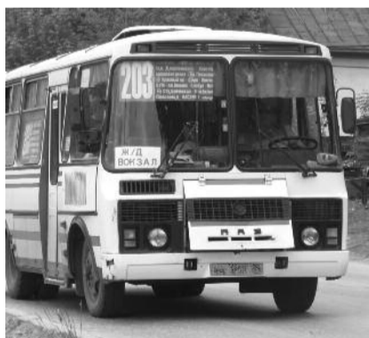
● НА ФОТО: ЗАНИМАТЬСЯ ПЕРЕВОЗКАМИ В НАШЕМ ГОРОДЕ МОГУТ ТОЛЬКО «СВОИ»?

Представители компании «Квантор» обращались в прокуратуру, которая вынесла предписание в отношении министерст-