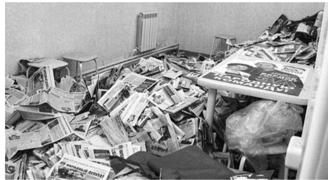
● НА ФОТО: БЫЛО «ЗАЧИЩЕНО» ОКОЛО 40 ТЫСЯЧ ЭКЗЕМПЛЯРОВ

Представители обкома КПРФ «накрыли» нелегальный штаб «Единой России» в Бердске. Как стало известно коммунистам, этот нелегальный штаб «ЕдРа», действовавший на территории спорткомплекса «Вега» (ДЮСШ Бердска, ул. Линейная, 3), занимался «зачисткой» агитационных материалов КПРФ и «СР».