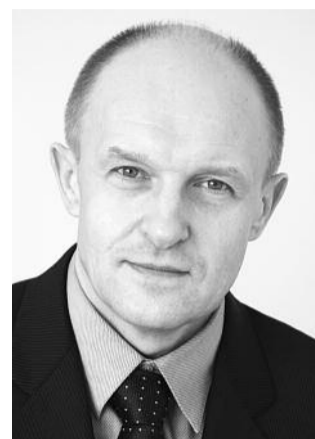
■ НА ФОТО: МЭР-АГИТАТОР

Наша газета уже рассказывала о «находках» «Единой России» для призыва граждан к голосованию. Мы публиковали «Инструкции «ЕР». Об интересном «опыте работы» чиновников в Челябинске рассказывает блогер в беседе с корреспондентом «Московского комсомольца». Здесь инструкции — наиболее подробные и циничные. Чиновники даже сообщают на собраниях директорам коммерческих фирм, сколько давать за нужное голосование избирателям и как их контролировать.