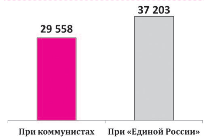
● ДИАГРАММА №2: ЧИСЛО УМЕРШИХ ЧЕЛОВЕК (НОВОСИБИРСКАЯ ОБЛ.)

В «ЗНВ» №40 от 6 октября 2011 года мы рассмотрели темпы убыли населения в Новосибирской области, сократившегося за 20 реформенных лет почти на 100 тыс. человек. Смертность с 1990 года повысилась на 26%, только за январь-август 2011 года в Новосибирской области умерло 24 429 человек, из них 80% (!) умерло от различных заболеваний, в том числе. Это и не удивительно, система здравоохранения переживает не лучшие времена, за время «либеральных реформ» показатель обеспеченности населения больничными койками сократился почти на 20%, и это при том, что население области значительно сократилось.