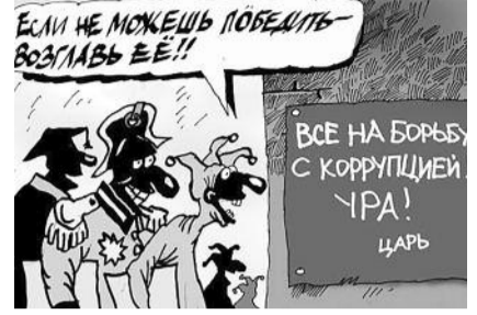
● НА РИС.: ЕДРОСОВСКАЯ ЛОГИКА

берегам Оби была занята пионерским лагерем для отдыха всех детей, а не как в настоящее время — арендуется приближенным к власти для извлечения прибыли. Когда Совет депутатов был хозяином собственного бюджета, при том бездотационного, и использовал его на благо того населения, которое его формировало. Кстати, и в сегодняшнем, практически бесправном положении, когда все решения, связанные с использованием финансовых, материальных средств и собственности, принимаются только исполнительной властью, даже решения сессий подписывает глава муниципального образования,