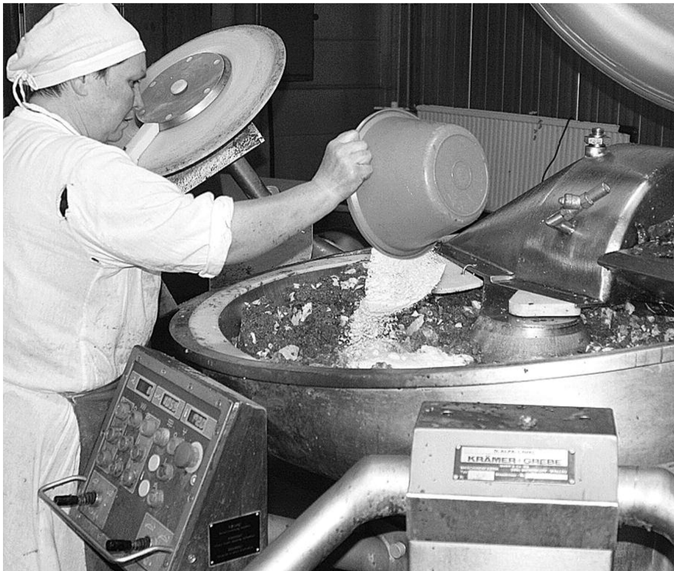
● НА ФОТО: ПРИ ПОДДЕРЖКЕ КПРФ ПРОВОДЯТСЯ НЕЗАВИСИМЫЕ ЭКСПЕРТИЗЫ КАЧЕСТВА ПИЩЕВЫХ ПРОДУКТОВ В НОВОСИБИРСКИХ МАГАЗИНАХ