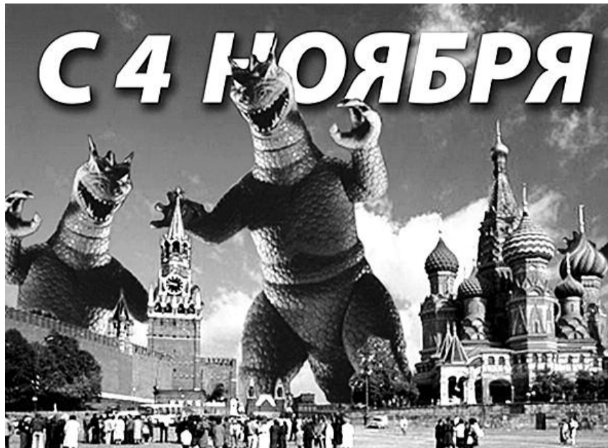
● НА ФОТО: ПРАЗДНИК ПО-ЕДИНОРОССОВСКИ — ВСЕ НЕПРАВИЛЬНО, ЗАТО ЯРКО И ПОЛИТИЧЕСКИ

Однако польские интервенты осенью 1607 года начали новый поход на Россию, который возглавил еще один самозванец