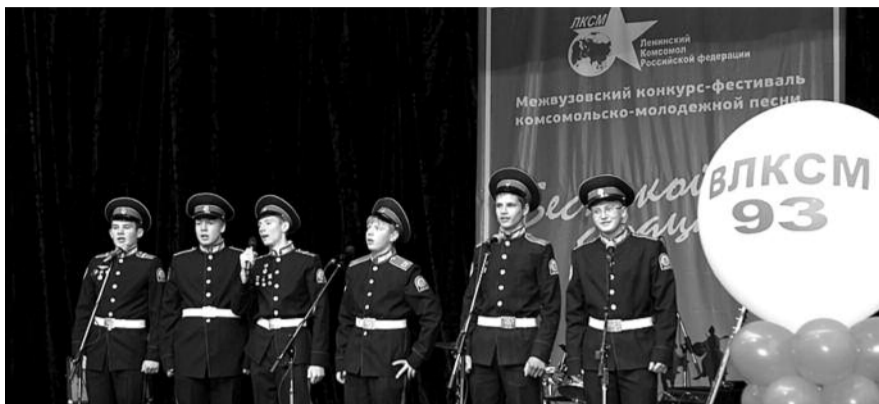
● НА ФОТО: ИЗВЕСТНЫЕ КОМСОМОЛЬСКИЕ ПЕСНИ ИСПОЛНИЛИ 10 МУЗЫКАЛЬНЫХ КОЛЛЕКТИВОВ

— Мы считаем, что план социально-экономического развития не отвечает реальной ситуации в области. План по-прежнему не содержит анализа социально-экономической ситуации в области. В нем нет перспектив. Как мы можем принять бюджет, если наше министерство не видит, что творится у нас в области? Я в бюджете три раза прочитал о наночернилах, а о крупных заводах, предприятиях ни слова. Из этого