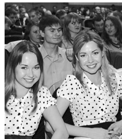
● НА ФОТО: В ЗАЛЕ — МОЛОДЫЕ ЛИЦА