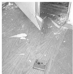
● НА ФОТО: НЕЗВАННЫЕ ГОСТИ ВЫЛОМАЛИ ДВЕРЬ