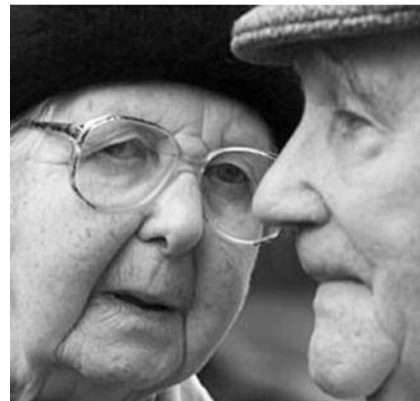
● НА ФОТО: ГДЕ БУДЕМ ДОЖИВАТЬ СВОЙ ВЕК?

«Не исключено, что идея переселения за госсчет в дешевые теплые страны, всплыв-