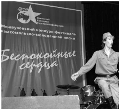
● НА ФОТО: КОНКУРС ЗАРЯДИЛ ПОЗИТИВОМ

Участников мероприятия приветствовали первый секретарь Новосибирского областного отделения КПРФ Анатолий ЛОКОТЬ , первый секретарь Новосибирского отделения ЛКСМ Роман ЯКОВЛЕВ и второй секретарь Новосибирского обкома КПРФ Ренат СУЛЕЙМАНОВ . Открыл