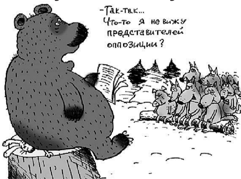
■ НА РИС.: С НАМИ ЭТОТ НОМЕР НЕ ПРОЙДЕТ. ПОПРОБУЙ РАЗДАВИ, КОСОЛАПЫЙ