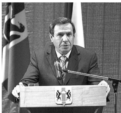
■ НА ФОТО: ГОРОДЕЦКИЙ ПОПРОСИЛ УЧИТЕЛЕЙ ПРОГОЛОСОВАТЬ ЗА «ЕДИНУЮ РОССИЮ»

«Для Вас возможное негативное последствие — административный штраф в размере до 1 500 руб. в случае проведения Вами предвыборной агитации в рабочее время, при исполнении Вами должностных, служебных обязанностей, и этот факт будет зафиксирован на видеокамеру. Но в судебной практике подобная норма применяется редко. В случае, если в суд поступит