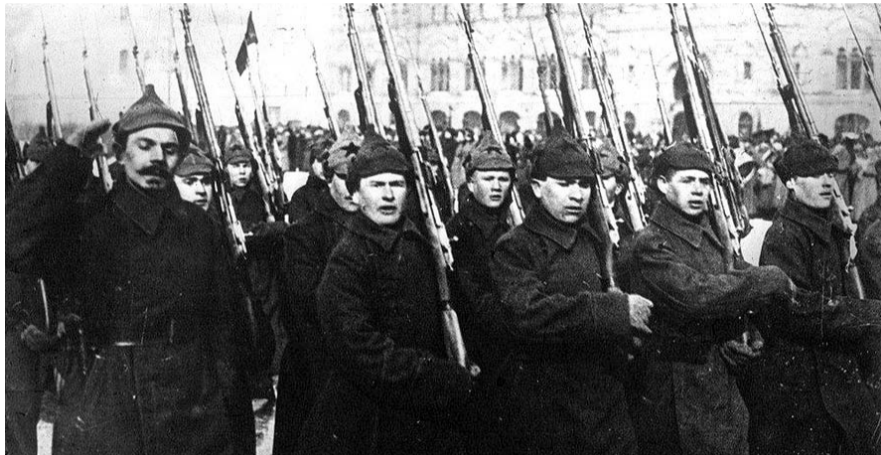
НА ФОТО: СОЛДАТЫ РЕГУЛЯРНОГО ПОЛКА РККА

• Доступ в ее ряды открыт для всех граждан Российской Республики не моложе 18 лет. В Красную Армию поступает каждый, кто готов отдать свои силы, свою жизнь для защиты завоеваний Октябрьской революции, власти Советов и социализма. Для вступления в ряды Красной Армии необходимы были рекомендации войсковых