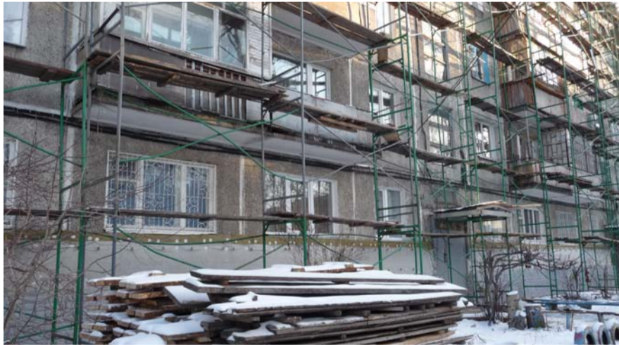
НА ФОТО: КАПИТАЛЬНЫЙ РЕМОНТ МНОГОКВАРТИРНЫХ ДОМОВ НАБИРАЕТ ОБОРОТЫ

По словам мэра, большой объем задач в 2016 году для Департамента