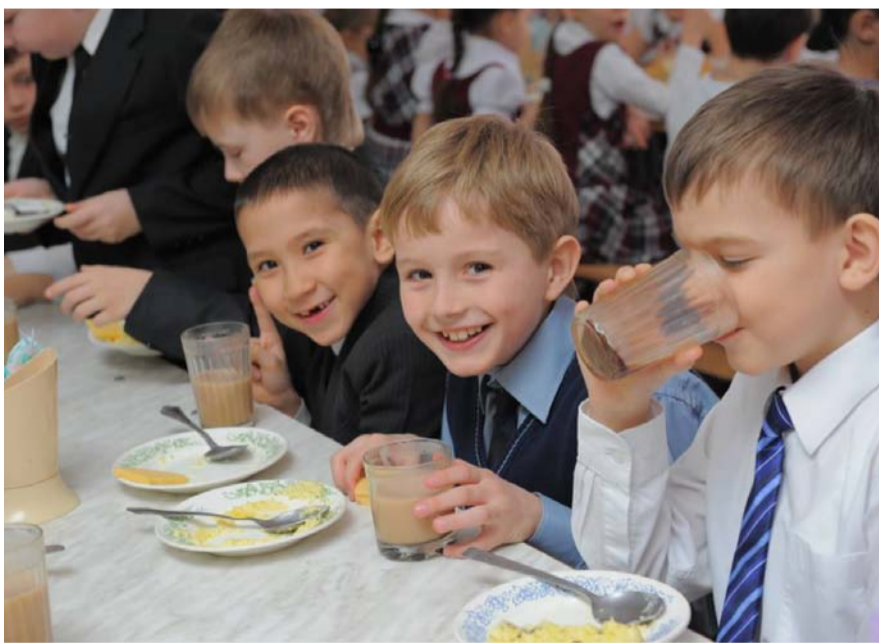
НА ФОТО: НА ЗДОРОВЬЕ ДЕТЕЙ НЕЛЬЗЯ ЭКОНОМИТЬ

По словам экспертов, размер финансирования не менялся с 2012 года,