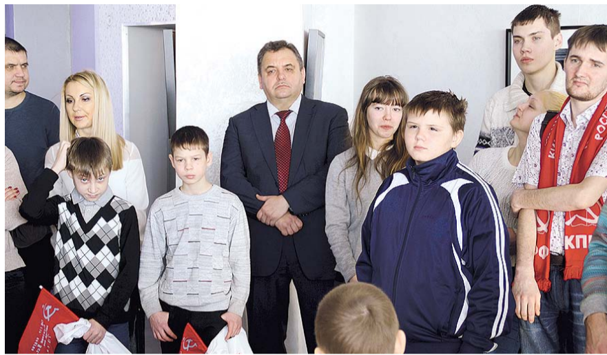
НА ФОТО: ЭКСКУРСИЯ В ПЛАНЕТАРИИ

— У нас установилась хорошая традиция: по инициативе ЛКСМ, в част-