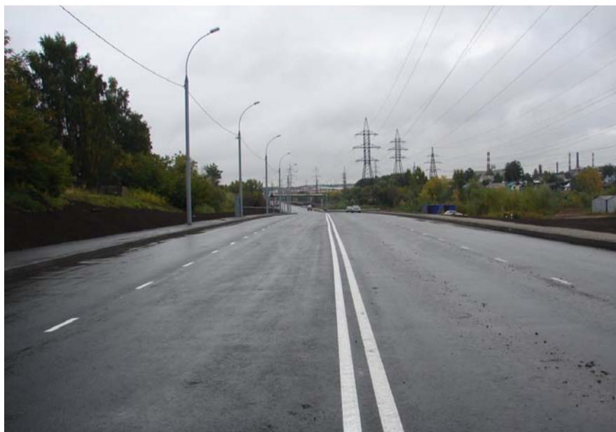
НА ФОТО: В 2016 ГОДУ УЛ. Г. КОЛОНДЫ СОЕДИНИТ ЖИЛМАССИВ «СЕВЕРНЫЙ» С ЦЕНТРОМ