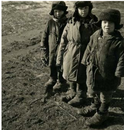
НА ФОТО: ТЕРПЕТЬ ИМ НЕ ПРИВЫКАТЬ

Если во время войны фашистские мародеры лишили нашу семью коровы, овец, то при современной «демократи-