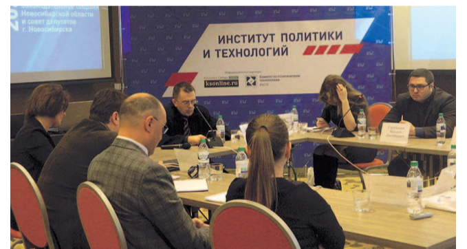
НА ФОТО: УЧАСТНИКИ КОНФЕРЕНЦИИ

По мнению политика, на выборы 2020 года окажет свое воздействие федеральная повестка, в частности, негативное отношение населения к пенсионной и «мусорной» реформам. В то же время он выразил надежду на сохранение делового взаимодействия