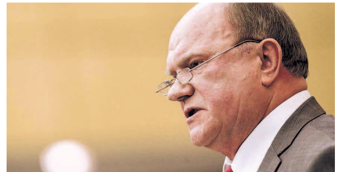
НА ФОТО: ГЕННАДИЙ ЗЮГАНОВ

Отвратительные события произошли 7 ноября в Санкт-Петербурге. Колыбель трех революций, город-герой, переживший трагическую блокаду, столкнулся с худшими проявлениями полицейщины. Пришедшие к крейсе-