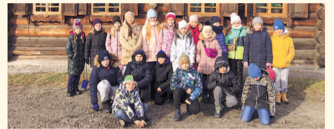
НА ФОТО: РЕБЯТИШКИ ПРИКОСНУЛИСЬ К ИСТОРИИ