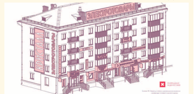
НА ФОТО: БОЛЬШЕ НАШИ ДОМА НЕ БУДУТ ТАК ВЫГЛЯДЕТЬ