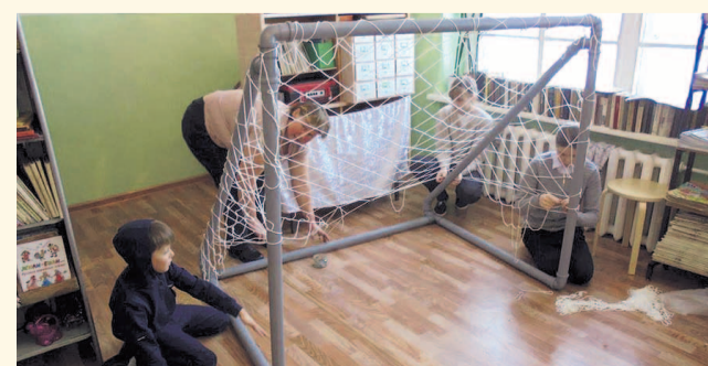
НА ФОТО: РАЗУМНАЯ ЭКОНОМИЯ ИЛИ ПОЗОРНЫЙ КОМПРОМИСС?