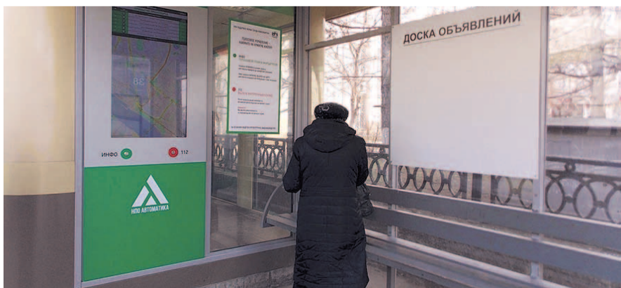
НА ФОТО: «УМНАЯ» ОСТАНОВКА ПРИДЕТ НА ПОМОЩЬ