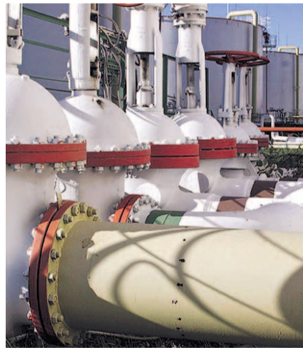
НА ФОТО: ГАЗ ЕСТЬ, А ДЕНЕГ НА ПОДКЛЮЧЕНИЕ — НЕТ

В этих условиях люди вынуждены отказываться от, казалось бы, выгодно-