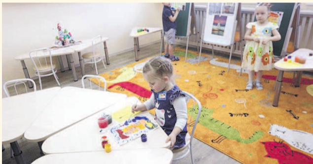
НА ФОТО: СОВРЕМЕННЫЙ ДЕТСКИЙ САД — УЮТНЫЙ И БЕЗОПАСНЫЙ