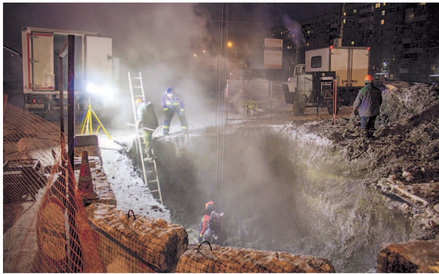
НА ФОТО: АВАРИИ БЫЛИ ОПЕРАТИВНО ЛИКВИДИРОВАНЫ