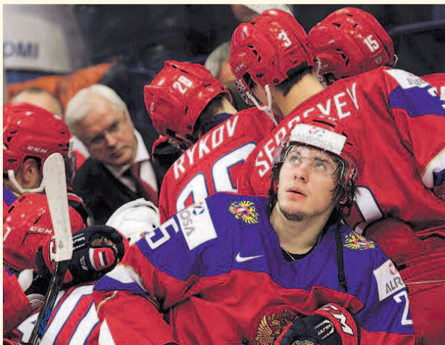
НА ФОТО: СЫГРАЮТ ЛИ РЕБЯТА В НОВОСИБИРСКЕ?