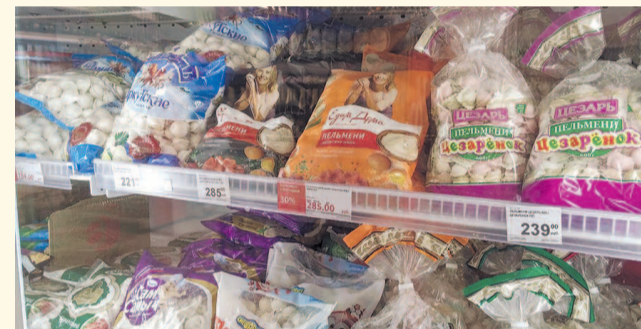
НА ФОТО: ЦЕНА УКАЗАНА ЗА 800-900 ГРАММ