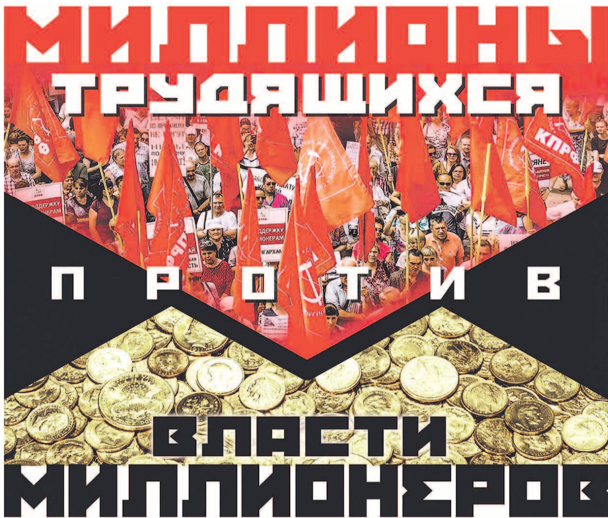
Иллюстрация Игоря Петрыгина-Родионова