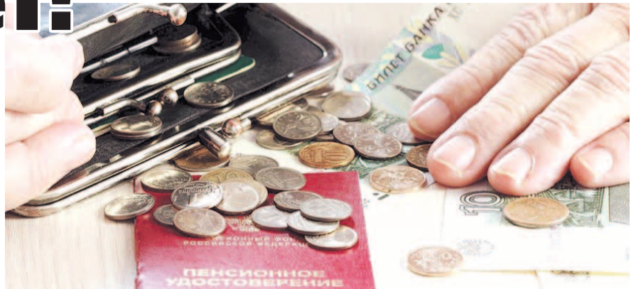
НА ФОТО: СТАРИКИ ВЫНУЖДЕНЫ СЧИТАТЬ КОПЕЙКИ

Напомним, в прошлом году премьер-министр России Дмитрий МЕДВЕДЕВ заявил, что, благодаря программе