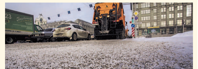
НА ФОТО: ОБРАБОТКА ДОРОГ «БИОНОРДОМ»