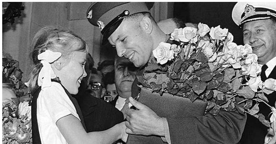
● НА ФОТО: В ИЮЛЕ 1961 ГОДА ЮРИЙ ГАГАРИН ПРИЕХАЛ В ВЕЛИКОБРИТАНИЮ

В следующем году состоится не только выборы Президента РФ, но и будет юбилей Отечественной войны 1812 года. Сумеет ли нынешний Главнокомандующий Вооруженными Силами России усвоить главный урок этой войны: чтобы спасти свою страну и собственный зад, надо вовремя свалить из Москвы?