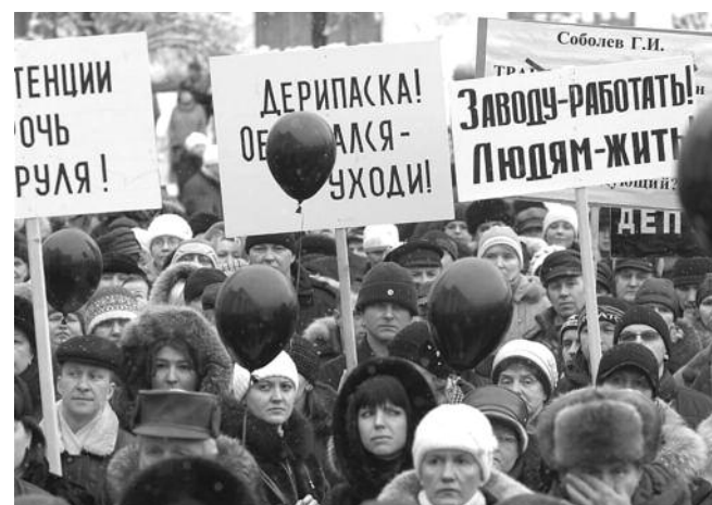
● НА ФОТО: НАРОД УСТАЛ ОТ БЕСКОНЕЧНЫХ ПРИВАТИЗАЦИЙ

Первоначальный и сильный импульс для очередной волны приватизации дал президент Д.А. МЕДВЕДЕВ . В своем декабрьском (2010 г.) послании Федеральному Собранию РФ глава государства объявил о подписании указа об уменьшении в 5 раз числа предприятий, не подлежащих приватизации. На этот же путь подталкиваются и региональные власти, которым советуют активно расставаться с так называемой непрофильной собственностью, к которой помощник президента А. ДВОРКОВИЧ относит, например, финансовые институты, транспорт, средства массовой информации. На федеральном уровне на частичную и полную продажу намечены: Сбербанк, Внешторгбанк, Транснефть, Роснефть, Аэрофлот, Зерновая компания и другие. Всего сторонники оголтелого либерализма собираются приватизировать более 900 предприятий, включая стратегические. Многие из них достанутся иностранцам. Как пишет газета «Правда», фактически Ротшильды возвращаются в Россию. Поэтому коммунисты идут на выборы под лозунгом: «Вернуть народу украденные государство и Родину!».