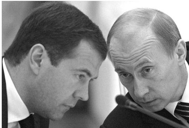
● НА ФОТО: СТОЛКНУТСЯ ЛИ ЛБАМИ ПУТИН И МЕДВЕДЕВ?

В России возможен политический кризис, схожий с концом 80-х годов, если рейтинги доверия к власти продолжат снижаться еще 10-15 месяцев, говорят эксперты Центра стратегических разработок (ЦСР), отмечая схожесть результатов соцопросов с ситуацией 1987 года.