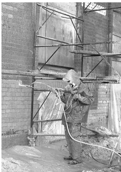
● НА ФОТО: В 2011 ГОДУ В НОВОСИБИРСКЕ БУДЕТ ОТРЕМОНТИРОВАНО ТОЛЬКО 10 ДОМОВ