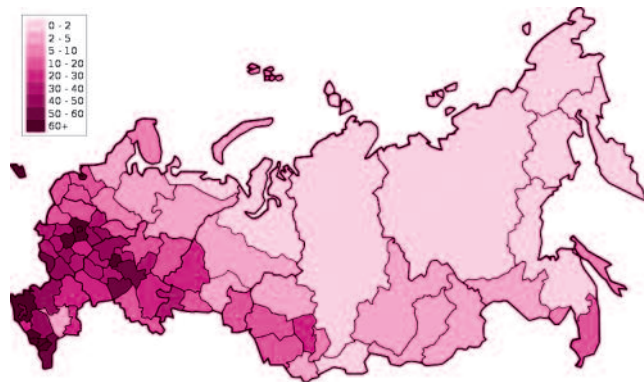
● НА ФОТО: ПЛОТНОСТЬ НАСЕЛЕНИЯ СТРАНЫ ЗА УРАЛОМ ТАЕТ

Первые итоги переписи населения, проводившейся в стране в 2010 году, озвучены Росстатом. Итоги неутешительные. Согласно официальной статистике, нас на 2,2 млн. меньше, чем в 2002 году. Население Сибири с момента прошлой переписи сократилось на 4%.