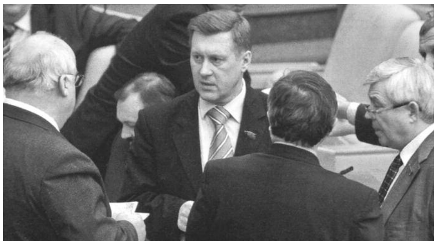
● НА ФОТО: АНАТОЛИЙ ЛОКОТЬ В ГОСУДАРСТВЕННОЙ ДУМЕ