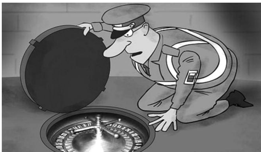
● НА РИС.: ЗА ПОКРОВИТЕЛЬСТВО ПРОКУРОРЫ ЯКОБЫ ПОЛУЧАЛИ $30-35 ТЫСЯЧ