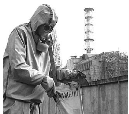
● НА ФОТО: «ПОЙМАЮТ» ЛИ РАДИАЦИЮ?