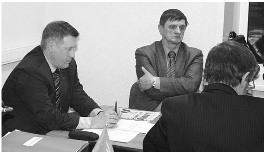
● НА ФОТО: ИДЕТ ЗАСЕДАНИЕ БЮРО ОБКОМА