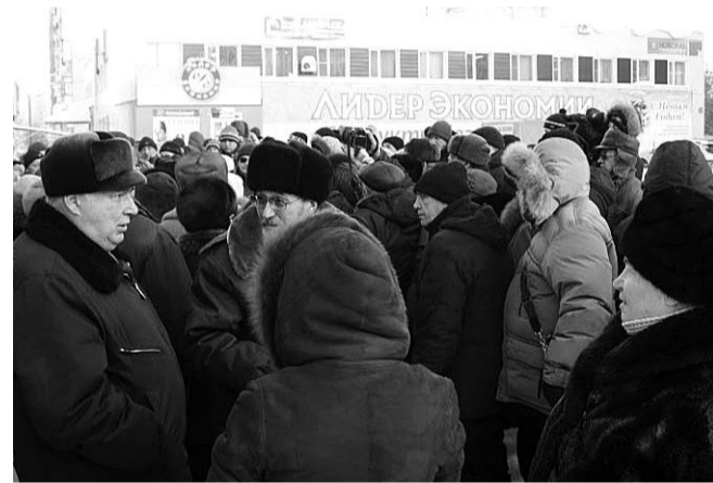
НА ФОТО: «ГАРАЖНАЯ» АКЦИЯ ПРОТЕСТА СОБРАЛА СОТНИ ЧЕЛОВЕК