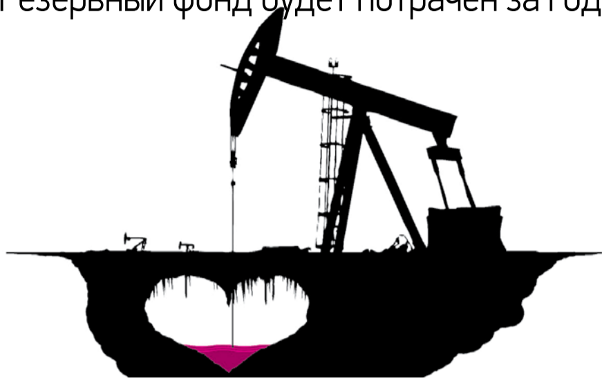
НА РИС.: НА ЦЕНЕ НА НЕФТЬ «ЗАВЯЗАНЫ» ПРЕЖДЕ ВСЕГО БЮДЖЕТЫ РЕГИОНОВ

При падении цен на нефть, Резервный фонд будет потрачен за год