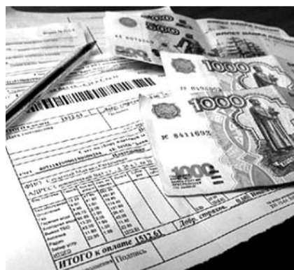
НА ФОТО: КПРФ ПРЕДЛАГАЕТ ВМЕСТЕ РАЗОБРАТЬСЯ В КВИТАНЦИЯХ ЖКХ