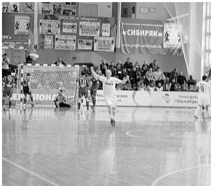
НА ФОТО: ГОЛ!

В спорткомплексе НГАСУ в минувшую субботу состоялся матч 8 тура Чемпионата России по мини-футболу среди команд Суперлиги между МФК КПРФ (Россия) и новосибирским «Сибиряком». Напряженный матч завершился эффектной концовкой, на последней минуте коммунисты отыграли дефицит в два мяча и свели поединок вничью — 4:4.