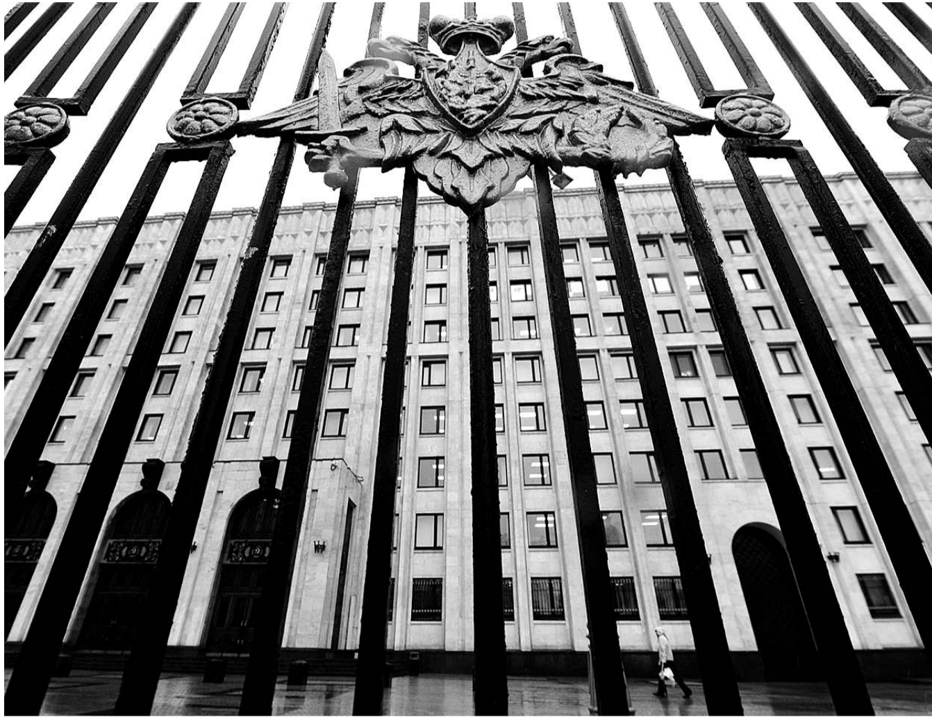
НА ФОТО.: БЕЗ ЖЕРТВ УЖЕ НЕ ОБОШЛОСЬ. В ГРОМКОМ ДЕЛЕ ОБОРОНЩИКОВ СЛЕДСТВИЕ ИДЕТ ПО СЛЕДАМ ПРЕСТУПНИКОВ