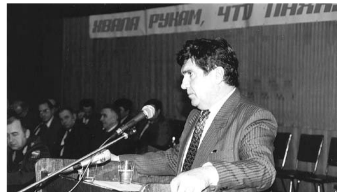
НА ФОТО: ВЫСТУПЛЕНИЕ НА СОВЕЩАНИИ ПЕРЕДОВИКОВ СЕЛЬСКОГО ХОЗЯЙСТВА НОВОСИБИРСКОЙ ОБЛАСТИ (ОКТАБРЬ 1995 ГОДА)

— Я приехал в Чистоозерку в 1985 году, меня на три с половиной года избрали секретарем райкома. Когда партию разогнали, я остался вначале не у дел, последним «покинул корабль». Прихожу к председателю райисполкома, которого я в свое время выдвинул на эту должность, он мне прямо говорит: «Мы с вами не сработаемся». Но я ведь не просился к нему в заместители, мне нужна была работа как специалисту — я агроном. Даже в этом было отказано, и пришлось стать на биржу труда. Другие должностные лица повели себя не лучше. Только начальник милиции, ныне покойный, оказался порядочным человеком. Остальные поспешили спрятать партийные билеты и начали поливать грязью коммунистов. Вся власть, состоявшая из вчерашних коммунистов, коммунистов настоящих встречала в штыки.