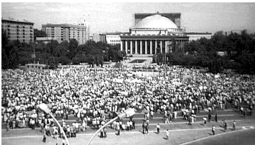
НА ФОТО: МАССОВЫЙ МИТИНГ КПРФ НА ПЛОЩАДИ ЛЕНИНА (1994 ГОД)