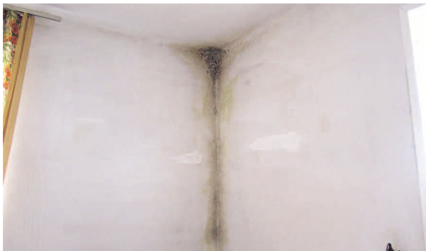
НА ФОТО: ЭТОМУ ДОМУ НЕ НУЖЕН РЕМОНТ!

В муниципальном доме села Убинского на улице Луговой, 5 18 полностью заселенных квартир. Проживают здесь одинокие пожилые люди, по разным причинам оказавшиеся в свое время на улице, без собственного жилья. Всех жильцов сопровождают органы социальной защиты.