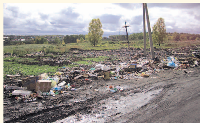
НА ФОТО: СТИХИЙНАЯ СВАЛКА В ИСКИТИМСКОМ РАЙОНЕ

Кроме того, ранее сообщалось, что бердский предприниматель Виктор ГОЛУБЕВ приобрел земельный участок, есть постановление губернатора от 2017 года об изменении разрешенного использования данного участка. В этом постановлении указано, что участок надо перевести в промзону специального назначения. Но люди были против свалки в 22 гектара! В Министерстве активистам ответили, что полигон будет находиться в 1 км от поселка, поэтому оснований для запрета строительства нет. Самое удивительное, что внесенные в проект предложения для выделения территории для строительства детского сада и детской спортивной площадки были отклонены, а на свалку 22 гектара у чиновников нашлись!