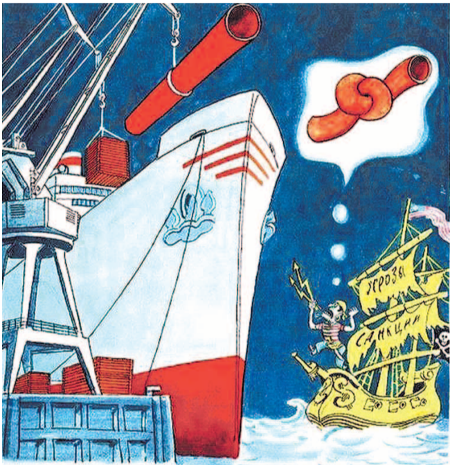
ИЗБИТОЧНАЯ МЕЧТА ЗАОКЕАНСКОГО ПИРАТА.