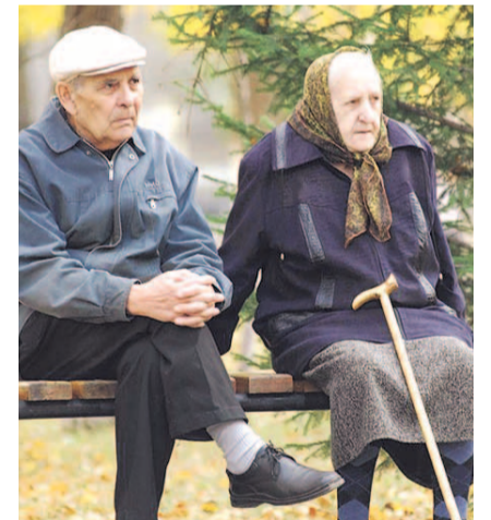
НА ФОТО: ЖИТЬ СТАЛО ЛУЧШЕ...

Поразительно, но власти, с упорством, достойным удивления, пытаются