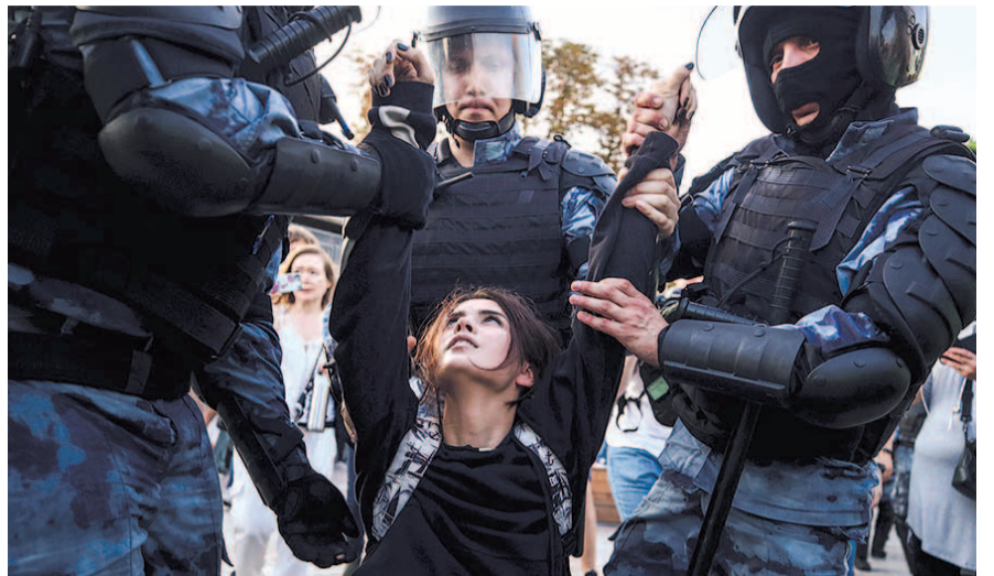
НА ФОТО: НАША ПОЛИЦИЯ НАС БЕРЕЖЕТ

В этой связи надо отметить, что на выборах в региональные парламенты и муниципальные органы власти укрепилась КПРФ, которая достойно выступила во многих регионах. При этом результаты «Единой России» повсеместно упали, что является прямым следствием пенсионной реформы