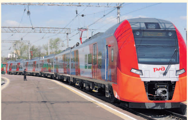
НА ФОТО: НОВАЯ ЭЛЕКТРИЧКА: КОМФОРТНО И БЫСТРО!