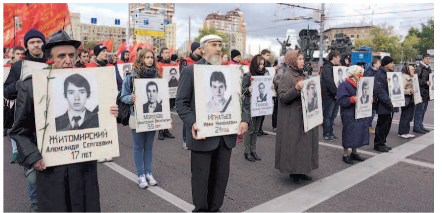
НА ФОТО: ТЕМ, КТО НЕ ПЕРЕЖИЛ ОКТЯБРЬ 93-ГО, УЖЕ НИКОГДА НЕ ПОЗНАТЬ ПРЕЛЕСТЕЙ «СВОБОДЫ И ДЕМОКРАТИИ»...

Сегодня не скрывается и роль США, которые инспирировали это противостояние, играя на низменных чувствах правителей государства, жаждавших единоличной власти ( ЕЛЬЦИН ), людей искусства, жаждавших свободы (чего стоит истерика Лии АХЕДЖАКОВОЙ : «Раздавить эту гадину!» — это по поводу окончательного уничтожения защитников Дома Советов) и простых людей, так хотевших сто сортов колбасы (как на западе!). Каждый получил свое. Так называемые простые люди лишились работы, ведь предприятия, кормившие их, закрывались тысячами и за бесценок переходили в частные руки, что и нужно было западным советникам — «друзьям России». Сама помню, как месяцами нам на руки вместо денег давали расчетки, пока не пришел благословенный бартер. Но наш завод выпускал ткацкие станки, которые расходились по всему миру из-за легкости в эксплуатации и дешевизны, по сравнению со швейцарскими станками фирмы Зульцер — Рюти, и эта наша продукция давала возможность разнообразить бартер. Труднее было малым предприятиям в сельской местности. Помню сюжет по местному ТВ, где мужики в качестве бартера несли каждый на согнутой руке... по утилизатору. И смех, и слезы. Вот только не знаю, как с нашей творческой элитой. По-моему, многие спились из-за невостребованности, кто-то под воздействием