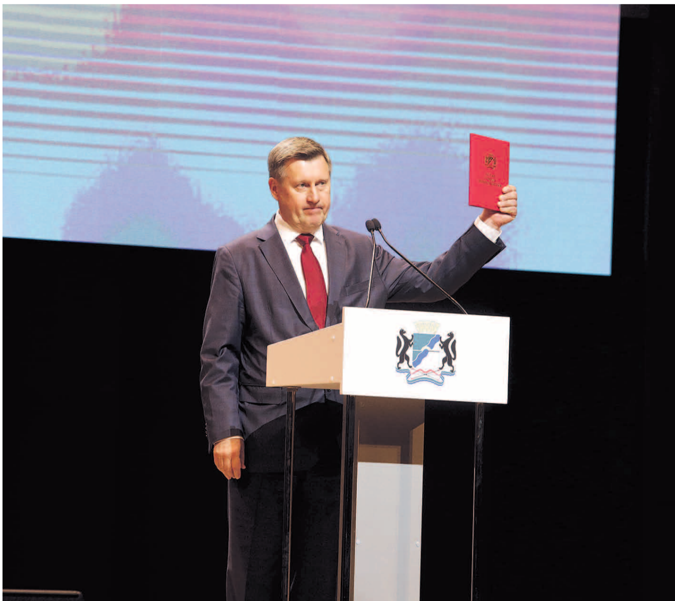
НА ФОТО: АНАТОЛИЙ ЛОКТЬЯ ВСТУПИЛ В ДОЛЖНОСТЬ МЭРА НОВОСИБИРСКА