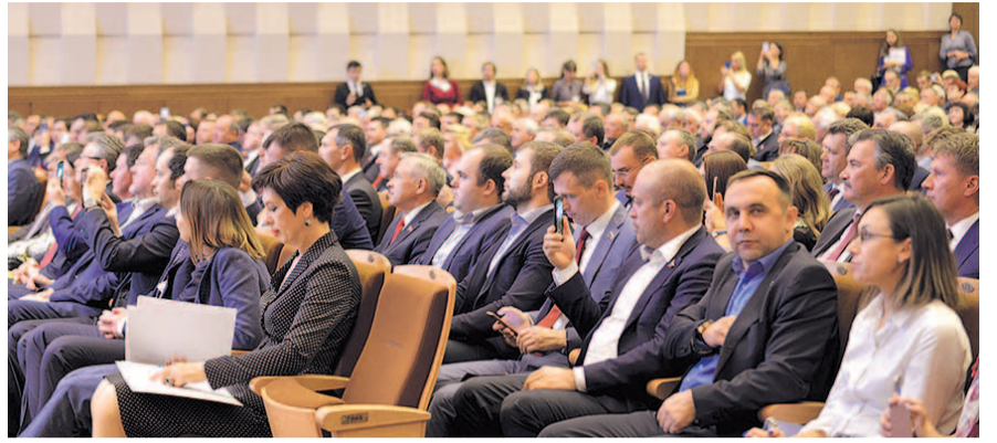
НА ФОТО: В ЗАЛЕ ГЭК ИМ. КАЦА ВО ВРЕМЯ ИНАУГУРАЦИИ