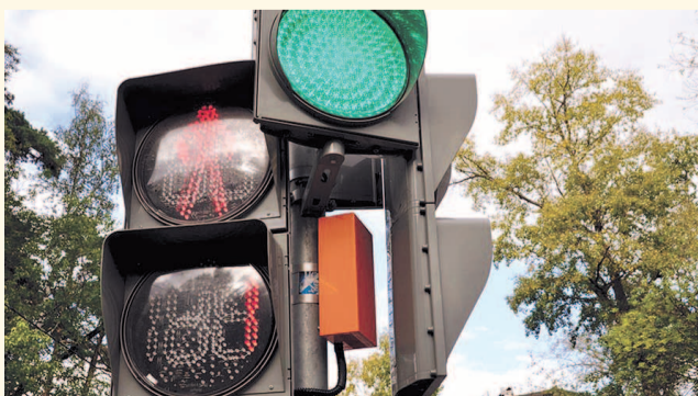
НА ФОТО: НОВЫЕ СВЕТОФОРЫ СКОРО ПОЯВЯТСЯ В ГОРОДЕ