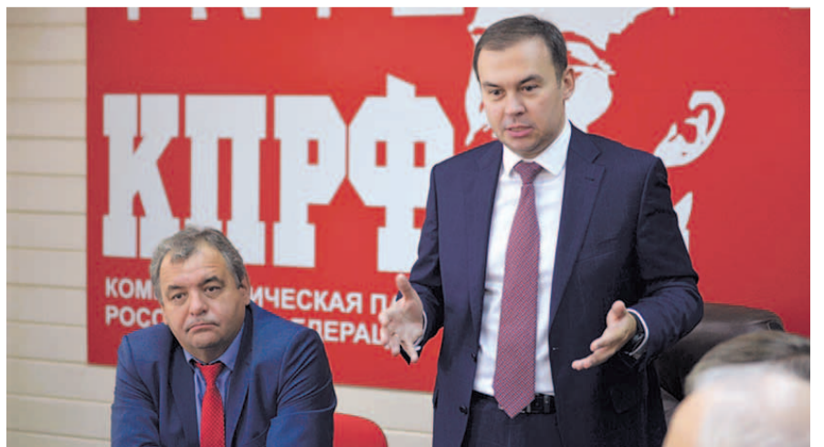
НА ФОТО: ЮРИЙ АФОНИН НА ВСТРЕЧЕ С ПАРТИЙНЫМ АКТИВОМ