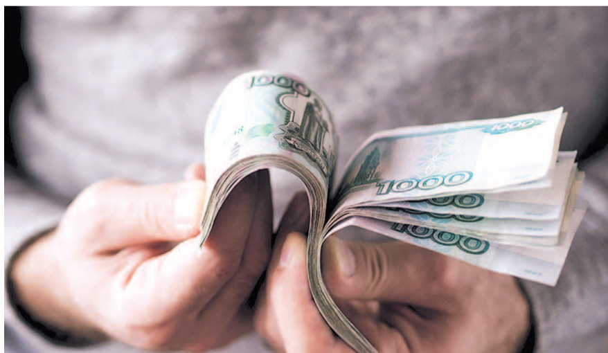
НА ФОТО: ДЕНЕГ СТАЛО БОЛЬШЕ, А КУПИТЬ НА НИХ МОЖНО МЕНЬШЕ

Самый большой рост показала зарплата в Костромской области — она изменилась на 14,7%, при этом среднемесячный показатель составил 26 тысяч 900 рублей. В Ямало-Ненецком автономном округе зафиксирован самый маленький рост — 2,3%, — а средняя зарплата здесь составляет 90 тысяч 369 рублей.