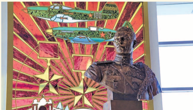
НА ФОТО: БЮСТ ПОКРЫШКИНА В НОВОСИБИРСКОМ АЭРОПОРТЕ