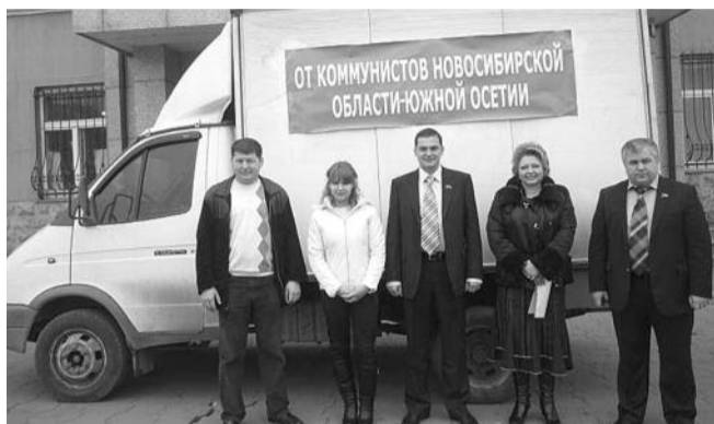
■ НА ФОТО: ГУМАНИТАРНАЯ ПОМОЩЬ БРАТСКОМУ НАРОДУ

В эти дни отмечается одна из самых трагических дат в истории России. Три года назад НАТОвские орды вторглись на древнюю землю Южной Осетии и развязали чудовищный геноцид против свободолюбивого народа. Изверский план фашиствующей клики, захватившей власть в Грузии, состоял в том, чтобы превратить территорию цветущей независимой Республики в «Чистое поле» (так называлась военная операция, разработанная американскими инструкторами).