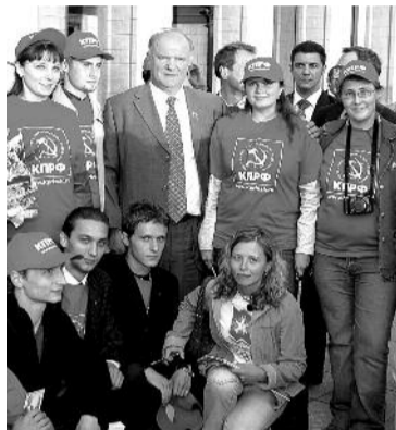
● НА ФОТО: ГЕННАДИЙ ЗЮГАНОВ В НОВОСИБИРСКЕ