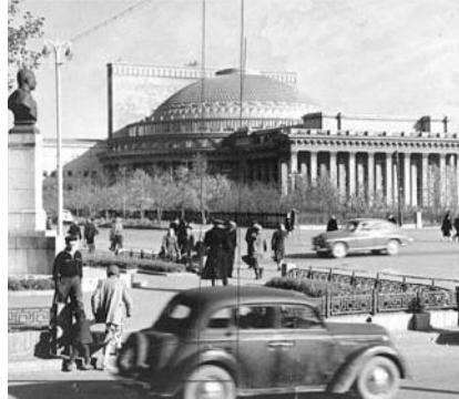
● НА ФОТО: «НЕ ОБОШЛОСЬ БЕЗ МОЕГО УЧАСТИЯ ПРИ МОНТАЖЕ ОПЕРНОГО ТЕАТРА»