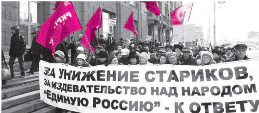
● НА ФОТО: ОЧЕРЕДНОЕ ШЕСТИЕ БЕЗЛИМИТНОГО ПРОЕЗДА СОСТОИТСЯ В ЭТУ ПЯТНИЦУ 12 АВГУСТА