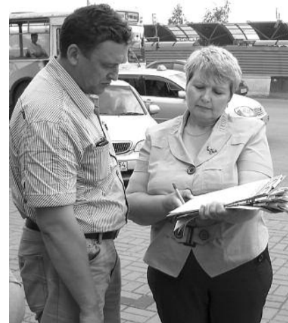
■ НА ФОТО: ИДЕТ ГОЛОСОВАНИЕ