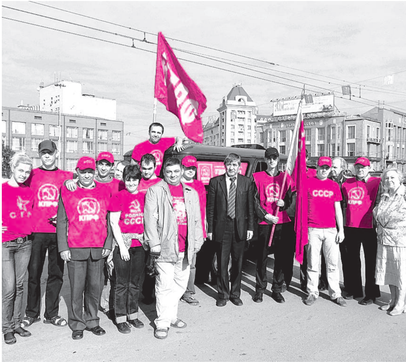
● НА ФОТО: УЧАСТНИКИ АВТОПРОБЕГА ПЕРЕД СТАРТОМ