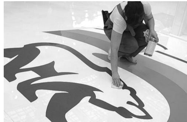
● НА ФОТО: СКОЛЬКО МЕДВЕДЯ НИ НАТИРАЙ, ДОБРЕЕ ОН НЕ СТАНЕТ

Подорожают также и акцизы на алкогольную продукцию. В соответствии с предложениями Минфина по росту акцизов на алкоголь, за три года стоимость самой дешевой водки вырастет в два раза. И уже с 2014 года, как сообщают СМИ,