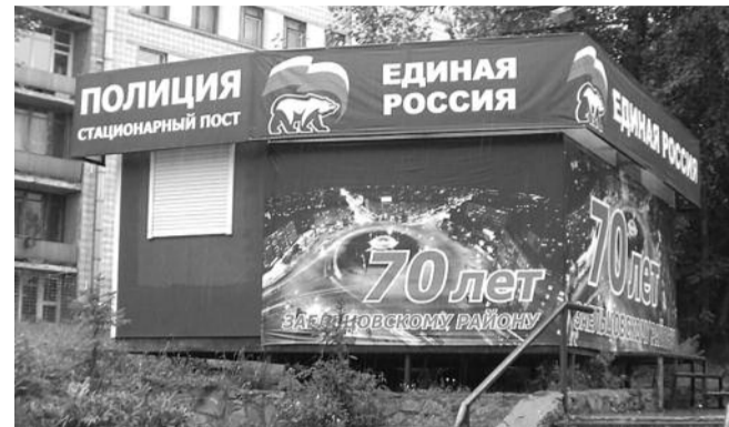
● НА ФОТО: СОЮЗ МЕЧА И ОРАЛА?

Очень своеобразные взаимоотношения партии власти и сотрудников полиции стали поводом для многих анекдотов. В прошлом широкую огласку получила история с высокопоставленным милицейским начальником, который приходил разгонять мероприятия оппозиции со значком «Единой России» на кителе.