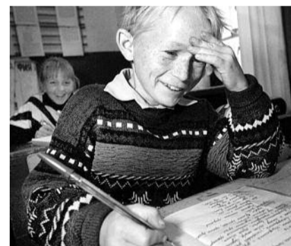
■ НА ФОТО: СЕЛЬСКАЯ ШКОЛА ЕЛЕ ВЫЖИВАЕТ

том числе сельских, появились компьютеры? Но ведь одними компьютерами сыт не будешь! Нужны мебель, ремонт, продуманные программы. Вот образовательные стандарты. Даже не знаю, как назвать то, что с ними сделали. У нас теперь великое множество учебников, причем по одной-единственной дисциплине. Стоит ребенку перейти в другую школу — он сталкивает-