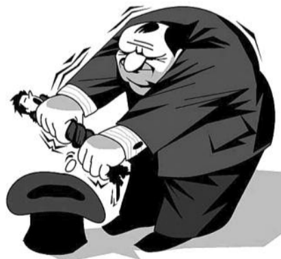
● НА РИС.: ДО ПОСЛЕДНЕЙ КОПЕЙКИ...

По данным Федеральной налоговой службы России, экспортерам природных ресурсов за 2010 год начислили к возмещению по НДС 1 триллион 121,7 млрд. рублей. Или 44,4% от всего собранного на территории РФ налога. Такое обращение с налоговой системой, когда деньги за реализацию национальных богатств оседают в карманах считанных компаний, лишь формально отмечаясь в госбюджете, противоречит сразу трем статьям Конституции РФ. В которых говорится, что реализация природных ресурсов должна идти с учетом удовлетворения потребностей всех российских граждан, а не пополнять карманы нескольких экспортеров.