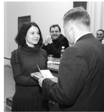
● НА ФОТО: МОЛОДЕЖЬ ВСТУПАЕТ В КПРФ — АНАТОЛИЙ ЛОКОТЬ ВРУЧАЕТ ПАРТБИЛЕТ

За 5 лет количество муниципальных автобусов сократилось в 2 раза (2006 год — 560 единиц, 2010 год — 280 единиц), электротранспорта стало меньше на 15%. При этом износ парка составляет до 70%. Интервалы движения на многих маршрутах — 20 и более минут, после 21 часа вечера на ряде маршрутов перевозчики попросту не работают. Очень слабо организована работа по выдаче единых социальных проездных билетов, многие отдаленные микрорайоны города оказались без транспортного сообщения с городскими территориями (поселок Плановый и м/р «Нижняя Ельцовка»).