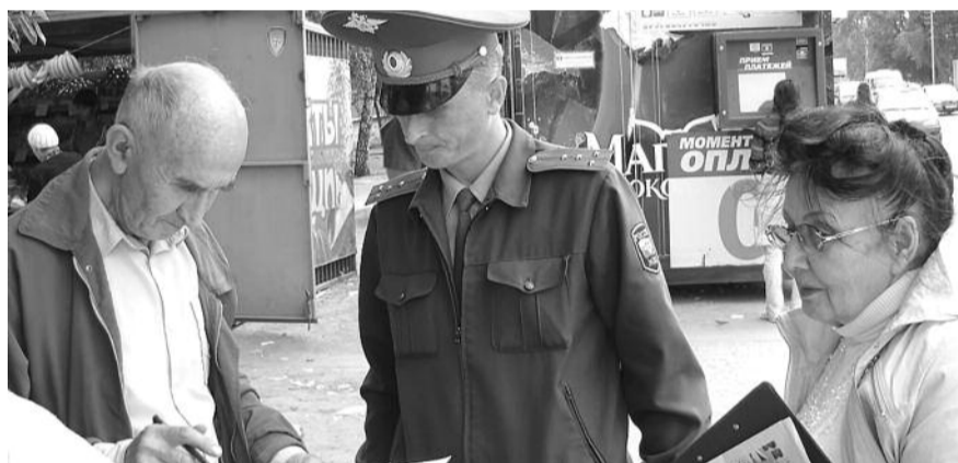
■ НА ФОТО: НАД ВОПРОСАМИ НАРОДНОГО РЕФЕРЕНДУМА ЗАДУМЫВАЮТСЯ И СТРАЖИ ПОРЯДКА