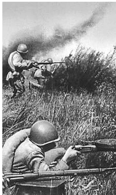
● НА ФОТО: КОМСОМОЛЬЦЫ ВСТАЛИ НА ЗАЩИТУ РОДИНЫ!

В воспитании патриотизма школой, пионерской и комсомольской организациями особое значение имели учебные предметы: экономгеография и литература. Первая знакомила нас с крупнейшими стройками, вторая — с галереями людей, с которых хотели брать пример. Нашими героями были РАДИЩЕВ , декабристы, ЧЕРНЫШЕВСКИЙ , Павка КОРЧАГИН ... Они самоотверженно служили своему народу. Кинокартин снимали не много, но зато какие! Все находилось под впечатлением от «Красных дьяволят», «Чапаева», киноповести о большевике Максиме, «Трактористов», «Истребителей». А какие песни пели в наше время! Какая музыка, какой смысл! Все ложилось на сознание и сердце. Впечатляющим примером для нас были трудовые и боевые подвиги старших товарищей. СМИ, кинохроника поднимали на щит коллективы строителей ДнепрГЭСа, Турксиба, Волго-Донского и Каракумского каналов, Урало-Сибирского угольно-металлургического комбината, Комсомольска-на-Амуре и т.п. Нас увлекал пример металлургов, корабелов, первых Героев Советского Союза — летчиков, знатных хлеборобов. Везде требовались знания и руки. Мы знали, что перед нами открыты все двери и дороги. Это рождало глубокое чувство патриотизма.