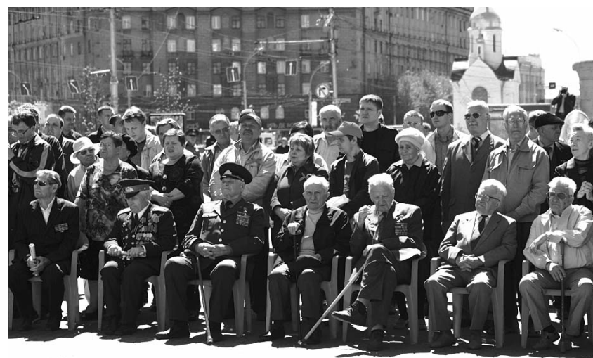
● НА ФОТО: ВЕТЕРАНЫ НА «ДНЕ ПРАВДЫ-2010» — В ПЕРВЫХ РЯДАХ