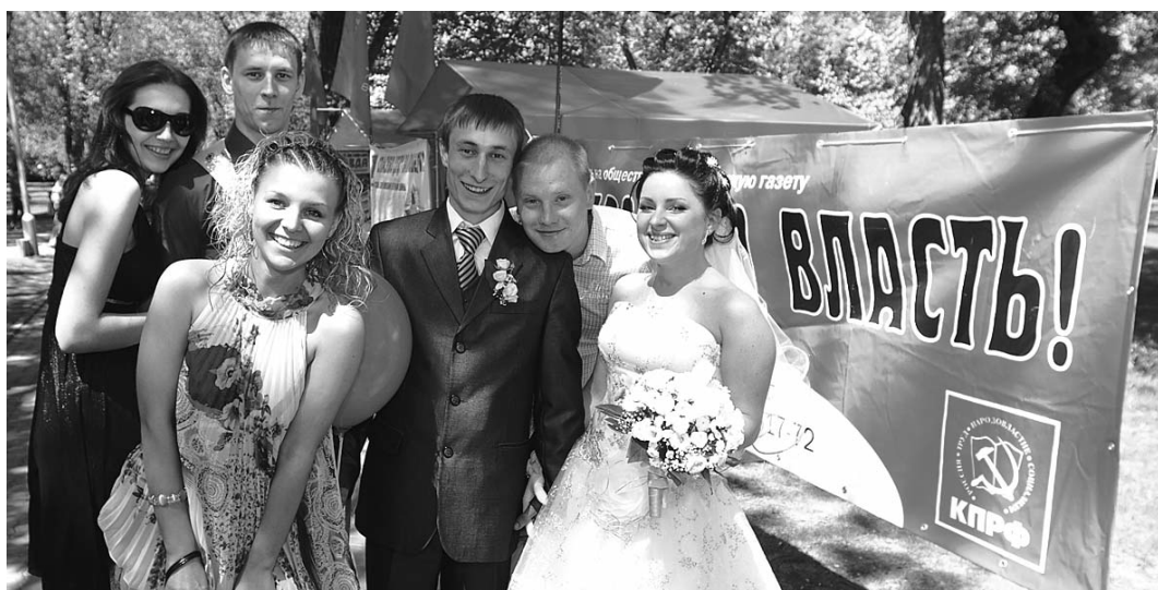
● НА ФОТО: «ДЕНЬ ПРАВДЫ-2010» ПОСЕТИЛО БОЛЕЕ 10 СВАДЕБНЫХ ЦЕРЕМОНИЙ