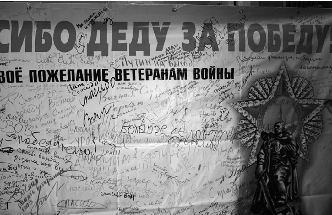
● НА ФОТО: НА БАНЕРЕ НЕ ОСТАЛОСЬ СВОБОДНОГО МЕСТА