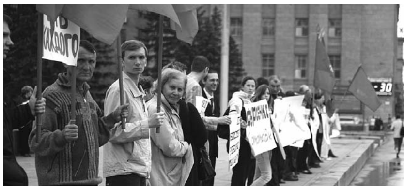
● НА ФОТО: СОХРАНИМ ДОСТУПНОЕ ОБРАЗОВАНИЕ И БЕСПЛАТНУЮ МЕДИЦИНУ