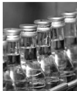
● НА ФОТО: НА ЭТОМ МОЖНО НЕПЛОХО ЗАРАБОТАТЬ

Министерство финансов России планирует в полтора раза увеличить акциз на алкогольную продукцию, начиная со следующего года. Это означает, что минимальная цена за пол-литровую бутылку водки вырастет до 150 рублей.