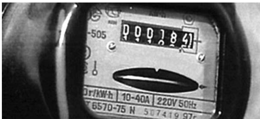
● НА ФОТО: СЧЕТЧИК ЭНЕРГЕТИКАМ НЕ УКАЗ

В конце 2008 г. УК ООО «ЖЭО-43» совместно с ОАО «СибирьЭнерго» заменило электросчетчики в подвалах 2-го и 6-го подъездов МКД — якобы была нужда в учете электроэнергии в местах общего пользования. До 1 июля 2009 года отдель-