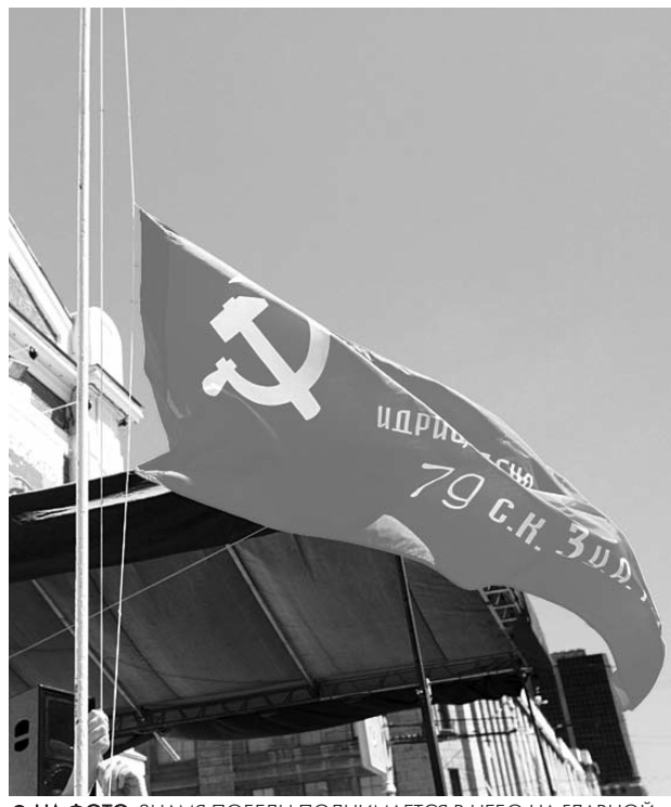
● НА ФОТО: ЗНАМЯ ПОБЕДЫ ПОДНИМАЕТСЯ В НЕБО НА ГЛАВНОЙ ПЛОЩАДКЕ ФЕСТИВАЛЯ ЛЕВОЙ ПРЕССЫ «ДЕНЬ ПРАВДЫ-2010»