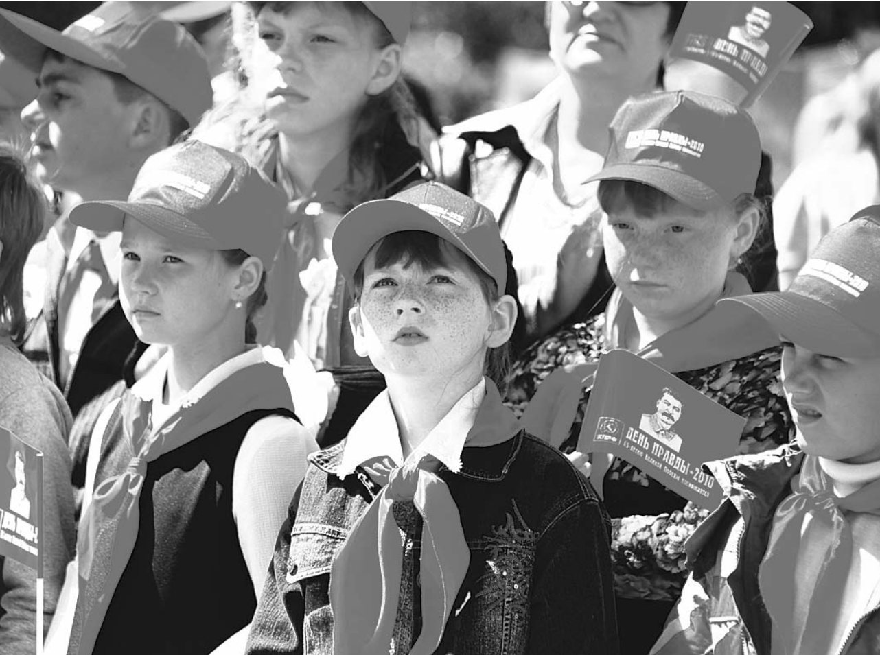
● НА ФОТО: КПРФ ПОДАРИЛА НОВОСИБИРСКУ ПРАЗДНИК