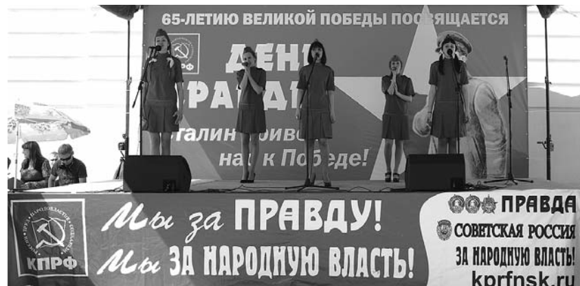
● НА ФОТО: НА ГЛАВНОЙ СЦЕНЕ ЗВУЧАЛИ ПАТРИОТИЧЕСКИЕ ПЕСНИ