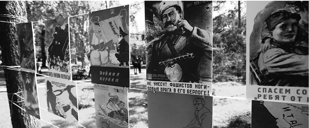
● НА ФОТО: ВЫСТАВКА ВОЕННЫХ ПЛАКАТОВ