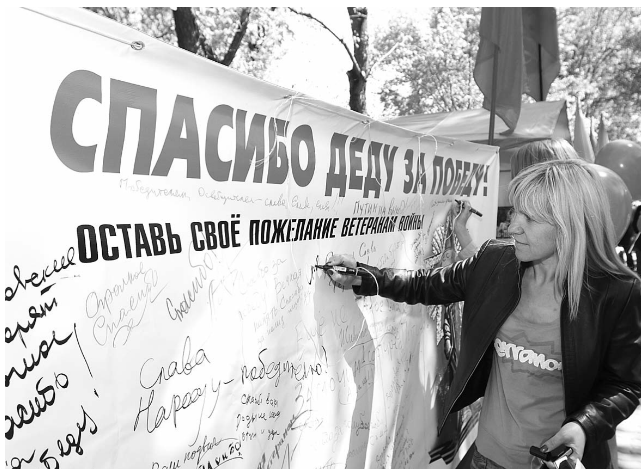
● НА ФОТО: НОВОСИБИРЦЫ БЛАГОДАРЯТ ВЕТЕРАНОВ ЗА ПОБЕДУ