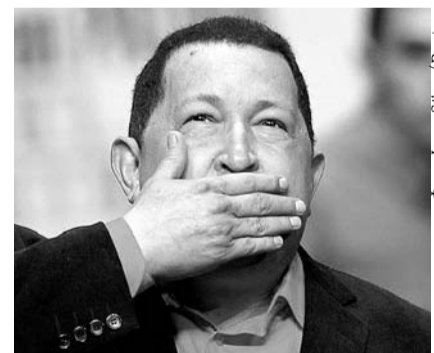
НА ФОТО: ПРОЩАЙ, ЧАВЕС!

верии президенту за Чавеса проголосовали 59% избирателей.