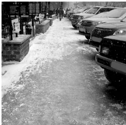
НА ФОТО: ПУТИН В ГОРОДЕ. НА МАШИНЕ ЕХАТЬ НЕ ДАЮТ, А ПЕШКОМ — НЕ ПРОЙТИ

Прощание с президентом ЧАВЕСОМ будет продолжаться три дня. Уго Рафаэль Чавес Фриас умер на 59-м году жизни. Он родился 28 июля 1954 года в местечке Сабанета (штат Баринас). В 1975 году окончил Военную академию