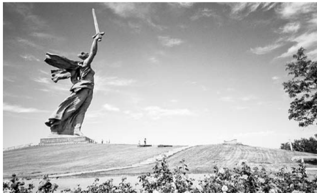
НА ФОТО: ВЕТЕРАНЫ ПРИЗЫВАЮТ ВЕРНУТЬ НА КАРТУ СТАЛИНГРАД

Присутствующие почтили минутой молчания память погибших при защите и умерших в послевоенное время участников Великой Отечественной войны.