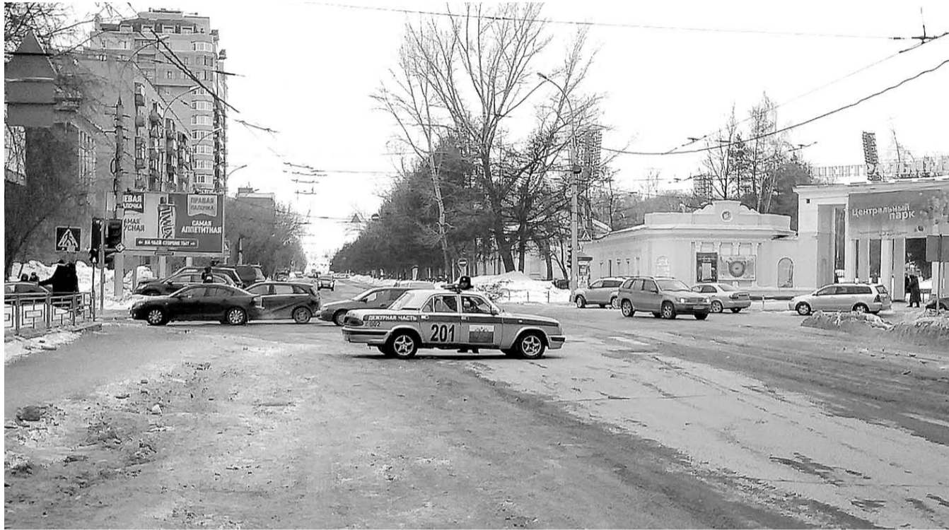
НА ФОТО: ЗА ДЕНЬ ДО ВИЗИТА ПУТИНА ДОРОГИ НОВОСИБИРСКА СПЕШНО ЧИСТИЛИ ОТ СНЕГА, А НЕПОСРЕДСТВЕННО 6 МАРТА — ПЕРЕКРЫЛИ