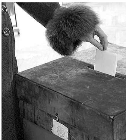
НА ФОТО: КПРФ — ЗА ЧЕСТНЫЕ ВЫБОРЫ!

Практически завершен процесс комплектации избиркомов наблюдателями