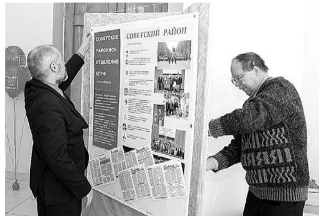
НА ФОТО: ПОСЛЕДНИЕ ПРИГОТОВЛЕНИЯ ПЕРЕД НАЧАЛОМ