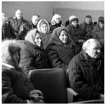
НА ФОТО: ВСТРЕЧА В ИВАНКИНО

Для оставшихся в Аткуле главной проблемой остается питьевая вода. Особенно усугубилась проблема после того, как село перевели на новую скважину. Теперь, по словам местных жителей, из водопровода льется раствор, содержащий не только железо и