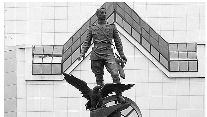
НА ФОТО: ПАМЯТНИК ТРИЖДЫ ГЕРОЮ В НОВОСИБИРСКЕ

Покрышкин-смелый русский воин, Герой, сибирский богатырь. Он нашей памяти достоин, Гордись им, матушка — Сибирь! 100 лет прошло с его рожденья, Но люди помнят и сейчас Его побед больших мгновенья, Все то, что сделал он для нас!