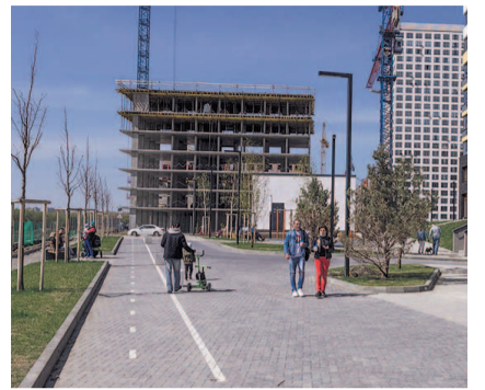
НА ФОТО: СТРОИТЕЛЬСТВО НАБЕРЕЖНОЙ

— Застройщик готов взять на себя ответственность и быстрее начать строительство дороги. В прошлом году мы