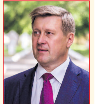
НА ФОТО: АНАТОЛИЙ ЛОКОТЬ

Компания «Медиалогия» опубликовала традиционный рейтинг медийной активности руководителей областных центров Сибирского федерального округа за май 2020 года. Медиаиндекс мэра Новосибирска Анатолия ЛОКТИЯ составил 14 622 пункта, что выше даже, чем у лидеров аналогичных рейтингов — мэров областных центров почти всех округов России.