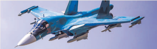
НА ФОТО: ИСТРЕБИТЕЛЬ-БОМБАРДИРОВЩИК СУ-34