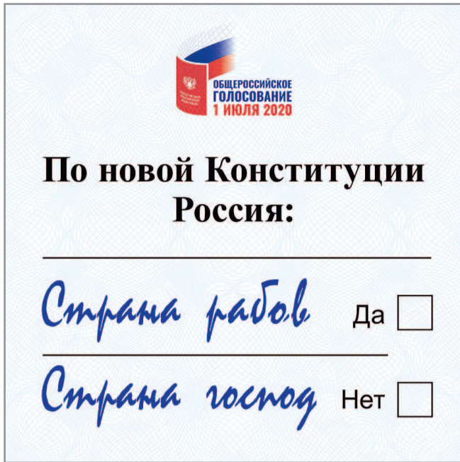
автор: Игорь ПЕТРЫГИН-РОДИОНОВ