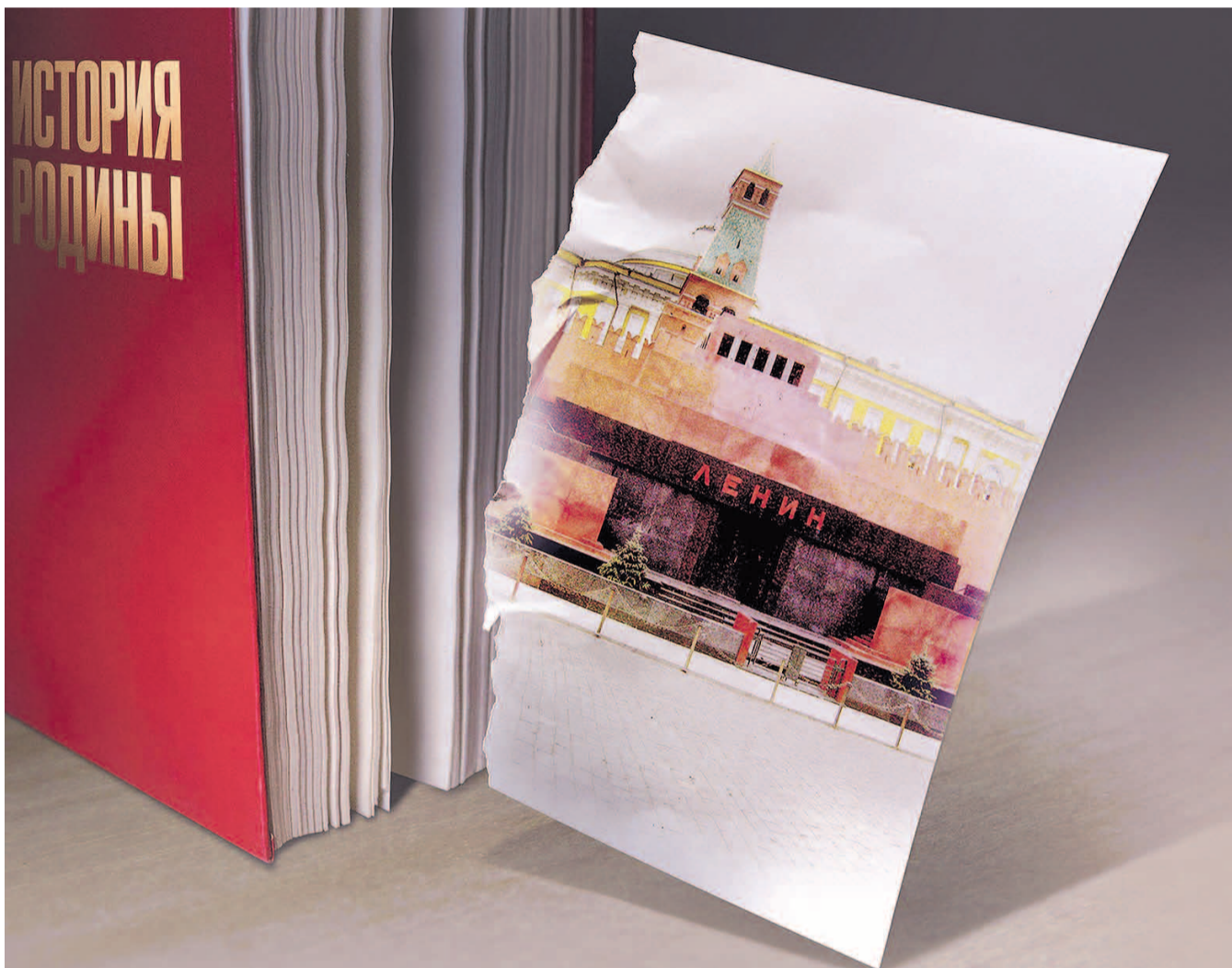
Автор коллажа Игорь ПЕТРИГИН-РОДИОНОВ