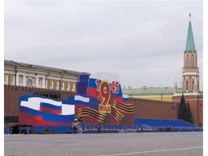
НА ФОТО: ВЛАСТЬ СТЫДЛИВО ПРИКРЫВАЕТ ТРИКОЛОРОМ ВЕЛИКОЕ ПРОШЛОЕ

Мавзолей по праву является одним из символов Победы в Великой Отечественной войне. Он стал свидетелем легендарного парада 7 ноября 1941 года, поднимавшего дух защитников Москвы и всего Советского Союза. Его изображение помещено в центр высшего военного ордена «Победа», учрежденного 8 ноября 1943 года. Указ Президиума Верховного Совета СССР об этой награде появился в прямой связи с достижением коренного перелома в войне. Уникальным орденом награждались лица высшего командного состава Красной Армии и наши союзники за крупные военные операции. К подножию Мавзолея В.И. Ленина солдаты-победители бросили добытые в боях фашистские стяги, включая личный штандарт ГИТЛЕРА . Наш