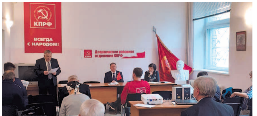
НА ФОТО: НА ОТЧЕТНО-ВЫБОРНОЙ КОНФЕРЕНЦИИ В ДЗЕРЖИНСКОМ РАЙОНЕ

О том, как они работали, говорят итоги соцсоревнований: в отчетный период Дзержинское отделение КПРФ в соревновании между местными отделениями КПРФ города Новосибирска занимало дважды первое и третье места. Среди первичных отделений города первое место занимало первичное