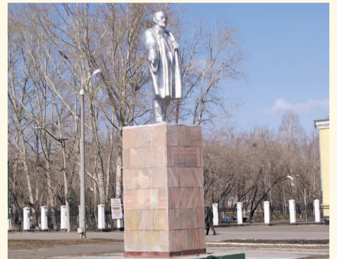
НА ФОТО: БОЛЬШИНСТВО БАРАБИНЦЕВ — ЗА РЕМОНТ ПАМЯТНИКА