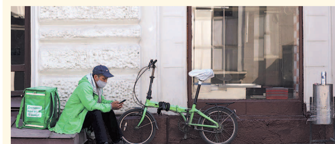
НА ФОТО: ПОКА МОЖНО ЛИШЬ ВЗЯТЬ НА ВЫНОС ИЛИ ДОСТАВКУ