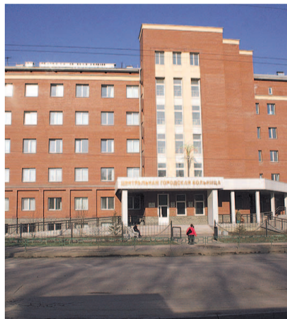
НА ФОТО: ИСКИТИМСКАЯ ЦРБ

— Например, 21 апреля в отделение поступила пациентка, у которой впоследствии был официально выявлен коронавирус, после чего она была переведена в инфекционную больницу города Новосибирска. Медицинская сестра и одна из санитарок непосредственно были в контакте с ней, когда принимали в отделение и в дальнейшем. Однако соответствующих доплат ни за апрель, ни за май не получили,