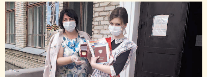
НА ФОТО: АТТЕСТАТЫ ПОЗВОЛЯТ ПОСТУПИТЬ В ВУЗ ДО ЭКЗАМЕНА