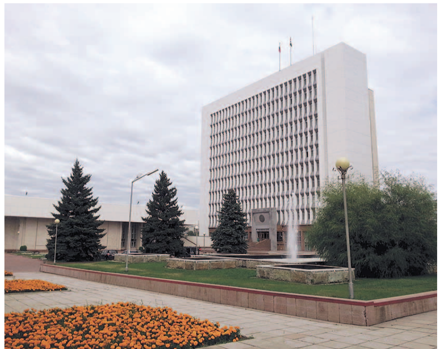
НА ФОТО: СОСТАВ ОБЛАСТНОГО ПАРЛАМЕНТА ОБНОВИТСЯ ОСЕНЬЮ

Выборы в четвертый раз пройдут по смешанной системе 50/50: половина депутатов будет избираться по партийным спискам (партия необходимо будет пройти установленный законодательством 5-процентный барьер), половина — по одномандатным округам. Сейчас по такой системе в областном парламенте присутствуют представители 5 партий: 49 депутатов представ-