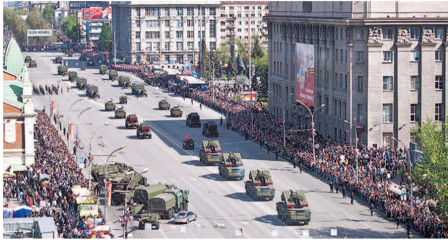
НА ФОТО: ПАРАД СОСТОИТСЯ, НО БЕЗ ЗРИТЕЛЕЙ НА УЛИЦЕ

В составе механизированной колонны пройдут 75 единиц военной техники, в том числе оперативно-тактические ракетные комплексы «Искандер-М», бронированные автомобили марки «Тигр», «БТР», комплексы «С-400», «Панцирь-С1», артиллерийские установки «НОНА-СВК», «Урал-4320» с 2А65 «МСТА-Б».