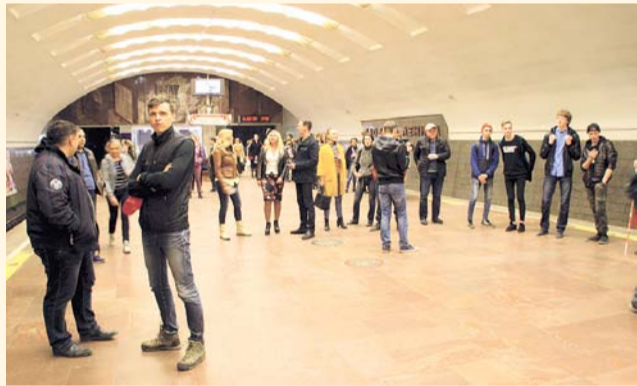
НА ФОТО: ДЕПУТАТЫ СПЕЛИ В МЕТРО