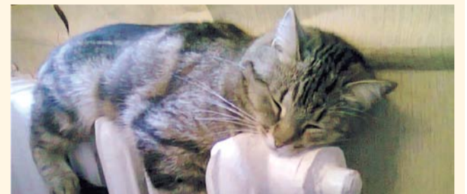
НА ФОТО: В МАЕ НЕ ЗАМЕРЗНЕМ!