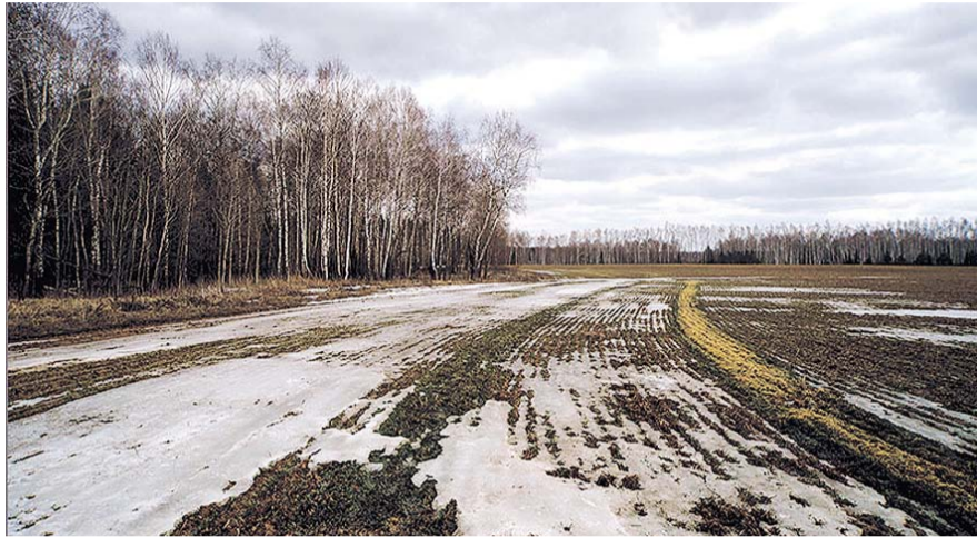
НА ФОТО: ПОСЕВНАЯ ЕЩЕ НЕ НАЧАЛАСЬ, А ПРОГНОЗЫ НА УРОЖАЙ УЖЕ ЕСТЬ

— Почва суше, чем в прошлом году, — говорит агроном, — потому и запасы влаги меньше. Прошедшая снежная зима еще не говорит о больших запасах влаги в почве. Этой зимой запас воды