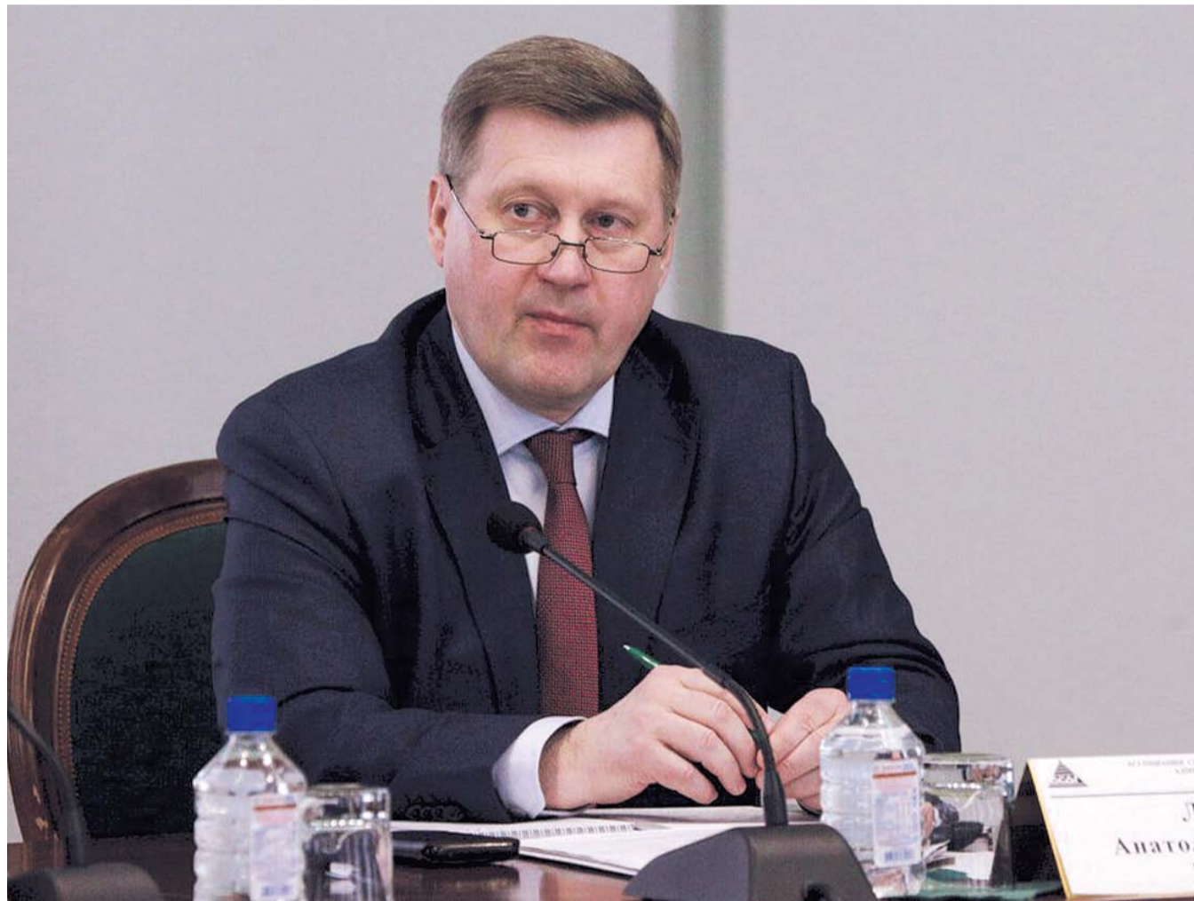
НА ФОТО: МЭР НОВОСИБИРСКА АНАТОЛИЙ ЛОКОТЬ ПРЕДЛАГАЕТ ИЗМЕНИТЬ В ПОЛЬЗУ МУНИЦИПАЛИТЕТОВ СИСТЕМУ РАСПРЕДЕЛЕНИЯ НАЛОГОВ