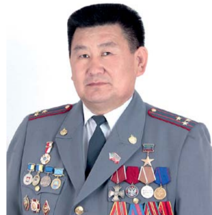
НА ФОТО: ГЕРОЙ РОССИИ ВЯЧЕСЛАВ МАРХАЕВ

треть рейтинги, которые представляют разные социологические опросы, то можно увидеть, что, по разным индексам и показателям, мы представлены не выше 70-го места. Уровень же коррупционности нашей республики — наиболее высокий. На мой взгляд, причина этому — политика навязывания так называемых людей со стороны. Бывший вице-губернатор Томской области НОГОВИЦИН возглавлял республику десять лет, не зная ее специфики, отношений, которые складываются в разных направлениях, ментальность. Когда люди этого не знают, им, конечно, сложно. Изначально было понятно, что власть команды Ноговицина — это путь в никуда. Однако через пять лет его назначили снова. Более того, мне, на тот момент депутату Государственной думы, в Народном Хурале не дали слова, чтобы я мог обосновать то, почему этого человека нельзя переназначать. Конечно, у нас в Сибири, особенно в Бурятии, народ очень спокойный, и у кого-то еще остается вера во власть, потому люди были в ожидании. Однако последние десять лет — для республики потерянное время. И это сейчас признают многие. Ну и, думаю, что в нашей республике сегодня слабое законодательство, услужливое правосудие, правоохранительная система. Все это вкруп привело к тому, что мы наблюдаем. Из республики ушел бизнес, несмотря на заявления первых лиц государства о том, что его нельзя «кошмарить». Промышленные гиганты работают на треть, а многие канули в историю. И это не мое мнение как представителя КПРФ, это мнение, как минимум, половины населения республики. Потому