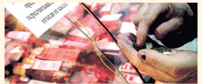
НА ФОТО: ДЕНЕГ С ТРУДОМ ХВАТАЕТ НА ЕДУ