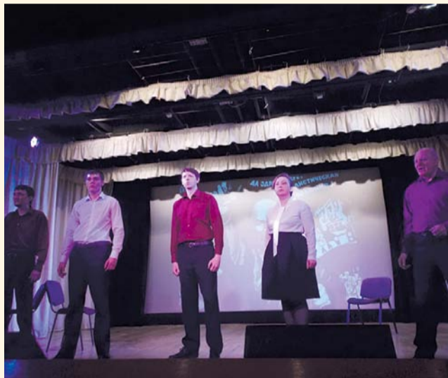
НА ФОТО: КОММУНИСТЫ В ГЛАВНЫХ РОЛЯХ