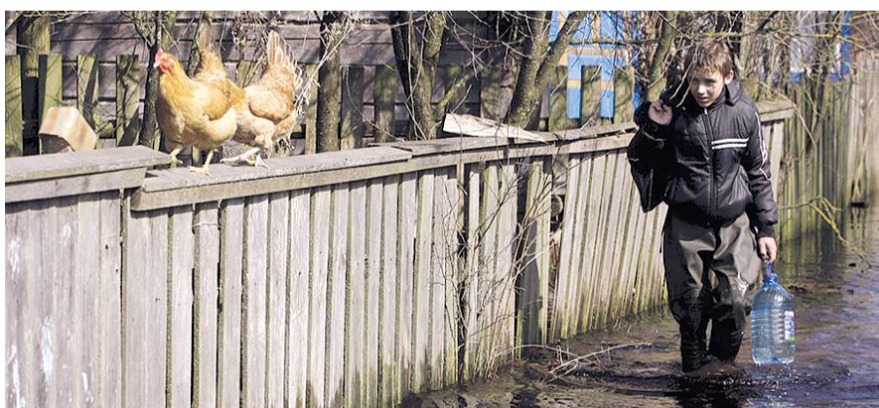
НА ФОТО: МЧС КОНТРОЛИРУЕТ СИТУАЦИЮ В ПОДТОПЛЯЕМЫХ СЕЛАХ

— Например, село Крещенское, расположенное в северной части района, — рассказывает Николай Шудрик. —