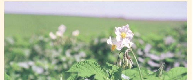
НА ФОТО: КАРТОФЕЛЬ — ОСНОВА ПРОДОВОЛЬСТВЕННОЙ БЕЗОПАСНОСТИ