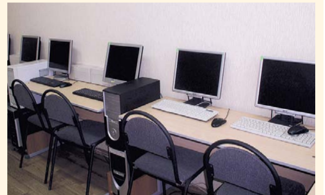
НА ФОТО: КОМПЬЮТЕРИЗАЦИЯ ДОБРАЛАСЬ ДО ДЕРЕВЕНЬ