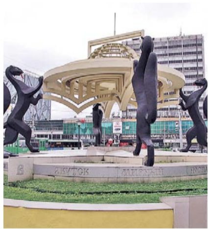
НА ФОТО: У МУНИЦИПАЛИТЕТОВ ДОЛЖНЫ БЫТЬ СРЕДСТВА НА РАЗВИТИЕ

— Проблема финансовой обеспеченности местных бюджетов актуальна для всех муниципалитетов — это общее уязвимое место государственной политики. Сегодня большинство крупных городов, не говоря уже о малых, остались практически без бюджетов развития, — подчеркнул Анатолий Локоть . — На уровне муниципалитетов страны дисбаланс усиливается, особенно остро это ощущается в крупных городах, таких, как Новосибирск. Нельзя строить жизнь города с населением 1,6 млн человек, планируя его развитие только от одной федеральной программы до другой, при этом собственных средств для планового развития у нас становится все меньше. То, что мы вошли в соответствующие федеральные программы, — это здорово. Но что такое федеральная программа? Это очень нужный инструмент, который помогает в штурмовом режиме решать накопившиеся проблемы. Мы все сделаем — построим новые дороги, отремонтируем и приве-