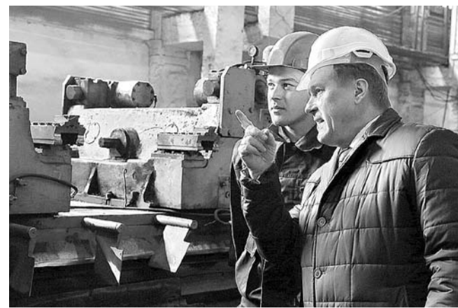
НА ФОТО: АНАТОЛИЙ ЛОКОТЬ НА ЗАВОДЕ «СИБЛИТМАШ»

— Главный объект — Бугринский мост, — отметил мэр. — Ввод в эксплуатацию уникального инженерного сооружения позволил разгрузить ключевые магистрали. Впервые в истории города Кировский, Октябрьский и Первомайский районы стали буквально соседними. Другие важные объекты: улица Колонды — она сейчас соединяет Красный проспект с Лебедевским жилмассивом — в перспективе дорога должна быть достроена до улицы Фадеева. Это разгрузит напряженный трафик между Заельцовским и Калининским районами. Также в течение года частично расширено Мочищенское шоссе.