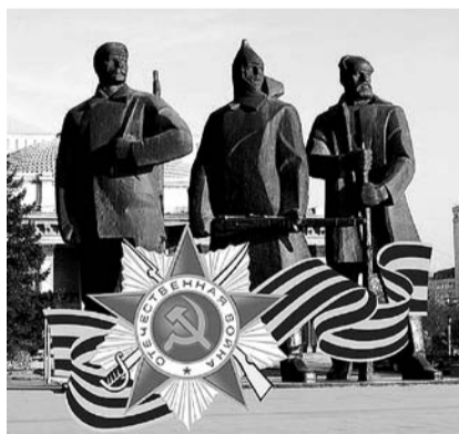
НА ФОТО: ГОРОД-ГЕРОЙ НОВОСИБИРСК

— За годы Великой Отечественной войны из Новосибирской области ушли на фронт более 600 тыс. человек. На территории области было укомплектовано 4 дивизии, 10 бригад, 7 полков, 62 роты, 24 различные команды. Новосибирск и область воспитали