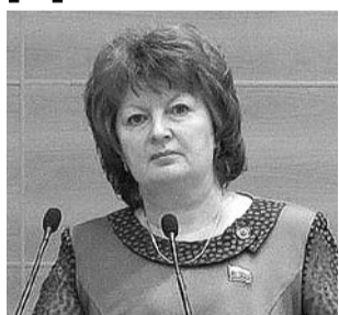
НА ФОТО: ДЕПУТАТ ЗАКСОБРАНИИ СВЕТАЛА ВАНДАКУРОВА

Депутат Заксобрания Новосибирской области, член комитета по социальной политике Светлана ВАНДАКУРОВА прокомментировала инициативу регионального Министерства финансов — выплачивать вознаграждения