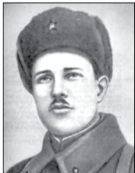
Георгий СУВОРОВ (1919–1944 гг.)

Хотя бы минуту на роздых За окаянных три дня. Но снова уносится в воздух: — Дайте огонь на меня! И снова взлетают с землею Разорванные тела. Метится пламенем боя Насквозь прожженная мгла. И в этих метельных звездах Твердое, как броня, Режет прогоркший воздух: — Дайте огонь на меня! И рухнули наземь звезды, И парень, гранату подняв, С кровью выхаркнул в воздух: — Огонь, огонь на меня!..