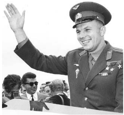
НА ФОТО: ЮРИЙ ГАГАРИН

шиной, но уже социального прогресса человеческого общества. Этого великого праздника ждала также сама Земля и все живое на ней, потому что была достигнута новая ступень в эволюции земной жизни и ее постоянном стремлении к совершенству.