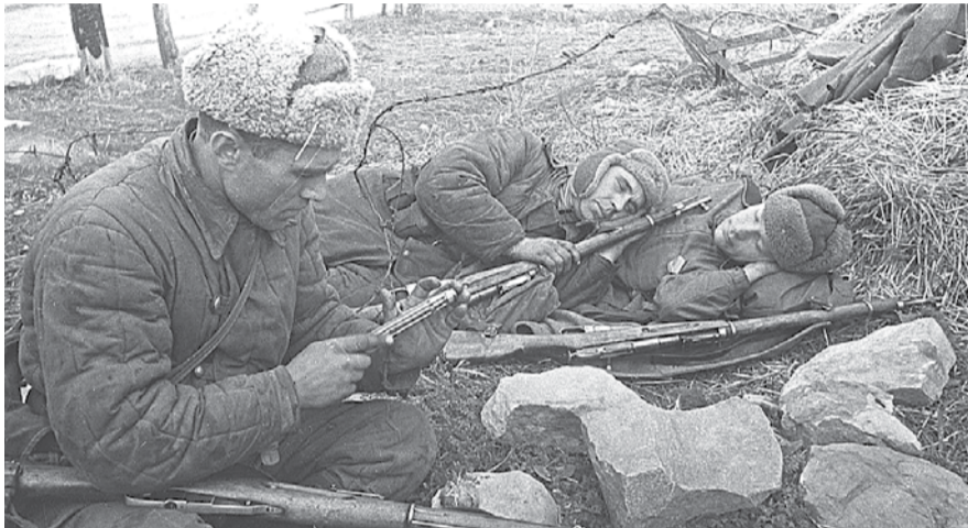
НА ФОТО: СОЛОВЬИ, СОЛОВЬИ, НЕ ТРЕВОЖЬТЕ СОЛДАТ...