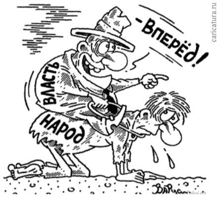
НА РИС.: КОМУ ВЫГОДНЕЕ РЕФОРМА?

Противники этой системы указывают на ее недостатки, в первую очередь на то, что «третья модель» выгодна только «Единой России», поскольку областная администрация и большинство муниципальных Советов связаны с этой партией. То, что губернатор