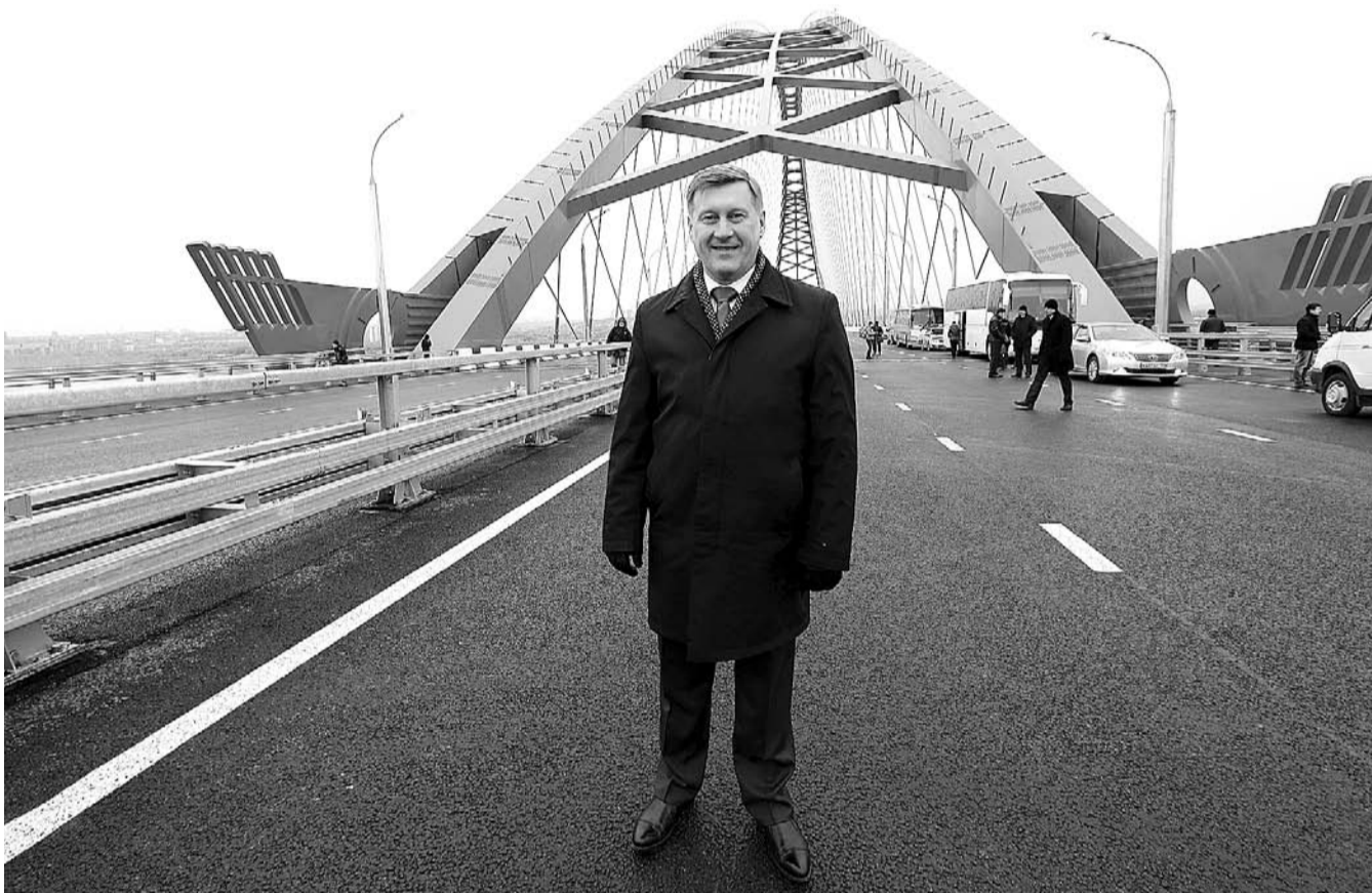
НА ФОТО: АНАТОЛИЙ ЛОКОТЬ НА ОТКРЫТИИ БУГРИНСКОГО МОСТА