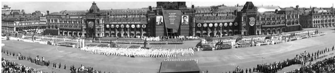
НА ФОТО: ВСЕСОЮЗНЫЙ ПАРАД ФИЗКУЛЬТУРНИКОВ. 12 АВГУСТА 1945 ГОДА