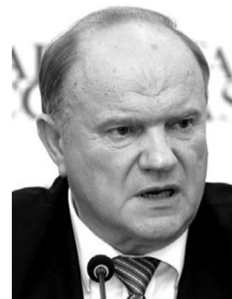
НА ФОТО: ГЕННАДИЙ ЗЮГАНОВ

Геннадий ЗЮГАНОВ: Дадим отпор фашистам и бандеровцам!