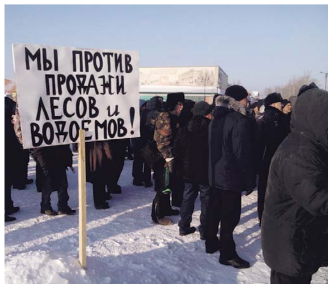
НА ФОТО: ОХОТНИКИ ГОТОВЫ СТОЯТЬ ЗА СВОИ ПРАВА ДАЖЕ В МОРОЗ

Митинг был заявлен в соответствии с требованиями закона, однако, как стало известно корреспонденту газеты «За народную власть!», организаторов «прорабатывали» представители городской и районной власти с тем, чтобы отменить мероприятие. Затем надеялись на слабую явку из-за серьезного похолодания — синоптики накануне митинга пообещали -32°C. С прогнозом почти не ошиблись — температура в Куйбышеве утром опустилась до -30°C. Однако, на снижение явки это если и повлияло, то незначительно. В митинге приняли участие более 400 человек. Для города с населением в 45 тысяч человек — событие крупномасштабное.