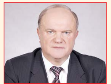
НА ФОТО: ГЕННАДИЙ ЗЮГАНОВ

13 февраля в ИА ТАСС прошла пресс-конференция, посвященная выходу в свет новой книги Г.А. ЗЮГАНОВА «Время выбора, время действий. 1917-2017».