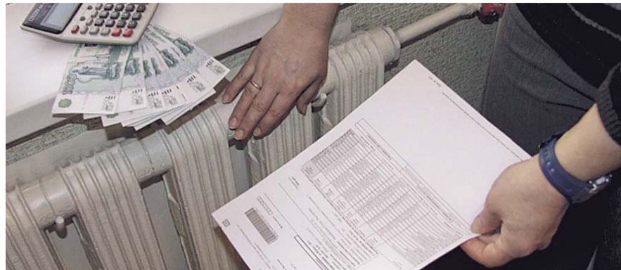
НА ФОТО: ЗИМА ВЫДАЛАСЬ ХОЛОДНАЯ, ИЗВОЛЬТЕ ОПЛАТИТЬ!

бранной системы расчетов, утверждая, что оплата по факту является более прозрачной и удобной.