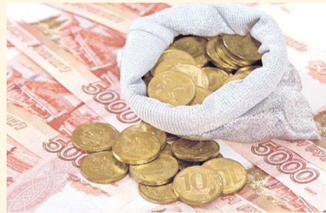
НА ФОТО: ДОЛГИ ГРОЗЯТ ОБРУШИТЬ ЭКОНОМИКУ РОССИИ