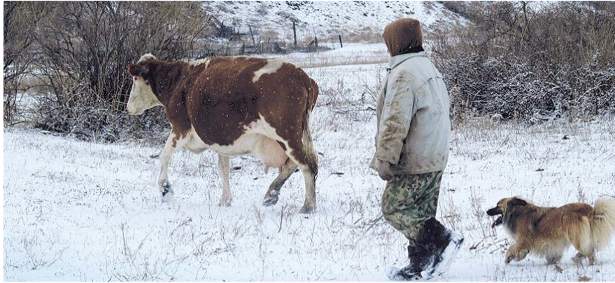
НА ФОТО: КОРОВА НА СЕЛЕ СТАНОВИТСЯ РЕДКОСТЬЮ

Как последовало из ответа за подписью министра сельского хозяйства Ва-