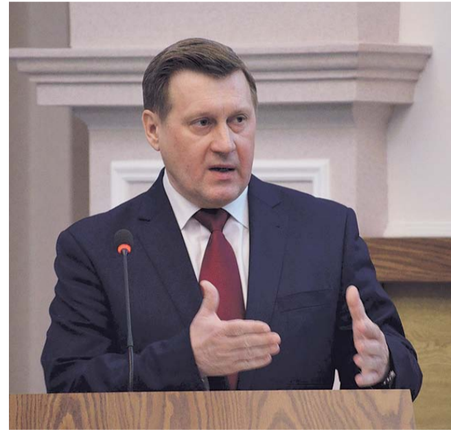
НА ФОТО: МЭР НОВОСИБИРСКА АНАТОЛИЙ ЛОКОТЬ

В жилищно-коммунальном комплексе муниципалитет стабильно решает текущие задачи, вовремя получен паспорт готовности к отопительному сезону, отремонтировано 62 километра теплосетей.