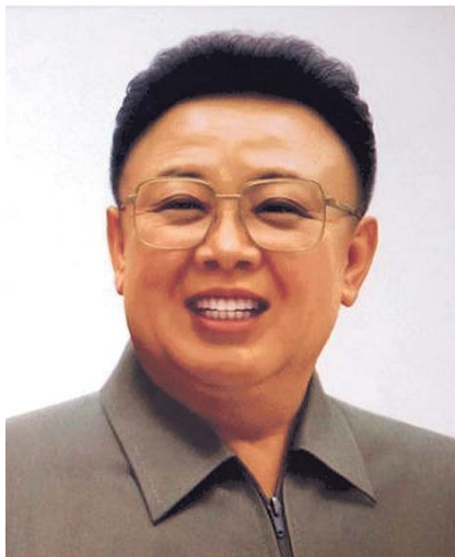
НА ФОТО: КИМ ЧЕН ИР

Следующим пунктом пребывания корейского вождя в нашем городе стало НАПО им. Чкалова. По пути на предприятие лидер КНДР пожелал познакомиться с новосибирским метро, куда