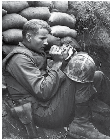
НА ФОТО: СПАСЕНИЕ КОТЕНКА ВО ВРЕМЯ ВОЙНЫ. НЕСМОТЯ НА ВСЕ УЖАСЫ ВОЙНЫ, ЭТОТ СОЛДАТ НАШЕЛ ВРЕМЯ ПОКОРМИТЬ ИЗ ПИПЕТКИ КОТЕНКА