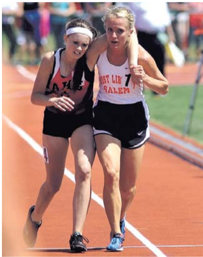
НА ФОТО: ЗВЕЗДА БЕГОВЫХ ДОРОЖЕК В ОГАЙО ПОМОГАЕТ СВОЕЙ ПОДВЕРНУВШЕЙ НОГУ СОПЕРНИЦЕ ПЕРЕСЕЧЬ ФИНИШНУЮ ЛИНИЮ