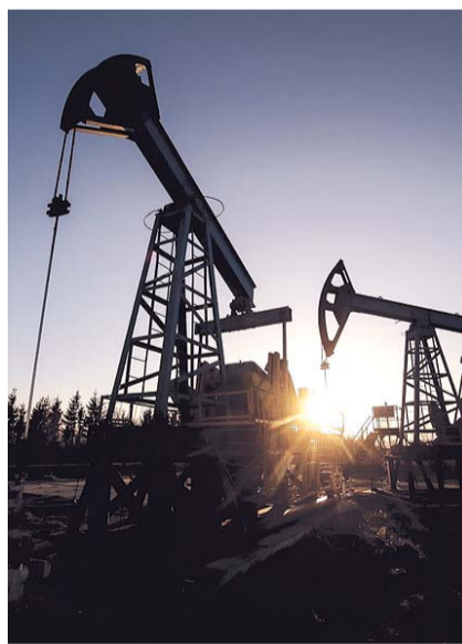
НА ФОТО: ЗАКРОМА РОДИНЫ

61% опрошенных ответили, что Россия сейчас не может жить без продажи нефти, в 2012 году, когда цены на нефть были больше, чем в 2017, таковых было 56%. При этом надо отметить, что в 2012 году 49% респондентов отмечали, что сырьевая модель экономики России, когда наибольшие доходы страна получает от экспорта сырья, — это неправильно, только 27% не видели в этом чего-то плохого. К 2017 году процентная доля думающих так возросла до 46%, а число тех, которым казалось, что «экономика трубы» — это неприемлемо, сократилось до 41%. Очевидно, что наступивший социально-экономический кризис заставил россиян