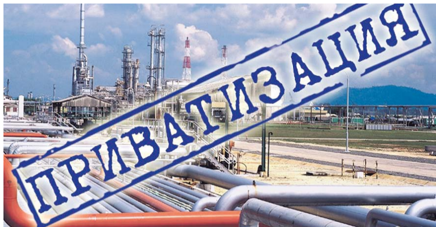
НА ФОТО: ЕЩЕ ЕСТЬ, ЧТО ПРОДАТЬ

Видимо, Кабмин окрылила успешная приватизация госпакета «Роснефти» — благодаря поступлению 721 млрд.