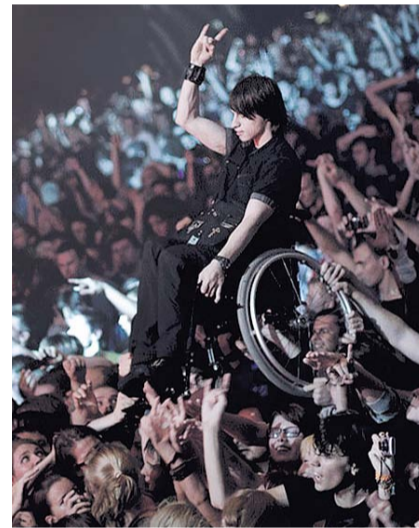
НА ФОТО: ФАНАТЫ ДАЮТ ВОЗМОЖНОСТЬ СВОЕМО ПРИКОВАННОМУ К КРЕСЛУ ДРУГУ ПОСМОТРЕТЬ КОНЦЕРТ ГРУППЫ «KORN» В МОСКВЕ