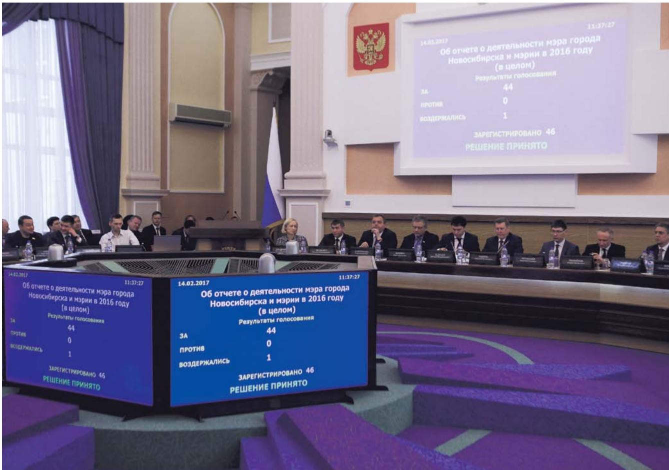
НА ФОТО: НА ГОЛОСОВАНИИ ДЕПУТАТЫ ГОРСОВЕТА НОВОСИБИРСКА ВЫРАЗИЛИ КОНСОЛИДИРОВАННУЮ ПОЗИЦИЮ