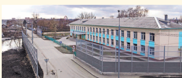
НА ФОТО: ИННОВАЦИОННОЕ ОТОПЛЕНИЕ ЗАПУЩЕНО В ШКОЛЕ