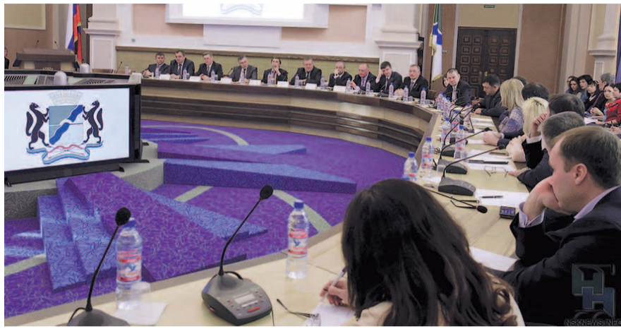
НА ФОТО: ГОРСОВЕТУ БЫЛ ПРЕДСТАВЛЕН ПРОЕКТ БЮДЖЕТА НОВОСИБИРСКА НА 2020 ГОД

В 2020 году город будет принимать участие сразу в четырех национальных проектах — «Образование», «Демография», «Жилье и городская среда», «Безопасные и качественные автомобильные