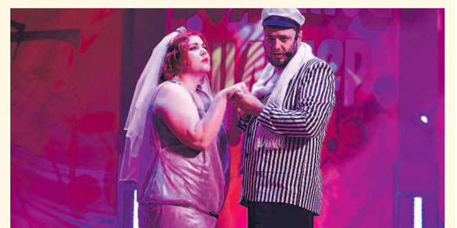
НА ФОТО: ИЛЬФ И ПЕТРОВ АКТУАЛЬНЫ, КАК НИКОГДА