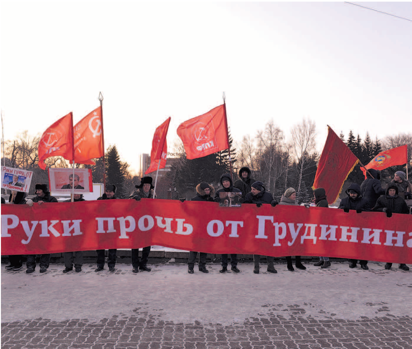
НА ФОТО: НЕСМОТЯ НА МОРОЗЫ НОВОСИБИРЦЫ ВЫШЛИ НА ПИКЕТ, ЧТОБЫ ПОДДЕРЖАТЬ РУКОВОДИТЕЛЯ СОВХОЗА ИМ. ЛЕНИНА