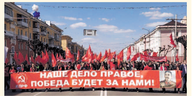
НА ФОТО: С НАРОДОМ — КПРФ!