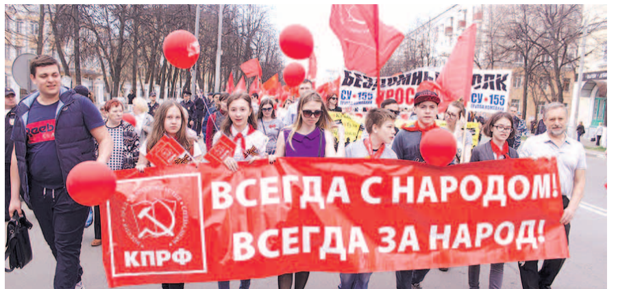
НА ФОТО: НА СМЕНУ КПРФ ЕЩЕ НИКТО НЕ ПРИШЕЛ!

— Люди сначала приходят в партию с идеями «за все хорошее, против всего плохого», но потом в КПРФ получают те знания, те моральные устои, кото-