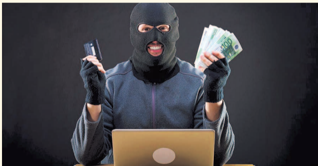
НА ФОТО: ВЫ ЗНАЕТЕ, ЧТО ТАКОЕ КИБЕРБЕЗОПАСНОСТЬ?