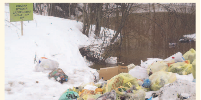
НА ФОТО: ГОРОД МОЖЕТ ПРЕВРАТИТЬСЯ В СВАЛКУ