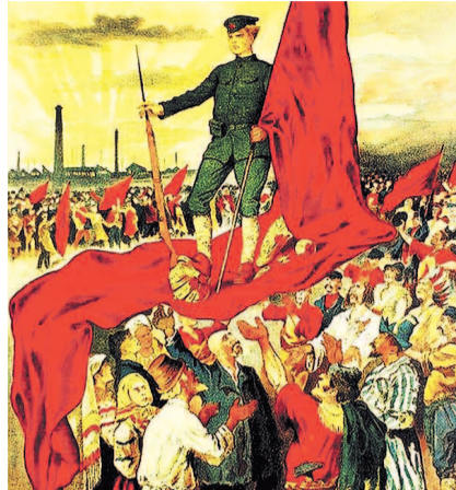
НА ФОТО: НАРОДЫ ВСЕГО МИРА ПРИВЕТСТВУЮТ КРАСНУЮ АРМИЮ ТРУДА

Жизнь показала: белые не смогли решить национальный, крестьянский, рабочий, женский и другие назревшие вопросы. Они, собственно, и не со-