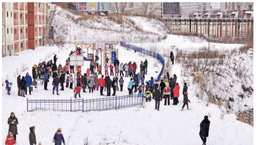
НА ФОТО: ЖИТЕЛЯМ НУЖНЫ МОСТ И ПАРК, А НЕ ДОРОГА

Участок земли от Красного проспекта до Ипподромской магистрали в 2007 году был внесен в Генеральный план Новосибирска под названием «Улица Предпринимателей». Дорогу планировали пропустить через Красный про-