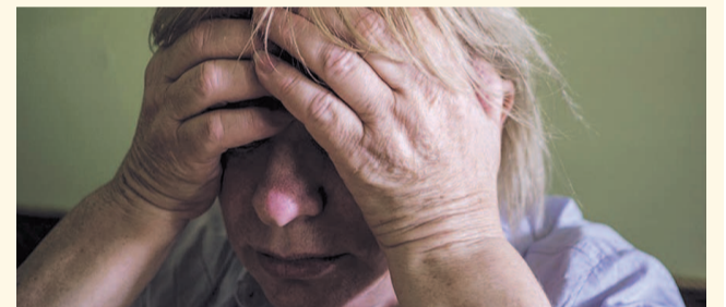
НА ФОТО: МЕЖДУНАРОДНАЯ НАПРЯЖЕННОСТЬ? ДОМА ЕСТЬ НЕЧЕГО!