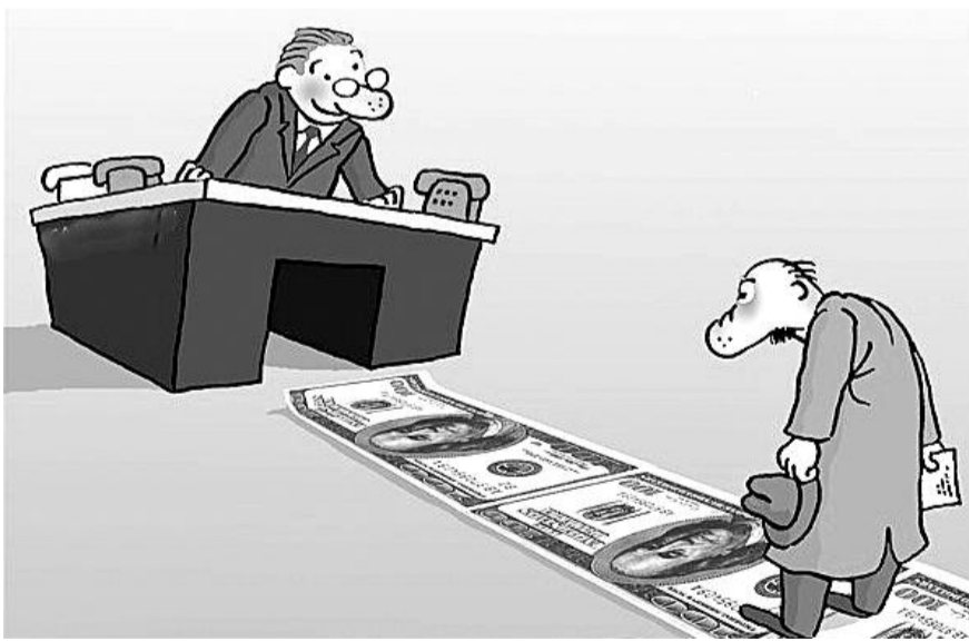
● НА ФОТО: ДОЛГАЯ И ОЧЕНЬ ДОРОГАЯ ДОРОЖКА К ЧИНОВНИКУ