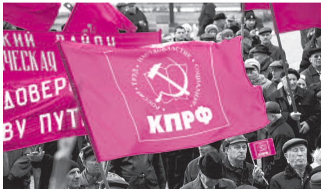
■ НА ФОТО: МАССОВЫЙ МИТИНГ 7 НОЯБРЯ 2010 ГОДА