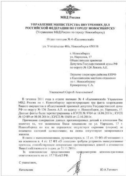
● НА ФОТО: ПОЛИЦЕЙСКАЯ ДЕПЕША