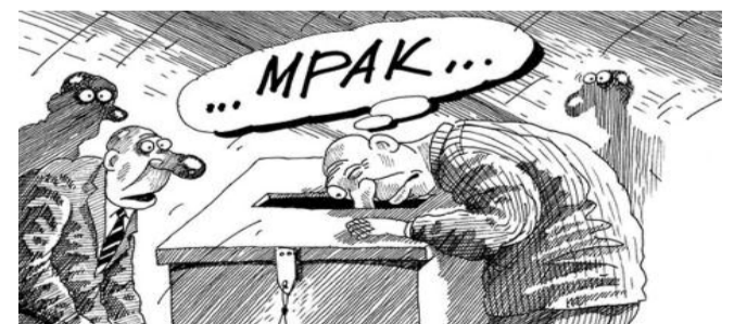
■ НА РИС: ИЗБИРАТЕЛЬ, НЕ ДАЙ СЕБЯ ОБМАНУТЫ

В редакцию сайта КПРФНск поступила информация о том, что в Октябрьском районе неизвестные молодые люди ходят по квартирам избирателей, предлагая брать открепительные удостоверения и голосовать за «Единую Россию» на другом участке.