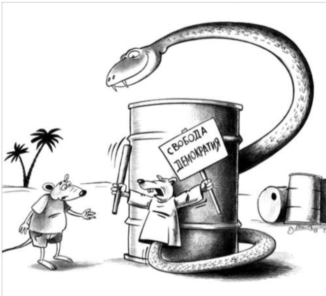
карикатура Сергея КОРШУНА