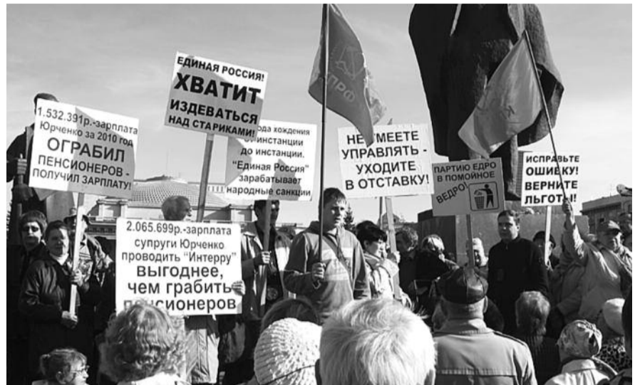
■ НА ФОТО: КПРФ ЗА ВОЗВРАЩЕНИЕ ЛЬГОТНОГО ПРОЕЗДА ВСЕМ КАТЕГОРИЯМ ПЕНСИОНЕРОВ

Кроме этого, в бюджет не включены средства на финансирование наказов избирателей. На комитете по бюджету в Законо-