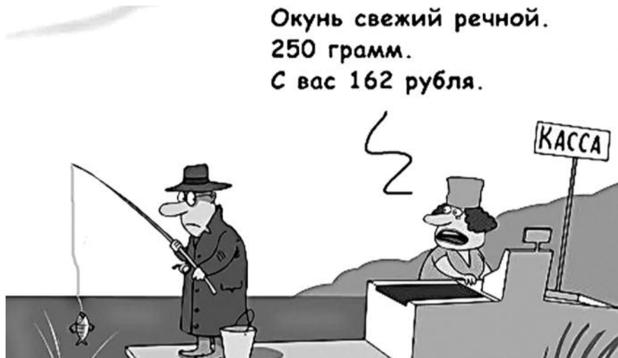
● НА РИС.: ЗА ВСЕ В ЖИЗНИ НАДО ПЛАТИТЬ. ТЕПЕРЬ И ЗА РЫБАЛКУ ТОЖЕ

Для тех, кто предпочитает ловить рыбу не в городских сточных водах или за пределами родной деревни, будут введены «фиш-карты», оскорбившие рыбаков в этом году. Создание системы рыбных карт, которые должны приобрести все рыболовы, фактически легализует в России платную рыбалку. По предварительным расчетам Росрыболовства, такая карта может стоить до 500 рублей в год. Средства, полученные от продажи карты рыбака,