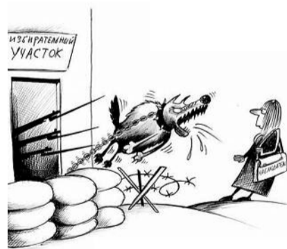
● НА РИС.: ОСТОРОЖНО, ЗЛОЙ ИЗБИРКОМ

Новосибирска, — делится одна из жительниц дома, Людмила ПЛАТОНОВА , — власти попросту наплевать на жильцов, при том, что большинство из них пожилые люди — ветераны, инвалиды, труженики тыла, в общей сложности отдавшие, как я