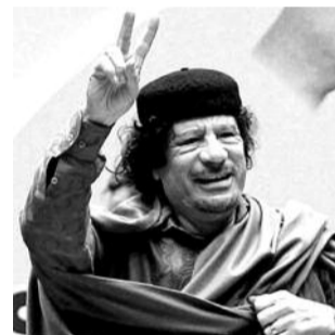
• ПОЛКОВНИК КАДДАФИ

Злодейское убийство законного главы Ливийского государства полковника Муаммара КАДДАФИ потрясло весь мир. Это преступление возвращает нас в мрачные времена колониализма XIX века, когда европейские захватчики безжалостно расправлялись с вождями непокорных народов.