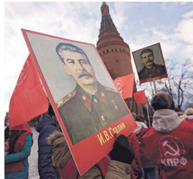
НА ФОТО: ПОПУЛЯРНОСТЬ И.В.СТАЛИНА РАСТЕТ

Что же касается общих оценок правления Сталина, то пропорции между его сторонниками и критиками не в пользу по-