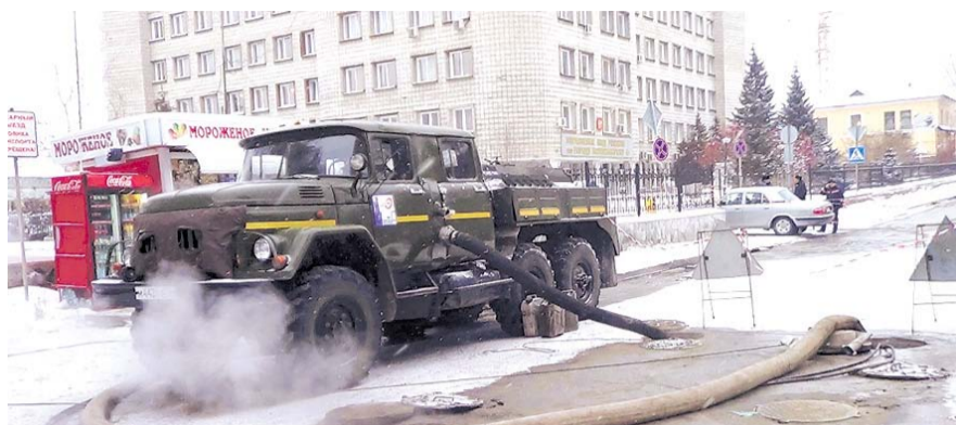
НА ФОТО: АВАРИЙНЫЕ СЛУЖБЫ ГОРОДА СО СВОЕЙ ЗАДАЧЕЙ СПРАВИЛИСЬ

— В максимально сжатые сроки были проведены ремонтные работы, заменена дефектная труба. К 19 часам 4 января работы были завершены, и специалисты приступили к наполнению систем теплоснабжения. Считаю, что службы сработали эффективно, не