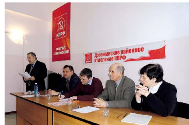
НА ФОТО: ПРЕЗИДИУМ СОБРАНИЯ

8 января состоялось собрание Дзержинского местного отделения КПРФ. Коммунисты и сторонники партии подвели итоги выборов в Законодательное собрание Новосибирской области и Совет депутатов города Новосибирска, а также обсудили задачи в ходе избирательной кампании по выборам депутатов Госдумы.