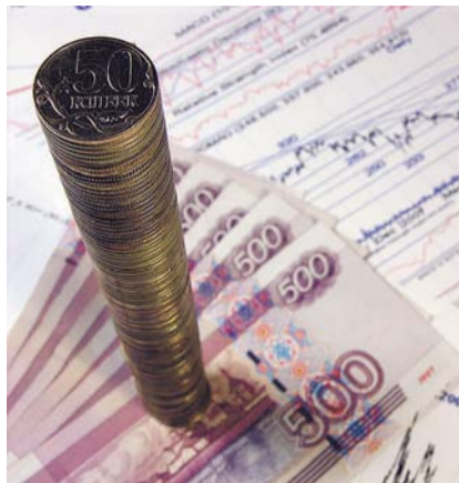
НА ФОТО: БЮДЖЕТ ПОЙДЕТ ПОД НОЖ

В любом случае, вопрос на сегодня один: какие расходы немедленно пускать под нож? Сокращение планируется с учетом так называемой закрытой части расходов. Это значит, что под секвестр попадает почти половина бюджета — 7,1 трлн рублей, и что десятипроцентное обрезание может сэ-