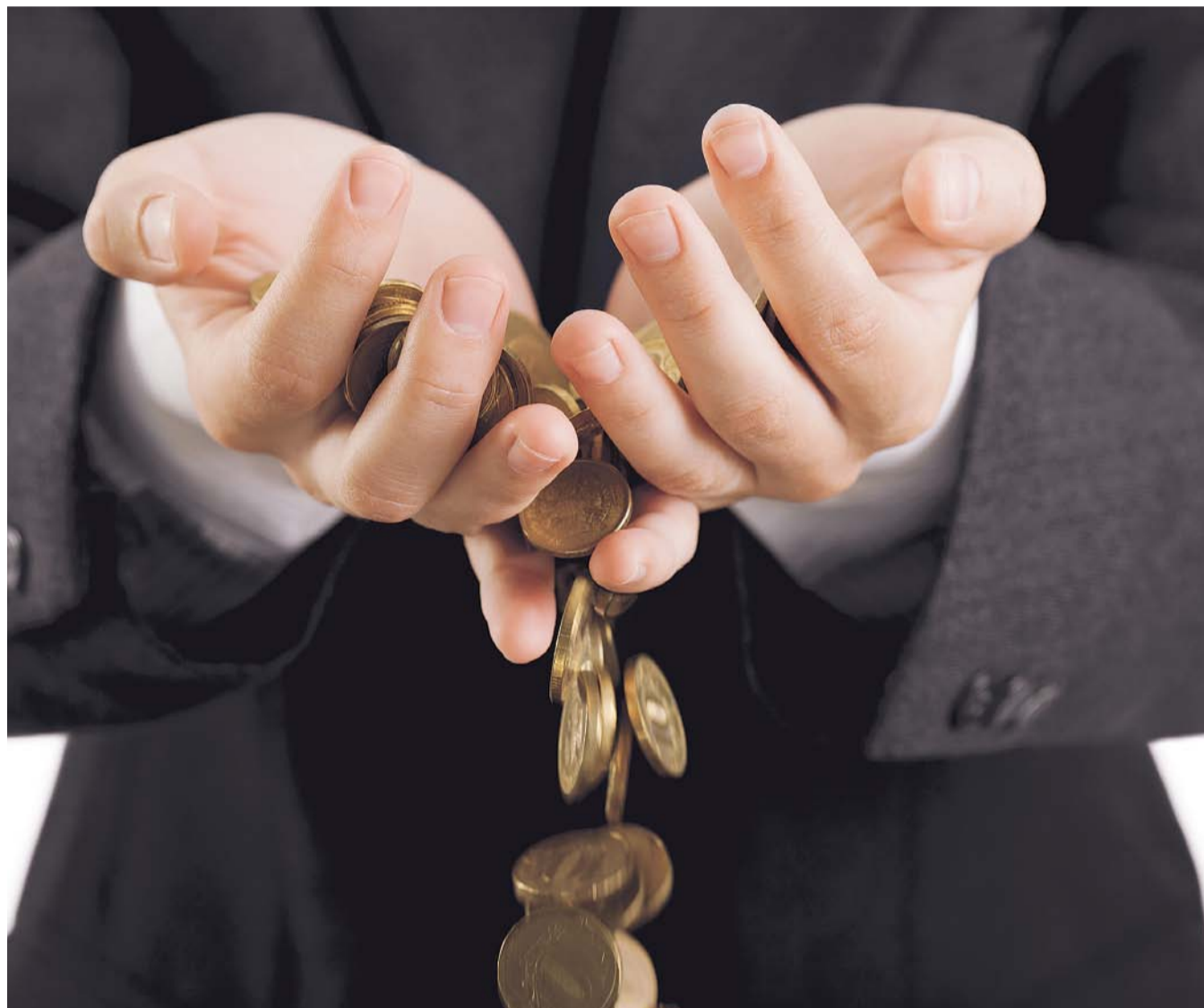
НА ФОТО: РОССИЙСКИЙ БЮДЖЕТ СОКРАЩАЕТСЯ КАТАСТРОФИЧЕСКИМИ ТЕМПАМИ