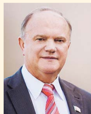
НА ФОТО: ЛИДЕР КПРФ

Интервью Председателя ЦК КПРФ Г.ЗЮГАНОВА.