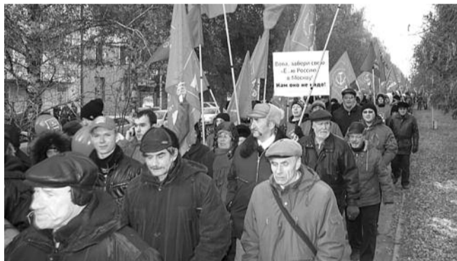
■ НА ФОТО: ПРАЗДНИЧНАЯ КОЛОННА 7 НОЯБРЯ 2011 ГОДА

Самым острым в повестке вопросом стали результаты выборов 14 октября для Новосибирского отделения КПКРФ. Как отметили выступающие, итоги работы коммунистов нельзя назвать блестящими. Так, не удалось завоевать мандат на довыборах в Бердский Горсовет, хотя эти довыборы в свете нынешней острой ситуации в спутнике Новосибирска были для Новосибирского обкома крайне важны. В качестве одной из причин члены бюро назвали недостаточные усилия местной организации КПКРФ. Впрочем, были 14 октября и успехи на местных выборах, которые заметили на уровне федеральном. Так, в Куйбышеве на выборах в Райсовет по двум округам из трех победы одержали кандидаты КПКРФ. По результатам этих выборов фракция КПКРФ в Совете увеличилась вдвое. Здесь, по словам второго секретаря Обкома КПКРФ Рената СУЛЕЙМАНОВА , стоит отметить качественную работу куйбышевских коммунистов под руководством секретаря Сергея ЗАРЕМБО и Ленинского РК Новосибирска, от которого на выборах в Куйбышеве работала группа под руководством Романа ЯКОВЛЕВА . Результаты выборов 14 октября будут подвергнуты особому анализу.