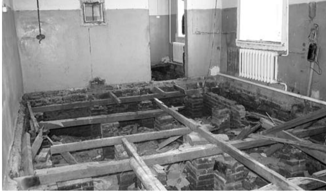
■ НА ФОТО: В СОКУРСКОЙ БОЛЬНИЦЕ ИДЕТ РЕМОТ. БЕСКОНЕЧНЫЙ?

Ремонт Сокурской больницы в Мошковском районе начали в ноябре 2011 года и... продолжают до сих пор. Окончания этому ремонту не видно. При таких темпах можно предположить, что работа завершится года через два, не раньше. А ведь люди ждут, насколько могут «ждать» люди больные.