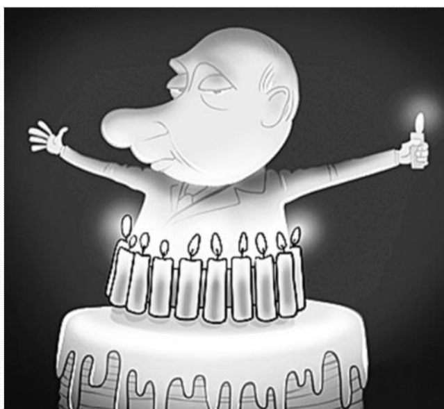
карикатура Сергея ЕПИКИНА / РОИТ.РУ