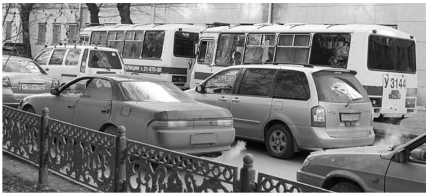
■ НА ФОТО: В ПРОШЛОМ ГОДУ ШЕСТВИЕ КОММУНИСТОВ СОПРОВОЖДАЛИ ОТРЯДЫ ОМОНА

Напомним, что демонстрация 7 ноября в 2011 году состоялась, несмотря на запрет властей, пожелавших вытеснить коммунистов из центра Новосибирска. Больше