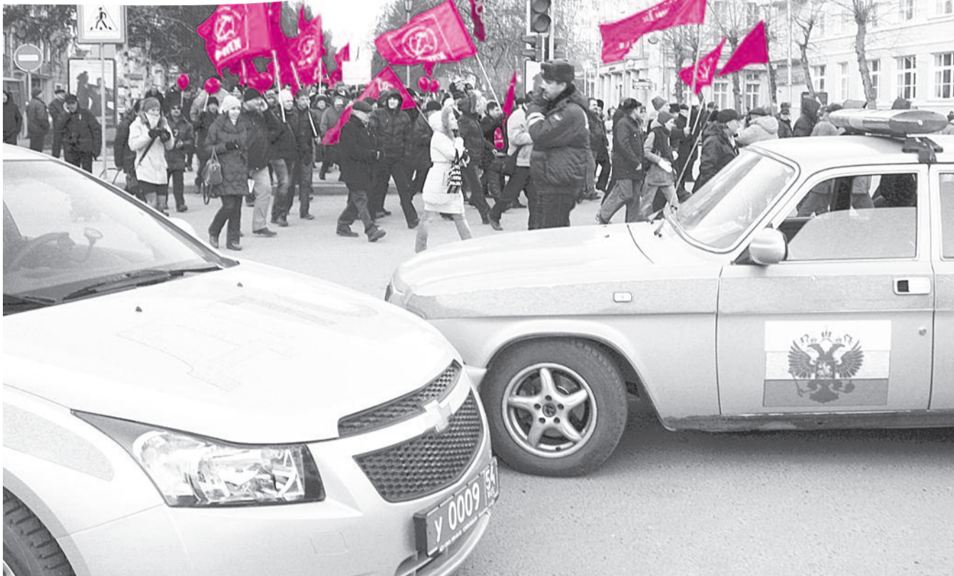
● НА ФОТО: В ПРОШЛОМ ГОДУ ШЕСТВИЕ В ЧЕСТЬ ВЕЛИКОГО ОКТЯБРЯ ВЛАСТИ «ВЫДАВИЛИ» НА АЛЛЕЮ. В ЭТОМ ГОДУ ЭТО НЕ ПОВТОРИТСЯ