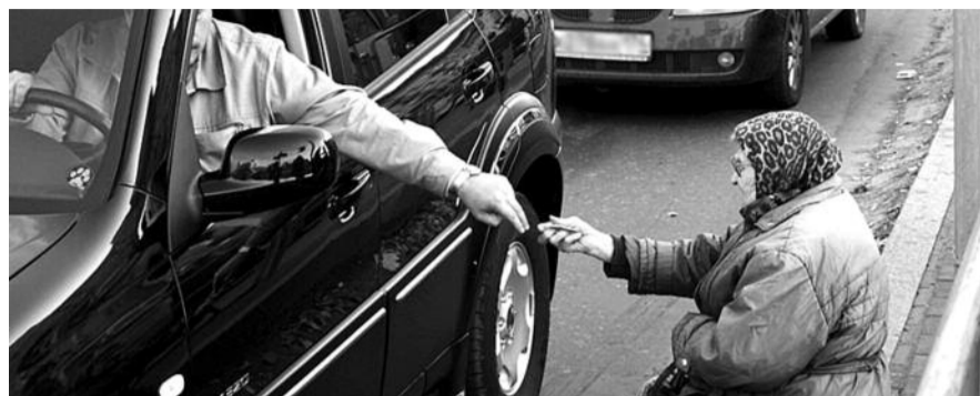
● НА ФОТО: САМЫЕ БОГАТЫЕ БОГАТЫЕ И САМЫЕ БЕДНЫЕ БЕДНЫЕ ЛЮДИ ЖИВУТ В РОССИИ

Они как раз характеризуют тот бюрократически-олигархический строй, который был у нас построен после распада Советского Союза, когда богатства и власть сосредотачиваются только у очень узкой группы людей. Чтобы это произошло, и была проведена чубайсовская ваучерная приватизация. Да и вообще современный российский капитализм носит характер капитализма дикого, и с оттенками феодального строя. Ситуация вполне приемлема для власти, получающей небольшой слой крайне верных себе людей.