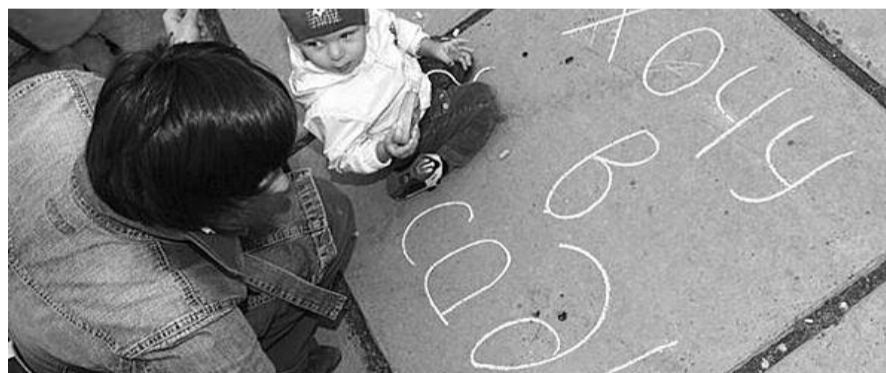
● НА ФОТО: 70 000 ДЕТЕЙ В НОВОСИБИРСКОЙ ОБЛАСТИ НЕ МОГУТ ПОПАСТЬ В ДЕТСКИЙ САД

В настоящее время в Госдуме рассматривается проект закона «Об образовании», в котором ряд нововведений коснется и работы дошкольных детских учреждений. Родительская общественность готовится протестовать против этого.