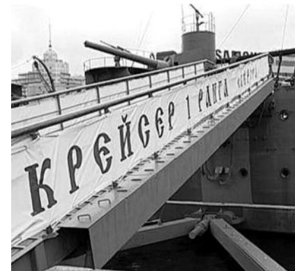
■ НА ФОТО: РАСПРАВА НАД «АВРОРОЙ»

Ольга Архиповна отметила, что 7 ноября коммунисты из северной столицы намерены закончить праздничное шествие именно у «Авроры»: