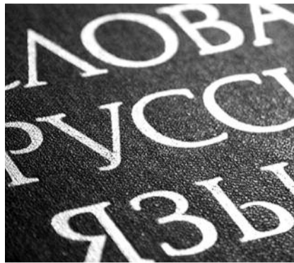
● НА ФОТО: НАША НАСУЩНАЯ ЗАДАЧА — СДЕЛАТЬ НАШУ РЕЧЬ ЧИСТОЙ И КРАСИВОЙ

(запреты) на подобные слова. Сквернословие есть скверна души, гордыня плоти, ведущая к духовному вырождению и искривлению своего «я». Сегодня некоторые люди, чьи имена на слуху, пытаются узаконить мысль, что мат — глубоко русская традиция, национальная особенность и даже гордость народа. Эти невежды совершенно не знают истории, а пытаются перед собой и другими оправдать свой порок.