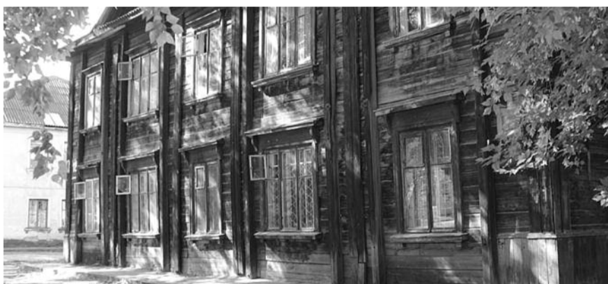
● НА ФОТО: В НОВОСИБИРСКЕ 1574 АВАРИЙНЫХ, ВЕТХИХ ДОМОВ