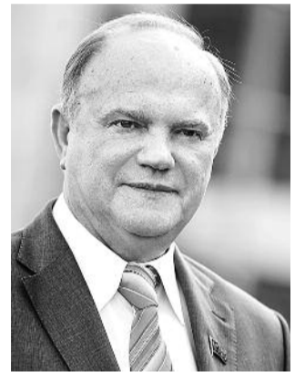
● НА ФОТО: ЛИДЕР КПРФ

Вечером 14 октября, после закрытия избирательных участков в Единый день голосования, в Центральном избирательном штабе КПРФ состоялась пресс-конференция лидера Компартии Геннадия ЗЮГАНОВА .