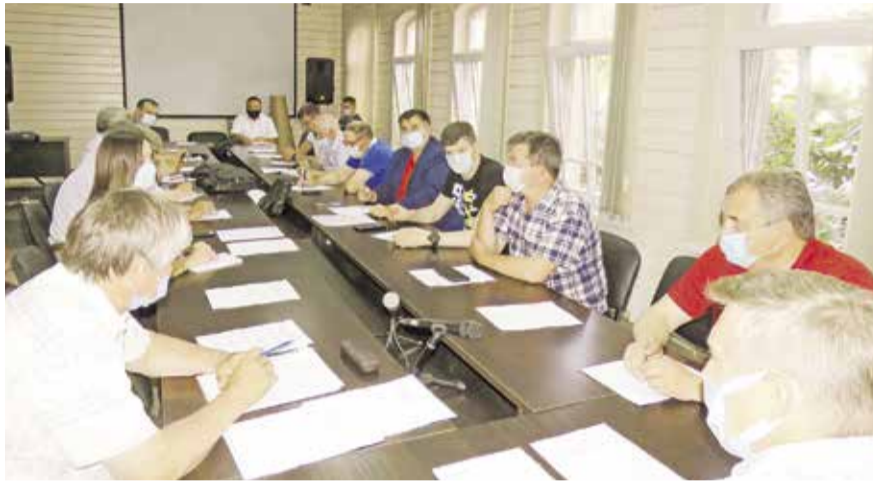
НА ФОТО: ЗАСЕДАНИЕ БЮРО НОВОСИБИРСКОГО ОК КПРФ