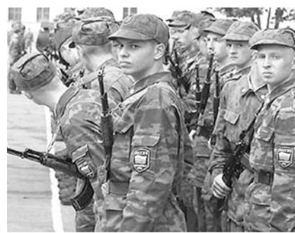
● НА ФОТО: НАША АРМИЯ ИСЧЕЗАЕТ...