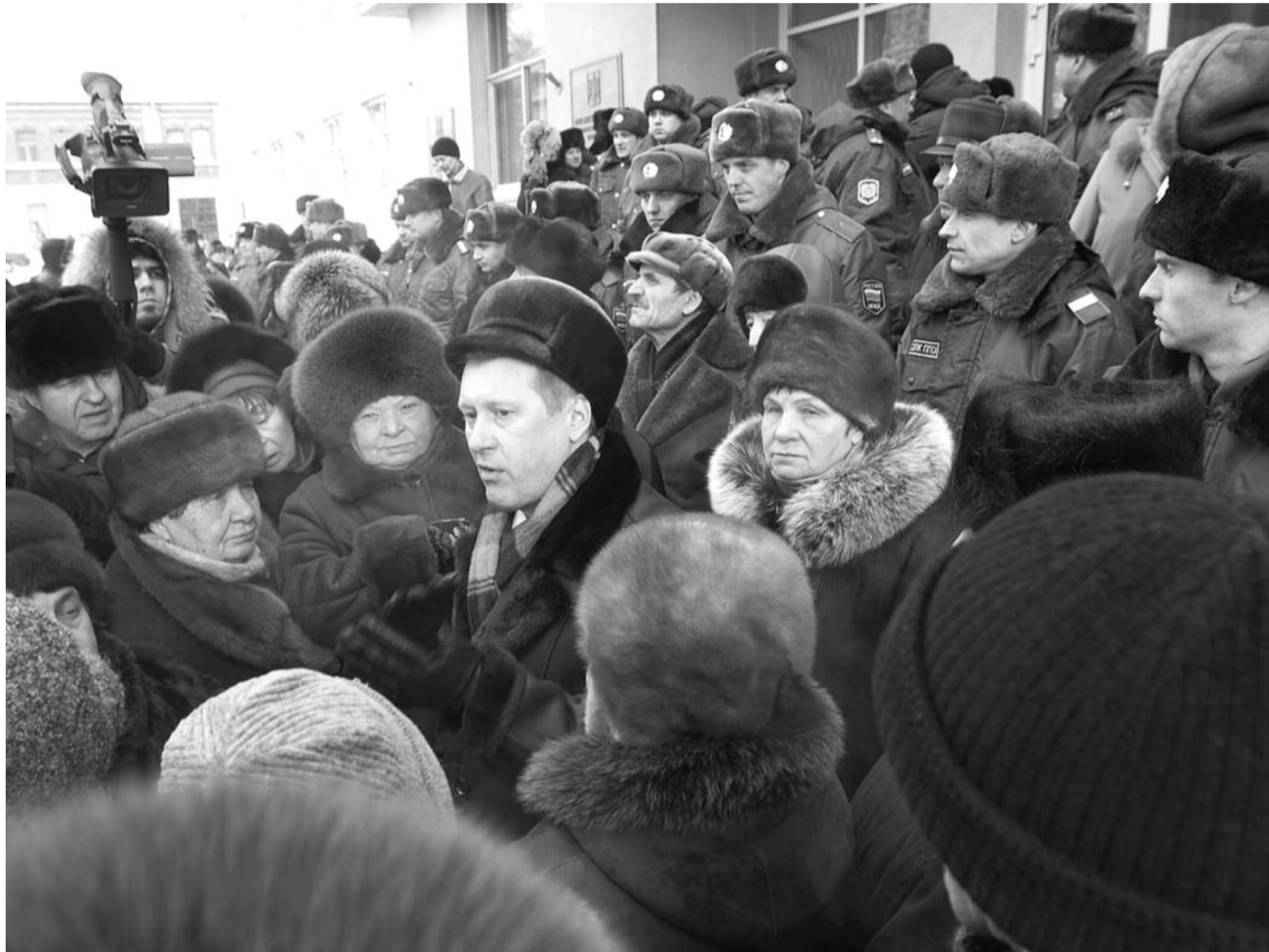
● НА ФОТО: АНАТОЛИЙ ЛОКОТЬ ОБЩАЕТСЯ С ЛЬГОТНИКАМИ, ОРГАНИЗОВАВШИМИ ПИКЕТ У ЗДАНИЯ ОБЛАДМИНИСТРАЦИИ 29 ДЕКАБРЯ 2010 ГОДА