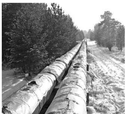
● НА ФОТО: ЭТА ТЕПЛОТРАССА НЕ ВЫДЕРЖИВАЕТ УЖЕ НИКАКИХ МОРОЗОВ...