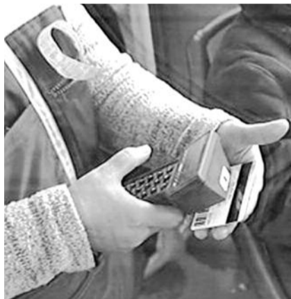
● НА ФОТО: ПОСЛЕ ПРАЗДНИКОВ У БОЛЬШИНСТВА ЛЬГОТНИКОВ НЕ ОСТАЛОСЬ ПЕЗДОК

Напомним, что вопрос с льготой на проезд остался нерешенным в 2010 году. В ответ на постановление губернатора о лимитировании количества льготных поездок состоялось несколько мощных акций протеста. Одна из акций даже закончилась в стенах мэрии Новосибирска. В Законодательном собрании коммунисты инициировали проведение внеочередной сессии с вопросом по льготам, но депутаты «единогласно» и «справороссы» инициативу не поддержали. На сессии городского Совета руководитель