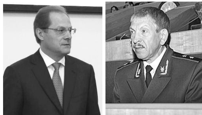
● НА ФОТО: ГУБЕРНАТОР ЮРЧЕНКО ПРОТИВ ПРОКУРОРА ОВЧИННИКОВА

Напомним, что фракция КПРФ в Горсовете обратилась в прокуратуру с просьбой рассмотреть законность действий губернатора ЮРЧЕНКО , повлекших за собой рост социальной напряженности. Прокурор направил протест с изложением списка нарушений закона в данном постановлении, в ответ на который губернатор сообщил, что «принимал постановление в соответствии с действующим законодательством в пределах полномочий».