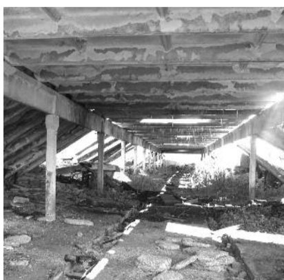
● НА ФОТО: ДЕЙСТВУЮЩИХ ХОЗЯЙСТВ В МОШКОВСКОМ РАЙОНЕ ПОЧТИ НЕ ОСТАЛОСЬ

Выступил на собрании хорошо известный в районе депутат Госдумы, член Президиума ЦК КПРФ Николай ХАРИТОНОВ. Он отметил, что сегодня район