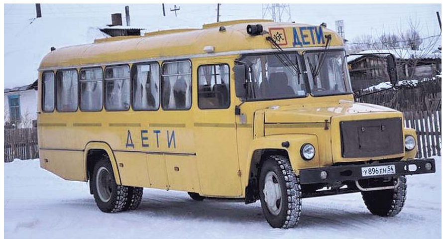
НА ФОТО: КОНТРОЛЬ ЗА ТРАНСПОРТОМ, ПЕРЕВОЗЯЩИМ ДЕТЕЙ, ДОЛЖЕН БЫТЬ УСИЛЕН

На прошлой неделе в Барабинском районе произошло ДТП с участием автобуса Устьянцевской средней школы, перевозившего учащихся. Автобус загорелся, когда водитель, высадив детей, отъехал на несколько метров. К счастью, никто не пострадал.