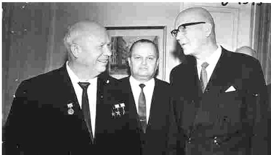
НА ФОТО: НИКИТА ХРУЩЕВ И УРХО КЕККОНЕН В НОВОСИБИРСКЕ

— Ни один из нас не мог представить себе масштабов и научного значения этого города, — делился финский президент впечатлениями об Академгородке в интервью «Советской Сибири». — Это удивительно: некоторые институты еще только строятся, а научные исследования ведутся полным ходом. Наука идет вперед. Чувствуется энтузиазм всех: тех, кто трудится в лабораториях, работает на строитель-