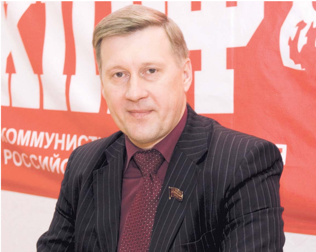
НА ФОТО: МЭР НОВОСИБИРСКА, ПЕРВЫЙ СЕКРЕТАРЬ НОВОСИБИРСКОГО ОБКОМА КПРФ АНАТОЛИЙ ЛОКОТЬ