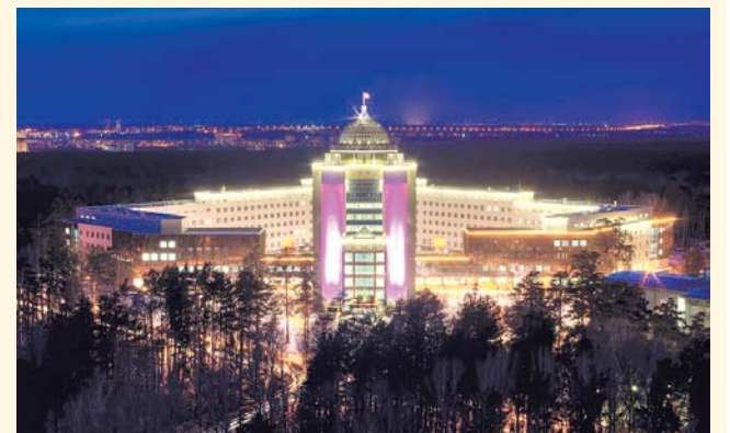
НА ФОТО: НОВЫЙ КОРПУС НГУ