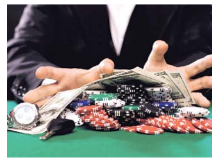
НА ФОТО: ИДУ ВА-БАНК!

« ПРОЙТИ ЧЕРЕЗ ГОРНИЛО » — значит пройти через многие ис-