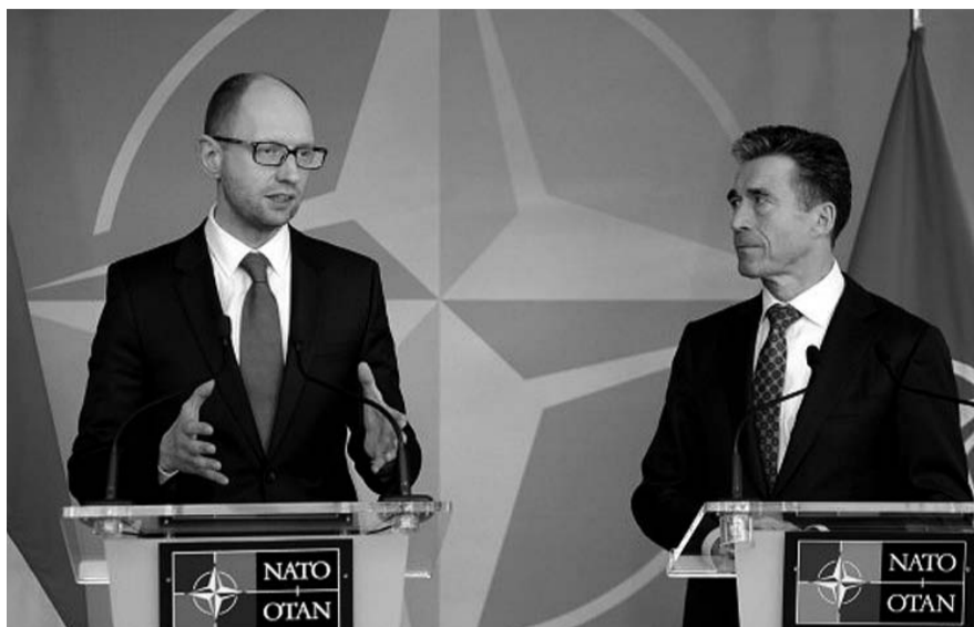
НА ФОТО: АРСЕНИЙ ЯЦЕНЮК (СЛЕВА) И ЙЕНС СТОЛТЕНБЕРГ

В то же время посыл Столтенберга не вполне укладывается в контекст того, что еще совсем недавно заявляли высокопоставленные представители стран-членов НАТО. В частности, глава МИД Польши Гжегож СХЕТЫНА ,