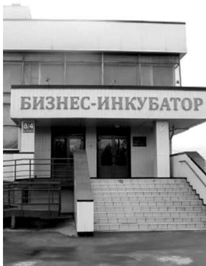
НА ФОТО: В НОВОСИБИРСКЕ ДЛЯ БИЗНЕСА СОЗДАНЫ КОМФОРТНЫЕ УСЛОВИЯ

Таковы выводы участников заседания «круглого стола», завершившего во вторник, в День российского предпринимательства, масштабную серию презентаций существующих форм поддержки бизнеса, инфраструктуры, внешнеэкономических возможностей развития бизнеса. Неделю предпринимательства организовал Комитет поддержки и развития среднего и малого предпринимательства мэрии города Новосибирска.