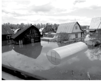
НА ФОТО: ДАЧИ ЗАТОПЛЕНЫ

По словам заместителя мэра Новосибирска Данияра САФИУЛЛИНА , для того, чтобы минимизировать риск затопления и последствия стихии, не-