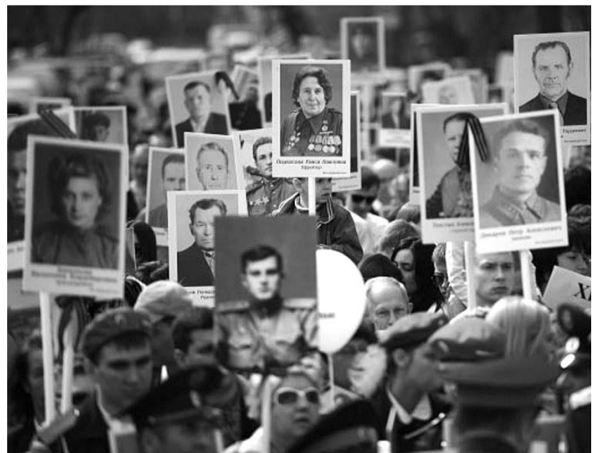
НА ФОТО: БЕССМЕРТНЫЙ ПОЛК В НОВОСИБИРСКЕ