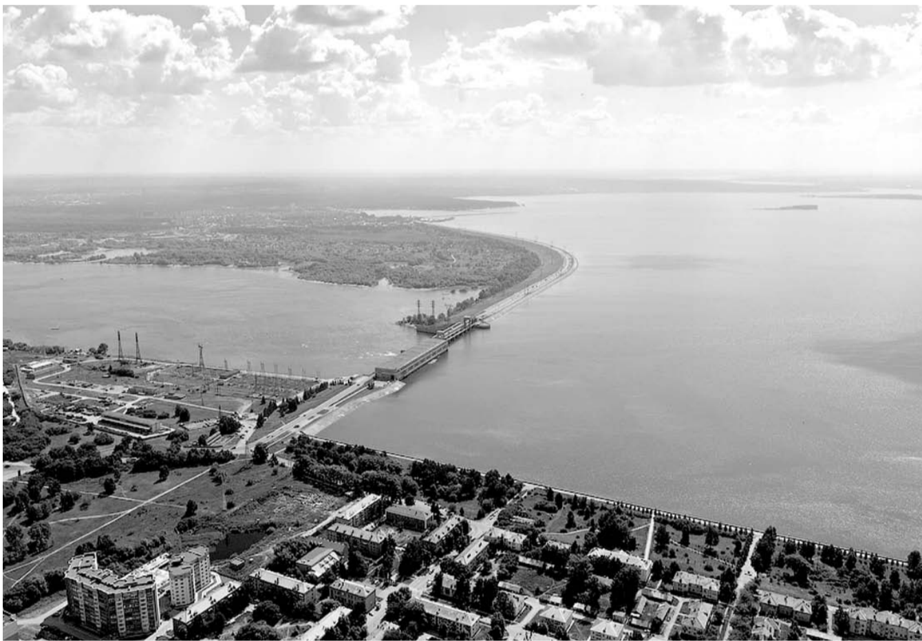
НА ФОТО: НОВОСИБИРСКОЕ ВОДОХРАНИЛИЩЕ