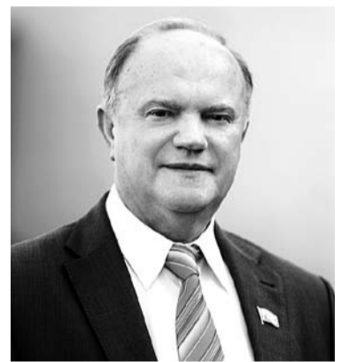
НА ФОТО: ГЕННАДИЙ ЗЮГАНОВ

25 мая Председатель ЦК КПРФ Геннадий ЗЮГАНОВ выступил в Госдуме на открытии выставки «Выдающиеся предприниматели и меценаты России».