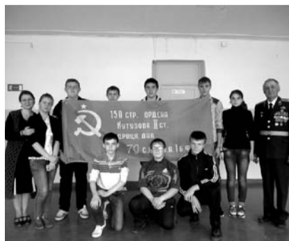
НА ФОТО: 8 КЛАСС

— Сегодня народное голосование. Увидел плакаты-призывы в центре. Решил сходить на участок из любопытства. Поток желяющих, для себя отмечаю, если по учительской оценке, на троечку. Посмотрел на людей, у знакомых поинтересовался настроением. Скажу так: настроение не очень