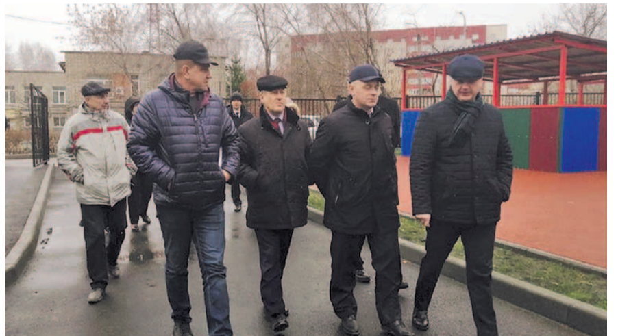
НА ФОТО: СТРОЯТ ТОЧНО В СРОК — МЭР УБЕДИЛСЯ В ЭТОМ САМ

Детский сад на ул. Чехова, 198 один из новых, но история у него длинная. Долгое время здесь находилось старое здание садика, построенное еще заводом «Электросигнал». Заброшенный объект, который представлял опасность для горожан, был снесен, и на его месте построили современное учреждение дошкольного образования.