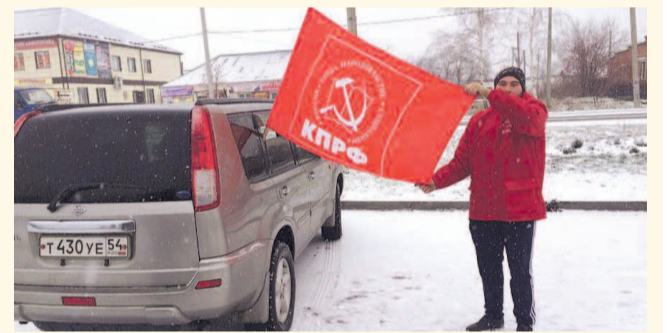
НА ФОТО: АВТОПРОБЕГ В МОШКОВСКОМ РАЙОНЕ