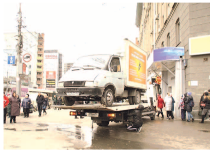
НА ФОТО: ПЛОЩАДЬ КАЛИНИНА — ЭТО НЕ ВОСТОЧНЫЙ БАЗАР

— Такие рейды мы проводим регулярно, но торговцы, получив штрафы, вновь встают за прилавки. Необходимо менять закон, чтобы раз и навсегда искоренить эти стихийные рынки по всему городу. Недобросовестные предприниматели чувствуют свою безнаказанность. Необходимо менять фе-