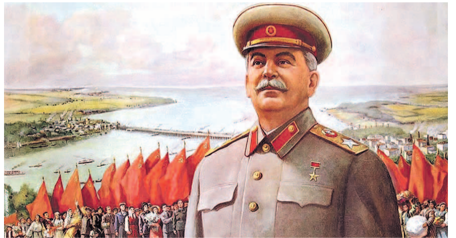
НА ФОТО: СТАЛИН ПЛАНОВЕРНО ВЕЛ ПОЛИТИКУ РАЗВИТИЯ И УКРЕПЛЕНИЯ СТРАНЫ

Исторически соборность, особенно в России, — одно из главных духовных условий национального единства и создания мощной державы, каковым был Советский Союз.