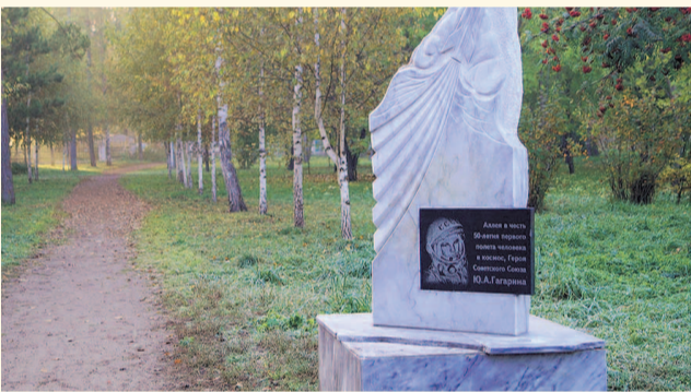
НА ФОТО: ЗА СКВЕРОМ УЖЕ МНОГО ЛЕТ НИКТО НЕ УХАЖИВАЛ