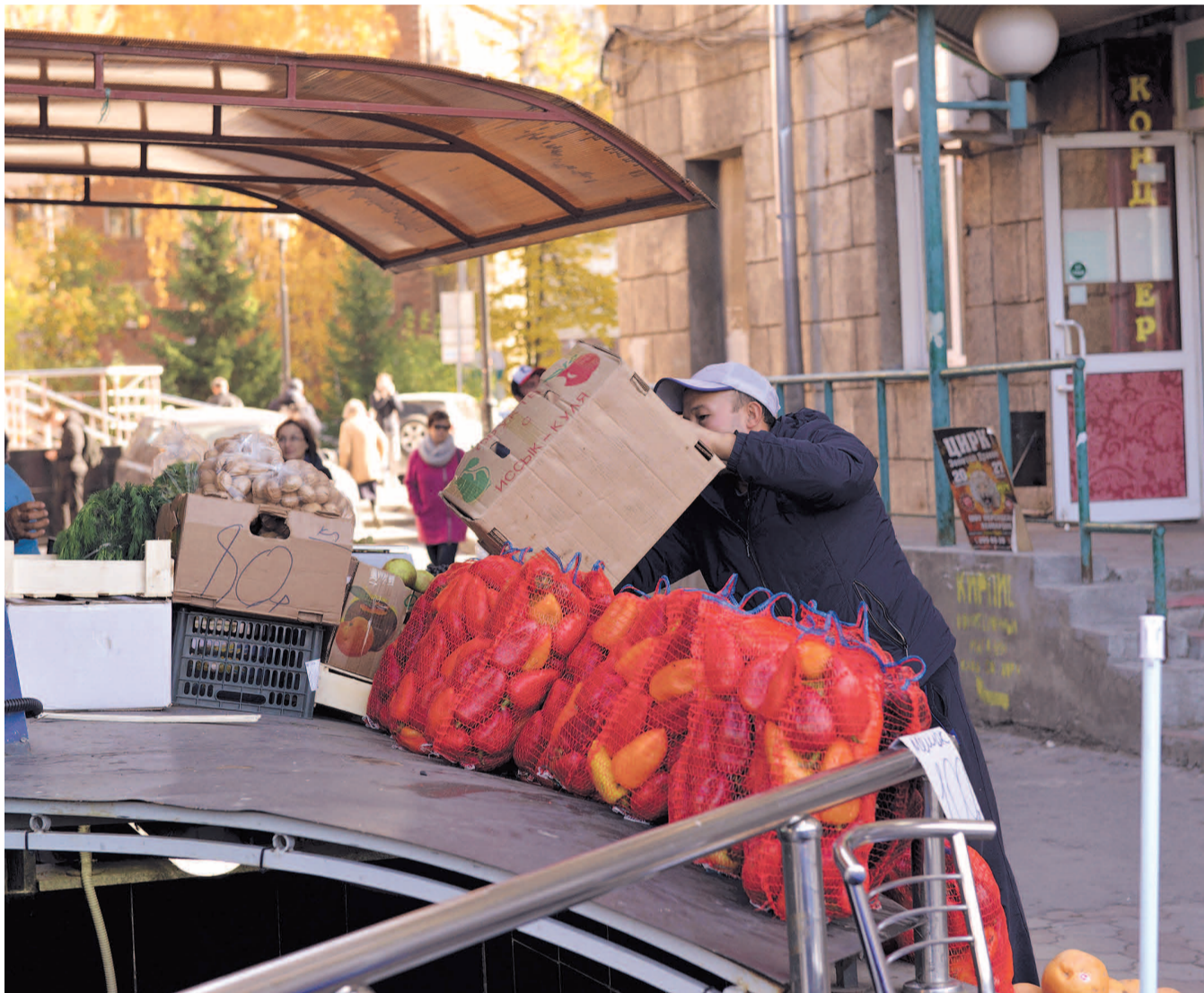
НА ФОТО: ТОРГОВЦЫ-НЕЛЕГАЛЫ УЙДУТ С ПЛОЩАДИ КАЛИНИНА