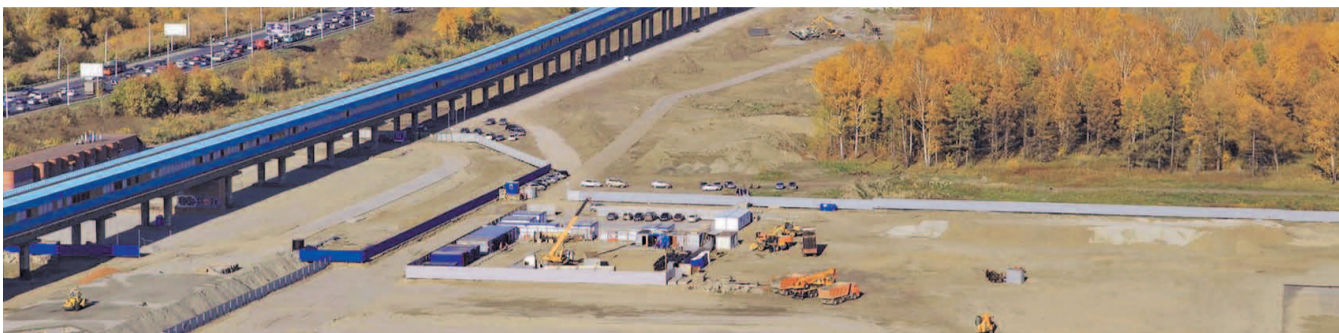
НА ФОТО: ИДУТ РАБОТЫ ПО СТРОИТЕЛЬСТВУ НОВОЙ СТАНЦИИ МЕТРО

— Правительство РФ гарантировало взять на себя часть расходов на это строительство, — комментирует ситуацию