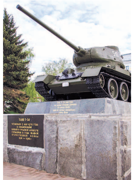
НА ФОТО: СОЛДАТ ПОБЕДЫ

Многие не знают, почему именно «тридцатьчетверка?» Будучи на стажировке в Ленинграде в танковом КБ, Михаил Кошкин письменно обратился к первому секретарю Ленинградского обкома Сергею КИРОВУ , предложив улучшить конструкцию танков. Их встреча состоялась в 1934 году, за несколько месяцев до гибели Сергея Мироновича , который оценил идею молодого конструктора. Михаил Кошкин помнил год знаменательной встречи, когда уже был главным конструктором