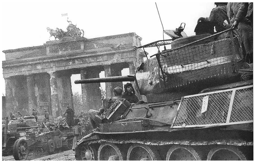
НА ФОТО: У БРАНДЕНБУРГСКИХ ВОРОТ

Т-34 — самый известный советский танк и один из символов Второй мировой войны. Он посеял «танкобоязнь» в фашистских войсках. Они были удивлены появлением на фронтах неизвестного высокоэффективного бронетанкового оружия. Т-34 вселял в наших солдат веру в победу и гордость за превосходство советского оружия над оружием противника. За время войны на наших заводах было выпущено почти 36 000 «тридцатьчетверок». Его мо-