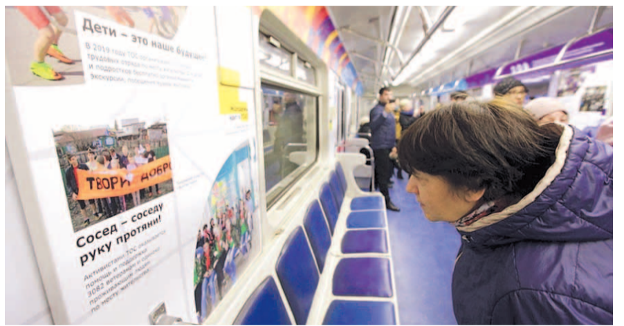
НА ФОТО: ДОБРЫЕ ДЕЛА И ЛЮДИ ГОРОДА ДОЛЖНЫ БЫТЬ ИЗВЕСТНЫ

Градоначальник уверен, что новая экспозиция позволит по-новому взглянуть на какие-то проблемы и события, которые происходят в городе. Он уверен, что горожане начнут активнее вовлекаться в общественную жизнь Новосибирска.