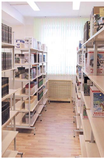
НА ФОТО: БИБЛИОТЕКА НОВОЙ ШКОЛЫ

Здесь создана безбарьерная среда для учеников с ограниченными возможностями здоровья: удобная входная зона, лифт, специальные парты, туалеты. В холлах и рекреациях установлены информационные табло.