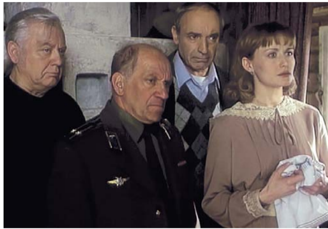
НА ФОТО: КАДР ИЗ ФИЛЬМА «СИРОТА КАЗАНСКАЯ»

Заканчивается 2016-й — год советского кино. Какой бы фильм хотелось посоветовать читателям в канун Нового года? Можно было бы, конечно, рассказать, как снимались Э. РЯЗАНОВЫМ, например, «Ирония судьбы» или «Карнавальная ночь», но это как непременно салат «Оливье».