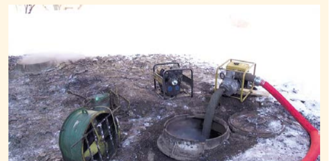
НА ФОТО: ВЕДУТСЯ ВОССТАНОВИТЕЛЬНЫЕ РАБОТЫ