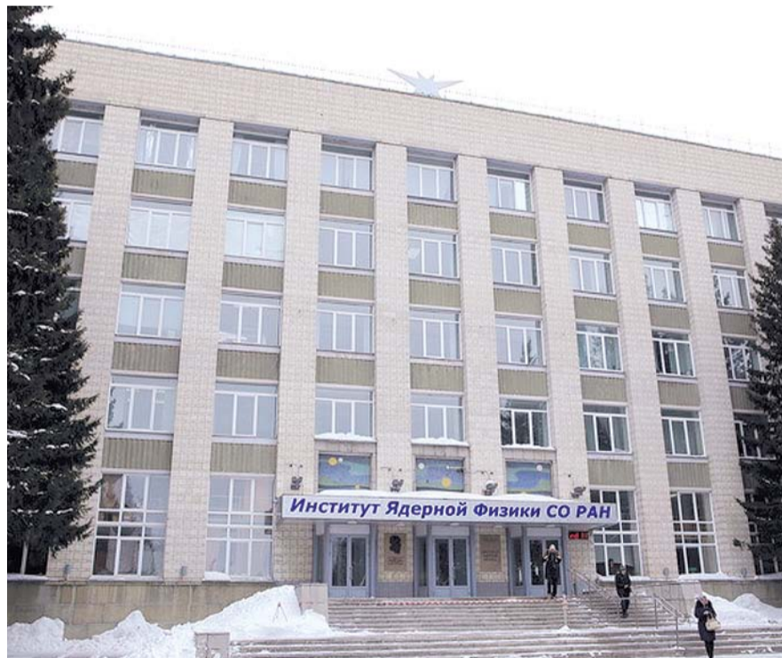
НА ФОТО: НА НАУКУ ДЕНЕГ НЕТ, ХВАТАЕТ ТОЛЬКО НА АРМИЮ И ЧИНОВНИКОВ

Ранее академик, доктор наук, заместитель Председателя СО РАН Ни-