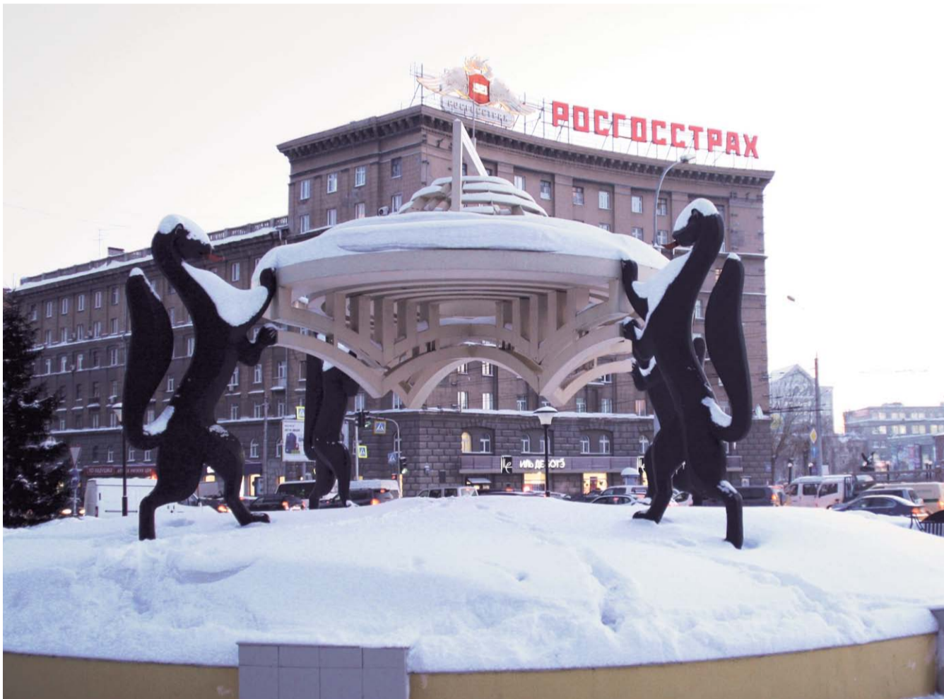
НА ФОТО: ЗАВЕРШАЕТСЯ ЕЩЕ ОДИН ГОД. ЧЕМ ОН ЗАПОМНИЛСЯ НОВОСИБИРСКУ?