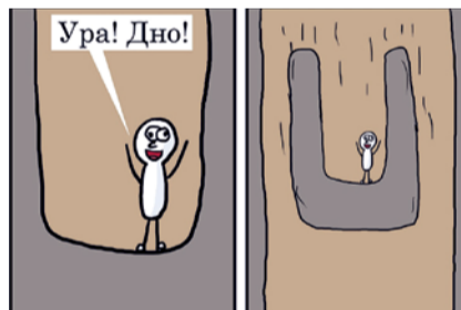
НА ФОТО: ДНО ДОСТИГНУТО?

По данным Credit Suisse за период с середины 2015 по середину 2016 года россияне вошли в тройку аутсайдеров по показателю благосостояния населения, которое упало на 15%. Отмена индексации пенсий работающим пенсионерам, замена ее единовременной выплатой в 5000 рублей и первый отказ от индексации материнского капитала не добавили россиянам оптимизма. Недаром одним из самых