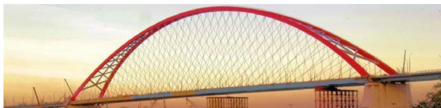
НА ФОТО: ДЕПУТАТЫ УВЕРЕНЫ — ГОРОД ОПЛАТИЛ СТРОИТЕЛЬСТВО МОСТА СПОЛНА

— Политические оценки этому решению мы уже давали, очевидно, здесь прослеживается конфликт интересов коммерческой структуры и бюджета города, соответственно, и интересов всех жителей города Новосибирска. Но есть юридическая сторона этого