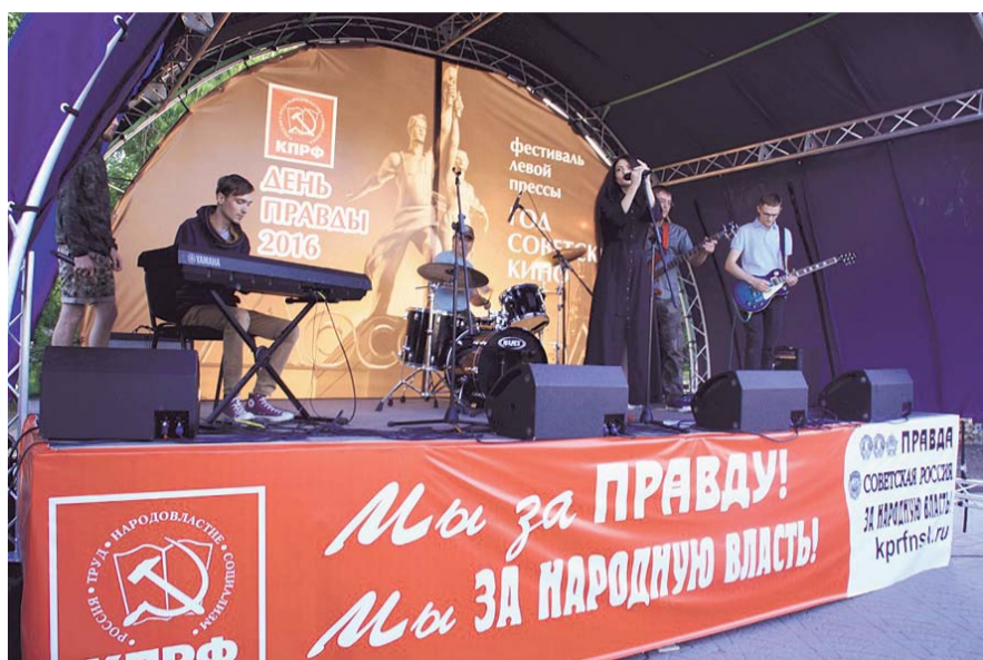
НА ФОТО: ГРУППА «КРУТЫЕ ТАНКИ» НА СЦЕНЕ «ДНЯ ПРАВДЫ»

Всего в автопробеге приняли участие более 100 машин и 1000 человек.