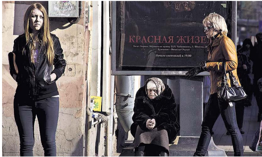
НА ФОТО: ЛИШЬ 5% РОССИЯН ОТМЕТИЛИ УЛУЧШЕНИЕ СВОЕГО ЭКОНОМИЧЕСКОГО СОСТОЯНИЯ

Надо отметить, что такие опросы проводились «Левада-Центром» не первый год, их ретроспектива позволяет определить некоторые закономерности. Так, 40% респондентов отметили ухудшение работы учреждений здравоохранения — больниц, поликлиник — в 2016 году, и только 9% заметили какие-то улучшения. Для сравнения, один из первых опросов по данной теме проводился еще в 1988 году, когда существовал Советский Союз, и тогда вариант «стало хуже» выбрали всего 18%. Интересно, что 12% советских граждан отметили улучшение работы