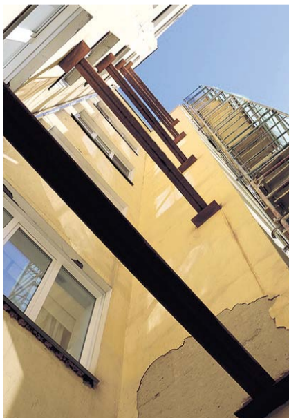
НА ФОТО: КАПРЕМОНТ НАБИРАЕТ ОБОРОТЫ

Но тем компаниям, которые готовы включиться в программу капремонта и участвуют в конкурсе, власти стараются идти навстречу. Например, по согла-