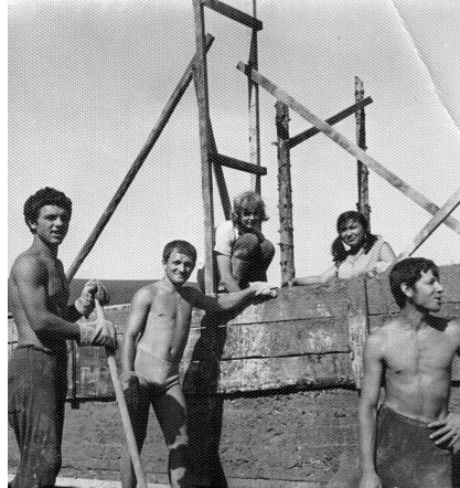
НА ФОТО: СТРОЙОТРЯД НГУ В БОЛЬШОЙ БЕРЕЗОВКЕ АЛТАЙСКОГО КРАЯ, ЛЕТО 1968 ГОДА

— Я четыре года во время учебы в НЭТИ состоял в оперативно-ком-