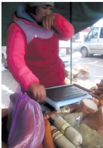
НА ФОТО: РЕАЛЬНОСТЬ И ТО, КАК ДОЛЖНА БЫТЬ ОРГАНИЗОВАНА ТОРГОВЛЯ

Впрочем, как оказалось, опасность на местном рынке может ожидать покупателей не только при покупке продуктов: въезд на территорию рынка администрация оборудовала цепью, за которую загнулась пожилая покупательница. В результате падения