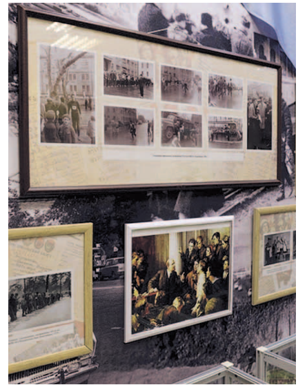
НА ФОТО: ИСТОРИЯ В ФОТОГРАФИЯХ

— Моя жизнь с комсомолом связана неразрывно, потому что сама обстанов-