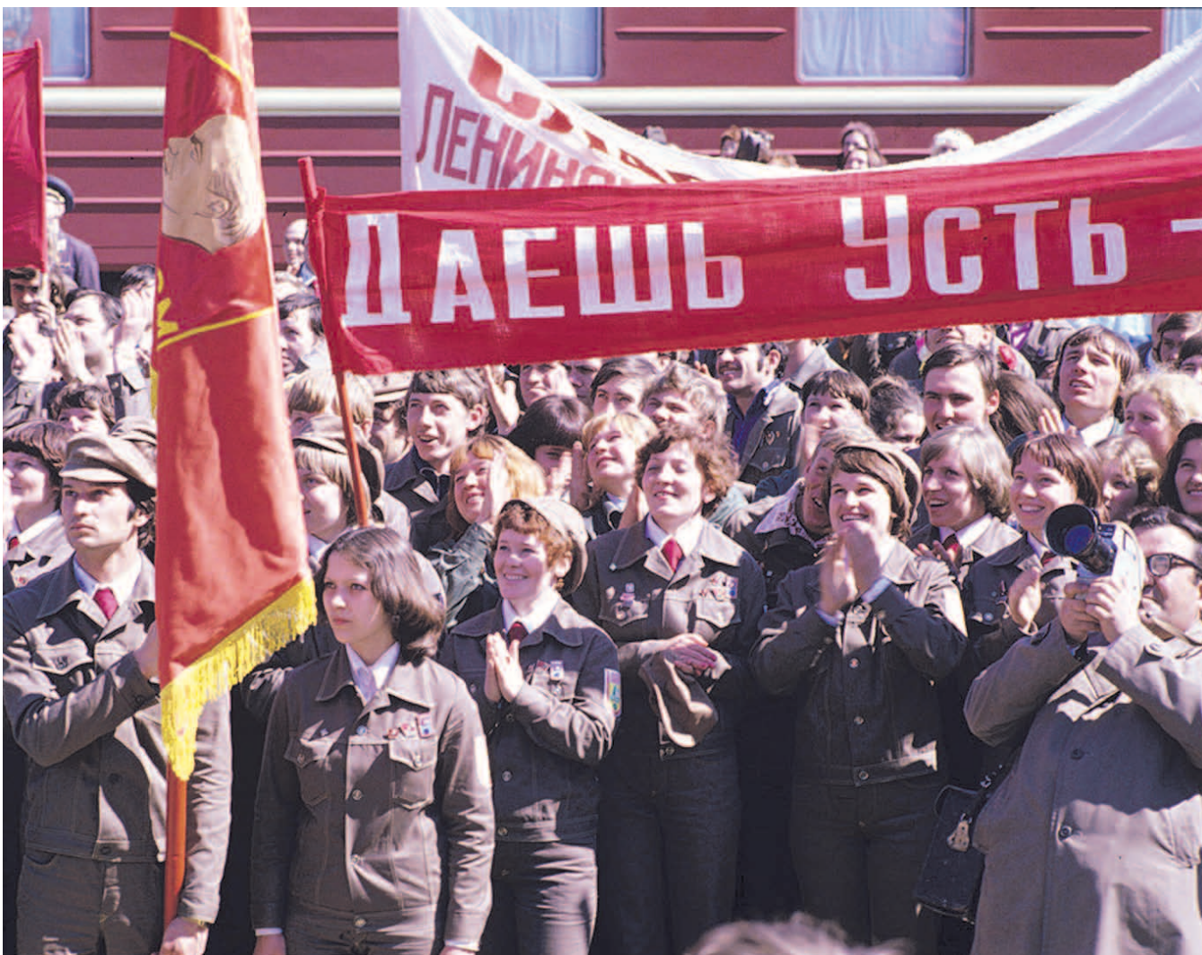
НА ФОТО: УЖЕ 100 ЛЕТ МОЛОДЫЕ ЛЮДИ ВЫХОДЯТ В БОЛЬШУЮ ЖИЗНЬ ЧЕРЕЗ КОМСОМОЛЬСКИЕ ОТРЯДЫ