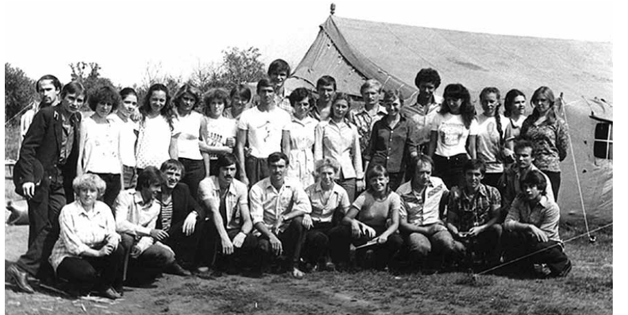
НА ФОТО: СТУДЕНЧЕСКИЙ ОТРЯД ЖЕЛЕЗНОДОРОЖНОГО РК ВЛКСМ НА ЗАГОТОВКЕ КОРМОВ В КОЛЫВАНСКОМ РАЙОНЕ, ИЮНЬ 1983 ГОДА

— Мы разнимали различные драки, в том числе коллективные — один раз пришлось разнимать драку таксистов возле ресторана, мы активно сотрудничали не только с милицией, но и с уголовным розыском, с ОБХСС, нас даже привлекали к мероприятиям, проводимым КГБ в отношении некоторых гостей, приезжающих к нам в страну, на Гусинобродской барахолке работали по спекулянтам.