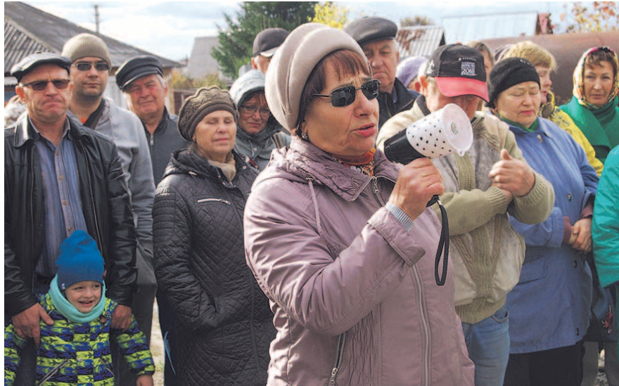
НА ФОТО: и дачи, и жилой комплекс готовы принести в жертву дороге

тив строительства собрал небывалое число участников: выразить свой протест собралось несколько сотен человек. Протестующие не ограничились требованием отменить решение о строительстве дороги через СНТ «Тихие зори», но и высказались против строительства моста как такового. Пенсионеры заявили, что все это — лишь способ избавиться от садового общества, чтобы освободить территорию для последующей застройки элитными коттеджами.