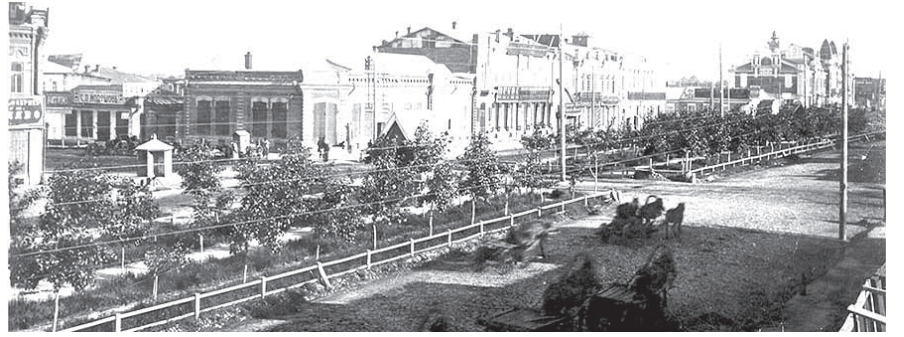
НА ФОТО: НИКОЛАЕВСКИЙ ПРОСПЕКТ НАЧАЛА ХХ ВЕКА

К июлю 1946 г. областная Организация комсомольцев насчитывала в своих рядах 75967 комсомольцев, из них — 49083 женщины.