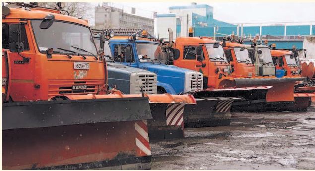
НА ФОТО: СНЕГОУБОРОЧНАЯ ТЕХНИКА ГОТОВА К РАБОТЕ!

Вся техника в новосибирских ДЭУ уже переоборудована и готова к борьбе со снегом на улицах города. Синоптики