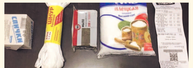
НА ФОТО: ПОДАРОК СТОИМОСТЬЮ 89 РУБЛЕЙ

19 октября пенсионерка передала министру труда и социального развития Новосибирской области Ярославу ФРОЛОВУ «подарочный набор» на сумму прибавки к прожиточному минимуму, которая составит 89 рублей. В набор вошли мыло, бельевая веревка, спички и пачка соли.