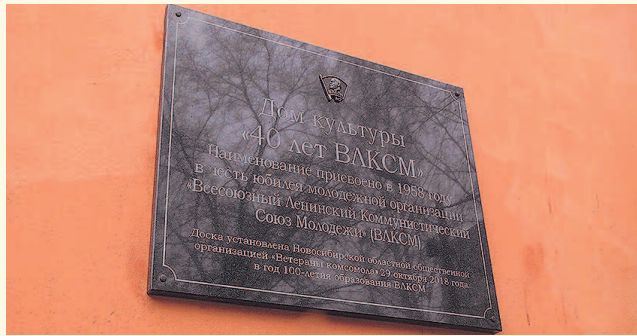
НА ФОТО: ЗА ПАМЯТНОЙ ДОСКОЙ — ПИСЬМО В БУДУЩЕЕ

Церемония закладки капсулы с посланиями, адресованными комсомольцам будущего, прошла в воскресенье в Первомайском районе города Новосибирска в рамках празднования 100-летия образования ВЛКСМ. В капсулу положили послание, написанное сегодняшними комсомольцами: