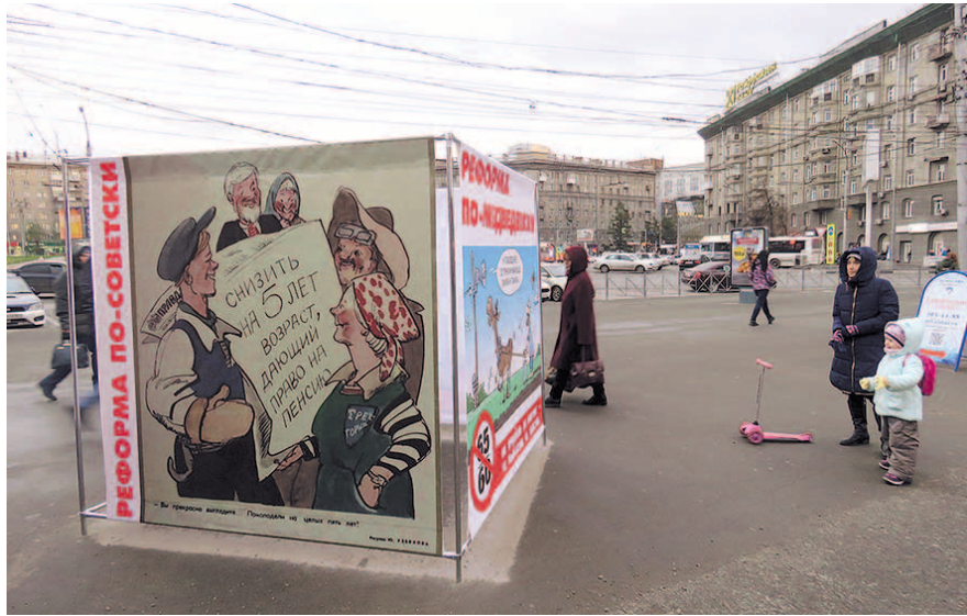
НА ФОТО: КПРФ ПРОДОЛЖАЕТ ПИКЕТЫ ПРОТИВ ПЕНСИОННОЙ РЕФОРМЫ