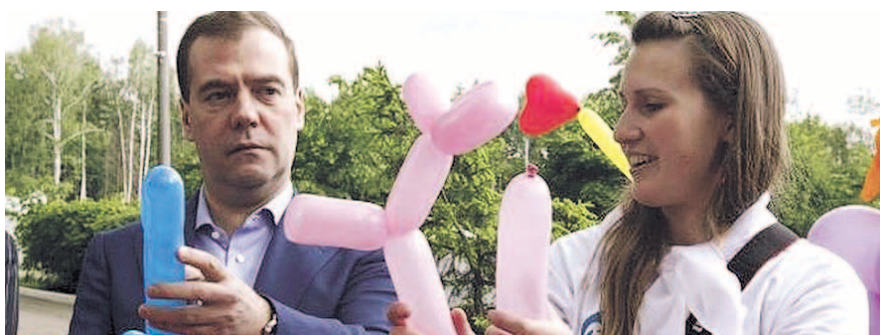
НА ФОТО: ДАЖЕ ЭТО ПРЕМЬЕРУ НЕ УДАЕТСЯ!

Россия по росту ВВП отстала даже от Киргизии