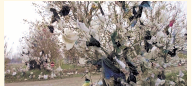
НА ФОТО: «ЦВЕТЫ» НА ДЕРЕВЬЯХ