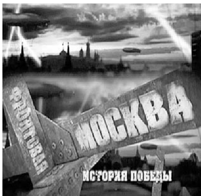
НА ФОТО: ИСТОРИЮ ОПЯТЬ ПЕРЕПИСАЛИ

Ведущий и комментаторы-«историки» излагают свою версию событий наступательной операции фашистских войск на Москву в сентябре — ноябре 1941 года. Почему «историки» в кавычках? Потому, что это никому не известные молодые люди, объявившие себя историками, но произносящие с экрана либо довольно банальные вещи, либо очевидные глупости. Обильно снабженный документальными кадрами как Советской, так и Германской кинохроники того времени фильм, по мысли режиссера, должен воссоздать объективное освещение событий трагических для нашей Родины осенних месяцев 1941 года. И сначала трудно уловить грань между освещением событий и вымыслом, предназначенным для искажения роли СТАЛИНА, Генерального штаба в руководстве военными действиями войск на Западном направлении. Вот как описывает ведущий наступление фашистских войск, и причины окружения трех советских армий под Вязьмой и Смоленском. Все дело в том, по мнению авторов фильма, что советские военачальники были так запуганы и терроризированы сталинским режимом, что не могли и не имели права принимать любое самостоятельное решение, и действовали только, по прямому указанию Ставки (Сталина). Лишенные возможности принимать решения, военачальники обреченно наблюдали гибель войск. Отсюда и все трагедии, случившиеся в осенние месяцы 1941 года на советско-