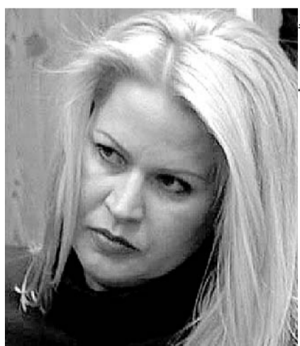
НА ФОТО: ОСНОВНАЯ ФИГУРАНТКА ДЕЛА

Подчиненная Васильевой «и по совместительству ее близкая подруга»,