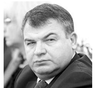
НА ФОТО: НЕПОДСУДНЫЙ ЭКС-МИНИСТР

На пленарном заседании Госдумы заместитель председателя фракции КПРФ Анатолий ЛОКОТЬ призвал депутатов начать парламентское расследование в отношении экс-министра обороны Анатолия СЕРДЮКОВА.