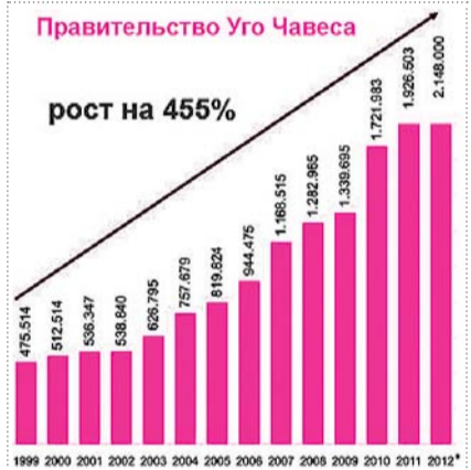
ДИАГРАММА: КОЛИЧЕСТВО ПЕНСИОНЕРОВ В ВЕНЕСУЭЛЕ С 1999 ПО 2012 ГОДЫ

Отправной точкой периода перемен стал 1999 год, когда Уго ЧАВЕС впервые победил на президентских выборах. Венесуэла в этот период находилась в состоянии затяжного социального кризиса: 9,3 млн бездомных, 43,9% населения находилось за чертой бедности, а 17,1% в состоянии нищеты, уровень детской смертности — 23 ребенка на каждую тысячу родившихся, 15% безработных, 59,6% — инфляция, 55% экономической активности относилось к «теневому»