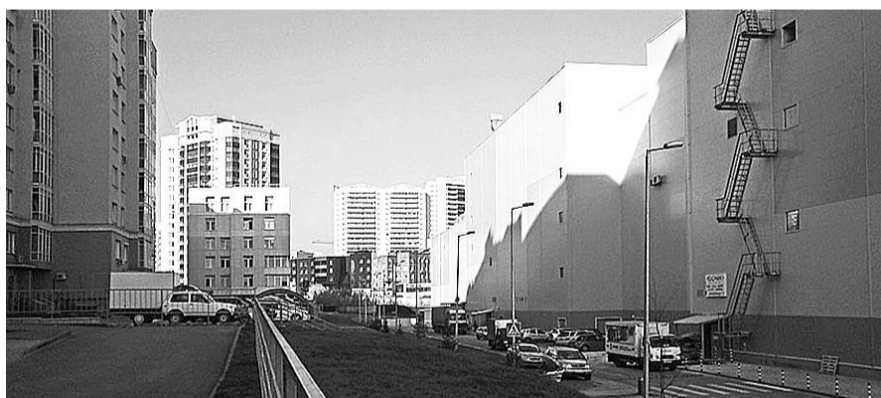
НА ФОТО: «АУРА» ПЕРЕКРЫЛА ГОРИЗОНТ, ЛИШИВ УЛИЦУ М.ГОРЬКОГО ПЕРСПЕКТИВЫ

А по улице Семьи Шамшиных, как грибы после дождя, выросли 15-17-этажные «домины». Застроен каждый квадратный метр. Кажется, что у градостроителей не было ни плана, ни проектов застройки. Все бессистемно и хаотично. Зелени здесь нет, дворы вообще отсутствуют, есть только проезды для машин, парковок тоже нет. Еще одна высотка с сигнальными