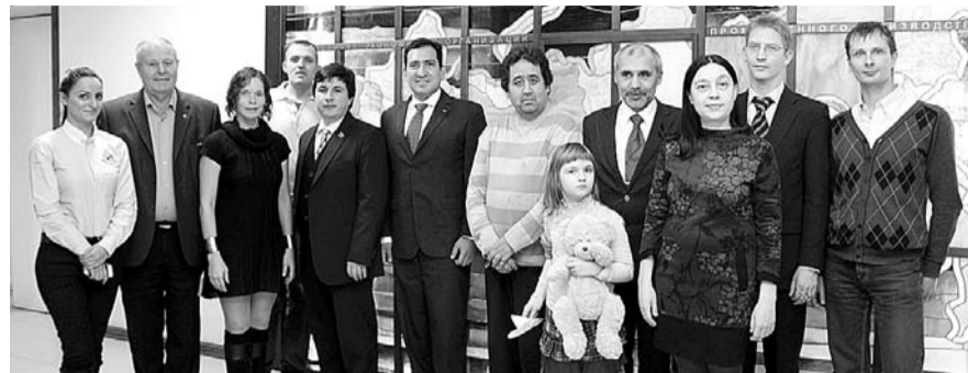
НА ФОТО: ДЕЛЕГАЦИЯ ПОСОЛЬСТВА ВЕНЕСУЭЛЫ В НОВОСИБИРСКОМ АКАДЕМГОРОДКЕ

сектору. При этом крайне низкий уровень социальной защищенности. Только 10% населения имела медицинскую страховку, тогда как 70% населения не проходило никакого медицинского осмотра. На этом фоне достигнутые за последние 13 лет показатели представляются более чем впечатляющими. Обратимся к цифрам.