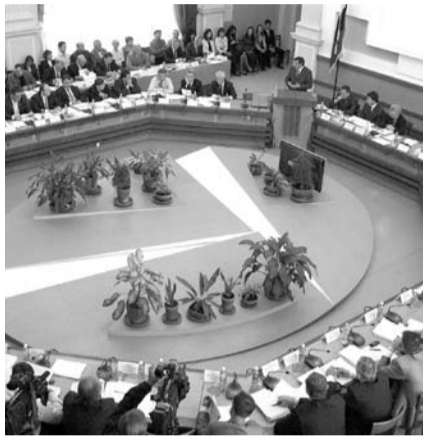
НА ФОТО: СЕССИЯ ГОРОДСКОГО СОВЕТА

На сессии Горсовета депутаты приняли решение о назначении общественных слушаний, где будут обсуждаться поправки, отменяющие смешанную систему выборов в Совет депутатов города Новосибирска.