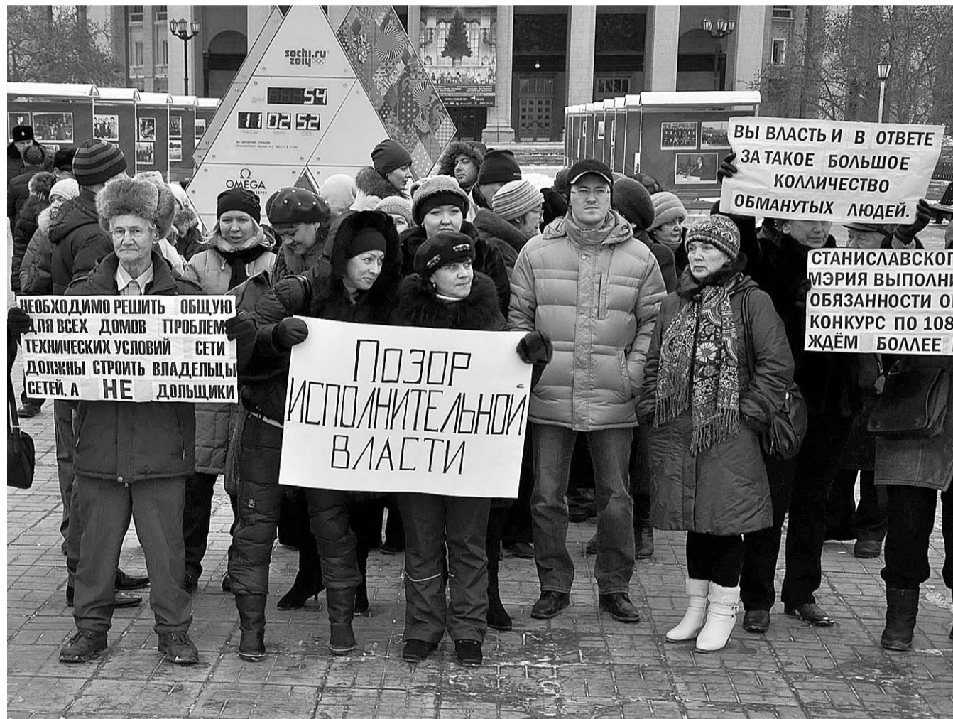
НА ФОТО: УЧАСТНИКИ МИТИНГА ОБМАНУТЫХ ДОЛЬЩИКОВ НА ПЛОЩАДИ ЛЕНИНА