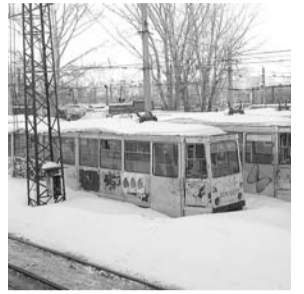
НА ФОТО: ИМУЩЕСТВО «ГОРЭЛЕКТРОТРАНСПОРТА» РАСПРОДАЛИ ЗА ДОЛГИ