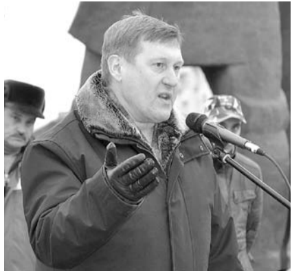
НА ФОТО: АНАТОЛИЙ ЛОКОТЬ НА МИТИНГЕ

Неоднократные обращения к власти о наших проблемах заканчиваются