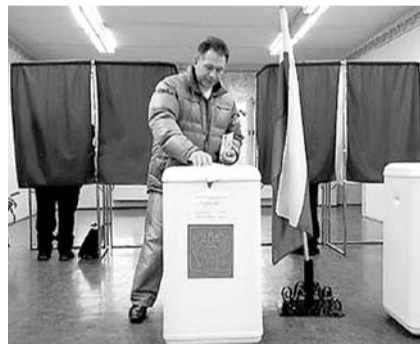
НА ФОТО: КАК В ПОСЛЕДНИЙ РАЗ

В настоящее время власть присматривается к ситуации и старается спрогнозировать, как воспримет общество новую идею. Судя по реакции в интернете, общество восприняло ее в