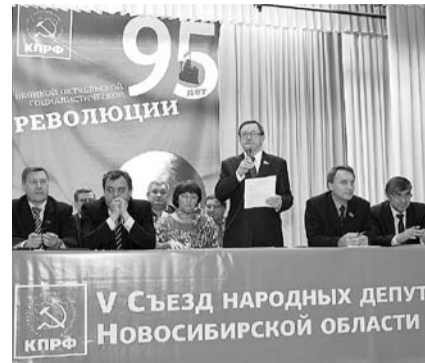
НА ФОТО: ПРЕДЫДУЩИЙ СЪЕЗД ДЕПУТАТОВ СОСТОЯЛСЯ 5 НОЯБРЯ 2012 ГОДА

— Собственников жилья волнует, в первую очередь, денежная составляющая тарифов, которые люди вынуждены оплачивать из своих и без того небогатых бюджетов. Для людей главное — соответствие качества оказываемых услуг затраченным средствам. Я намерен озвучить и как, собственно, народ понимает эти самые тарифы, например, на горячую