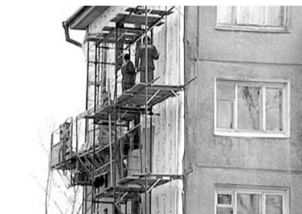
НА ФОТО: НА КАКОМ ОСНОВАНИИ МЫ ДОЛЖНЫ ФИНАНСИРОВАТЬ КАПРЕМОНТ?