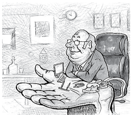
НА РИС.: ПЛАН ТАКОЙ — ПОСАДИТЬ 15 ПРЕДСТАВИТЕЛЕЙ И ВЫИГРАТЬ ВЫБОРЫ

— Я подтверждаю, что проблема кадрового состава, финансового обеспечения органов местного самоуправления есть. Но решим ли мы ее, бросив в никуда почти 700 млн рублей? Правительству Новосибирской области нужно вернуться к содержательной части