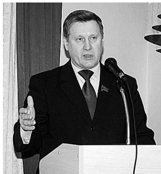
НА ФОТО: АНАТОЛИЙ ЛОКОТЬ

В субботу в Новосибирске состоялся III совместный Пленум Новосибирского обкома и Контрольно-ревизионной комиссии. Коммунисты обсудили итоги XV Съезда, а также результаты прошедших 10 марта выборов.