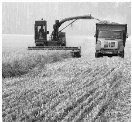
НА ФОТО: ПОМОЩИ ЖДАТЬ НЕОТКУДА

68 хозяйств района комиссией по обследованию пострадавших посевов были признаны пострадавшими от засухи. Ре-