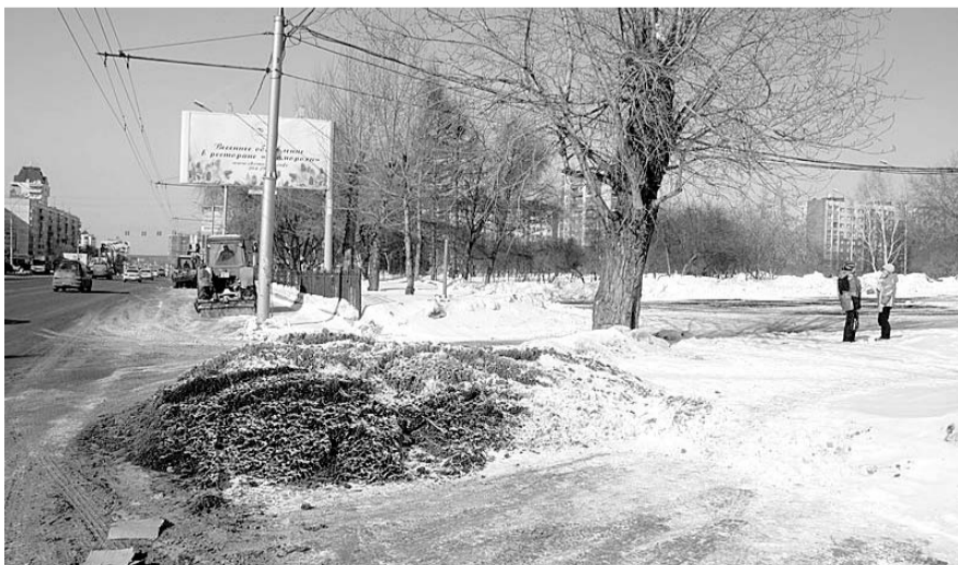
НА ФОТО: НАРЫМСКИЙ СКВЕР — НЕ МЕСТО ДЛЯ АТТРАКЦИОНОВ. НО МЭР ТАК НЕ СЧИТАЕТ