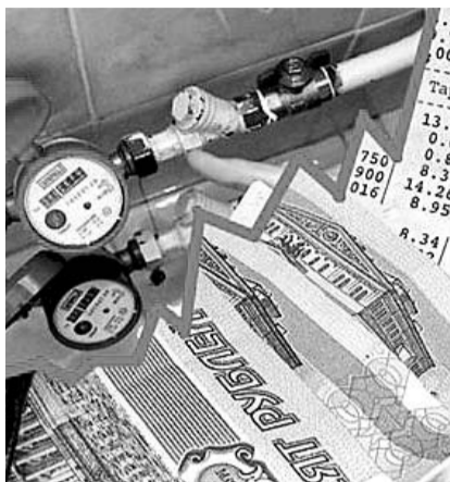
НА ФОТО: ЖИЛЬЦАМ ВЫСТАВИЛИ НЕ ТОТ СЧЕТ

В доме мы внедрили ряд ресурсосберегающих мероприятий. Если нас будут рассчитывать не по приборам