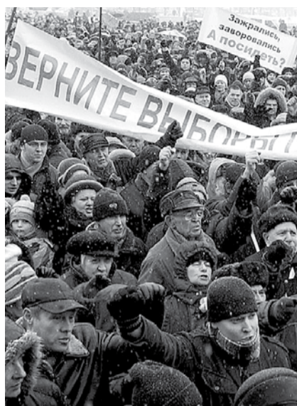
НА ФОТО: ЗА ВЫБОРНОСТЬ Губернаторов!

Напомним, что в ряде северокавказских республик, в частности, в Ингушетии и Дагестане, Кремль намерен отказаться от прямых выборов глав регионов, пишет «Коммерсант» со ссылкой на источник в администрации президента. Эксперты, опрошенные