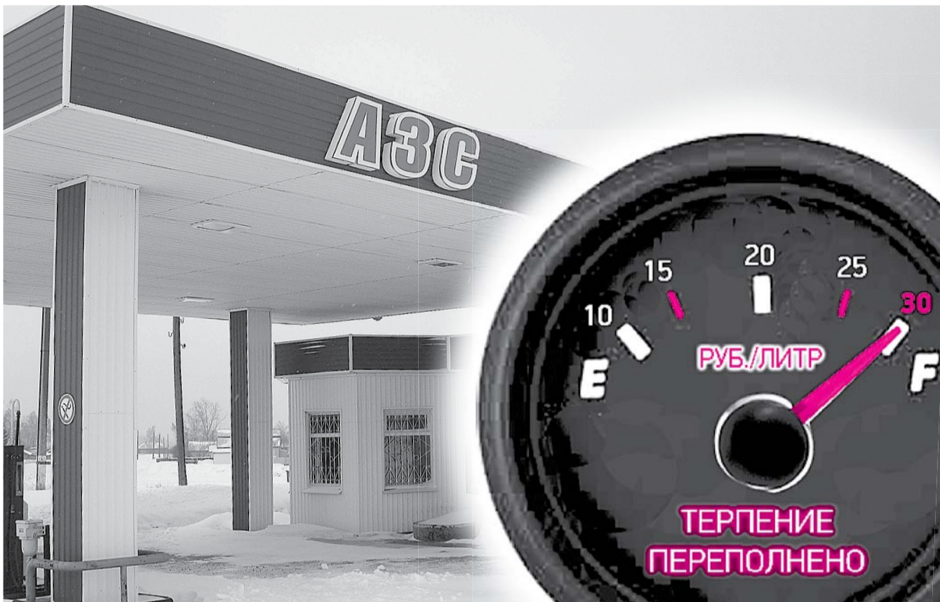
НА ФОТО: БЕНЗИН МАРКИ АИ-98 УЖЕ ПЕРЕВАЛИЛ ЗА 30 РУБЛЕЙ. ОЧЕРЕДЬ ЗА АИ-95 И АИ-92