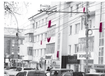
● НА ФОТО: «КРАСНЫЙ» ДОМ НА КРАСНОМ

Жилищного кодекса муниципалитеты освободились от бремени содержания жилья. Помещения стали не нужны, и теперь мэрия успешно распродает общедомовую собственность, которую считает своей. В результате теплоузлы, электрощитовые, задвижки, обеспечивающие функционирование систем жизнеобеспе-