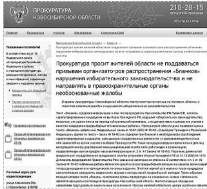
● НА ФОТО: НЕТ, ТОЛЬКО НЕ ЖАЛУЙТЕСЬ

Новосибирский обком КПРФ по предложению гражданских активистов подготовил и распространил бланк заявления в прокуратуру для принятия мер воздействия на кандидата ПУТИНА, отказавшегося соблюдать избирательное законодательство страны. Новосибирцы, небезразличные к ходу избирательной кампании на