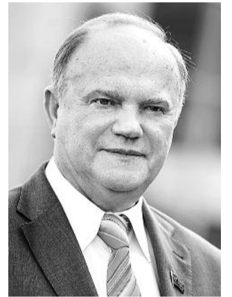
● НА ФОТО: ГЕННАДИЙ ЗЮГАНОВ

Различные мероприятия за честные выборы уже два месяца проходят по всей России. Целая серия таких митингов состоялась 4 февраля. Они демонстрируют острое неприятие фальсификаций народного волеизъявления. Даже организаторы проправительственных митингов вынуждены проводить их под лозунгом «За честные выборы!». На этом фоне отчетливо определилось стремление ультралиберальных сил оседлать народное негодование ради возвращения к власти тех, кто участвовал в разрушении СССР и заложил основы нынешней системы фальсификаций. В их числе господ НЕМЦОВ, КАСЬЯНОВ, КУДРИН и им подобные столпы правящего режима.