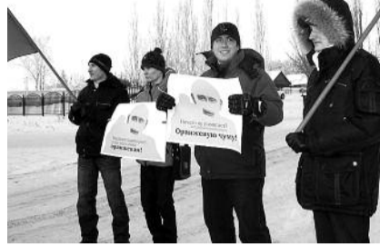
● НА ФОТО: МОЛОДЕЖЬ — В ПИКЕТЕ!

они выступают против попыток Путина раздуть «оранжевый скандал».