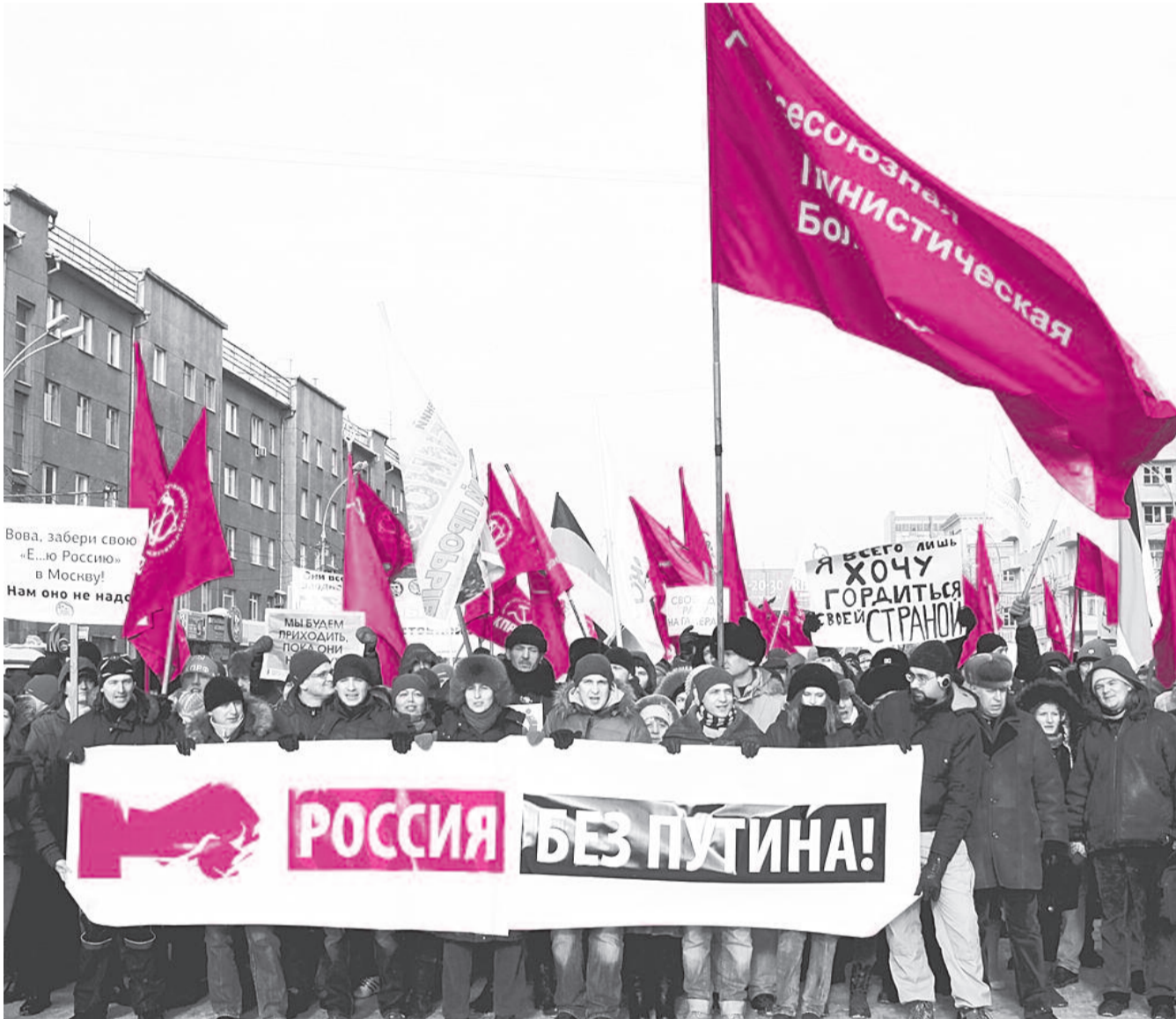
● НА ФОТО: КОЛОННА МИТИНГУЮЩИХ ПРОШЛА МАРШЕМ ОТ ДОМА ОФИЦЕРОВ ДО ПЛОЩАДИ ЛЕНИНА