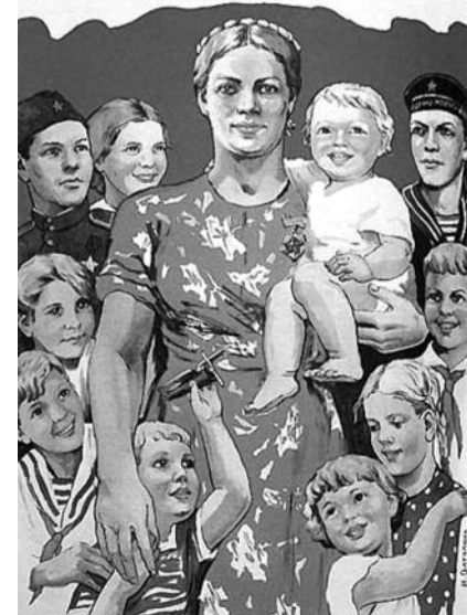
● НА ФОТО: ПРИ КОММУНИСТАХ ЦЕНИЛИ МНОГОДЕТНЫХ МАТЕРЕЙ