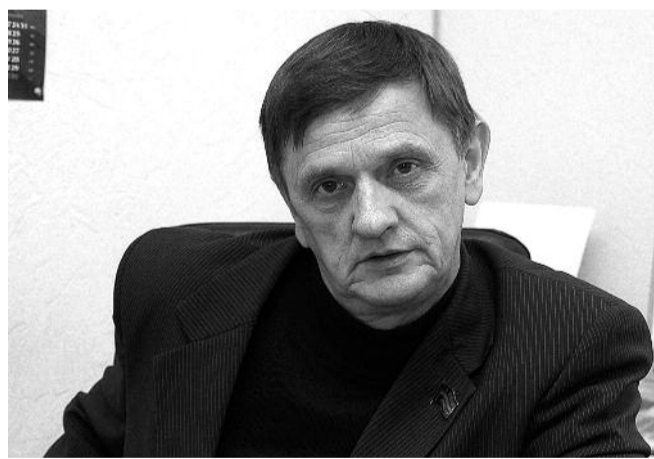
● НА ФОТО: РУКОВОДИТЕЛЬ ФРАКЦИИ КПРФ В ЗС ВИКТОР КУЗНЕЦОВ

участвуют сами члены избирательной комиссии, другими словами, мы имеем прямую зависимость избирательных комиссий от действующей системы власти, и это установлено законом.