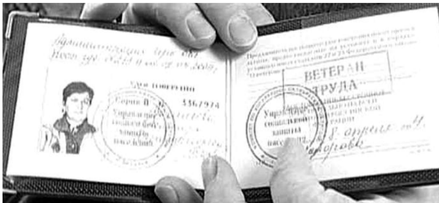
● НА ФОТО: СЕЙЧАС НОРМА О ВЕДОМСТВЕННЫХ ЗНАКАХ ОТЛИЧИЯ ПРОПИСАНА НЕОПРЕДЕЛЕННО