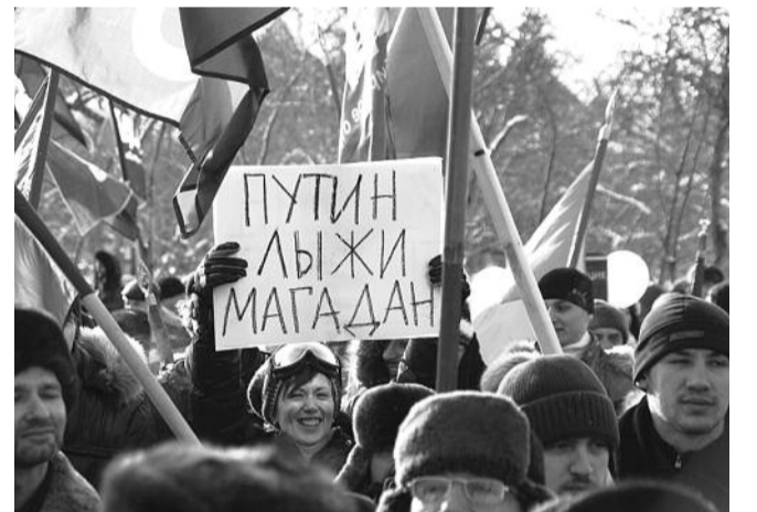
● НА ФОТО: ВОЛЯ НАРОДА ВПОЛНЕ ПОНЯТНА

В-третьих , должна быть обеспечена полная публичность при подсчете голосов и объявлении их результатов. Каждый бюллетень должен предъявляться всем членам комиссии, наблюдателям и журналистам. Итоги голосования должны подводиться немедленно, а итоговые протоколы открыто подписываться в присутствии всех членов избирательной комиссии, наблюдателей и представителей СМИ. Пора покончить с жульническим «согласованием» результатов выборов в начальственных кабинетах, где и происходят самые грубые манипуляции, от которых путинские веб-камеры спасти неспособны.