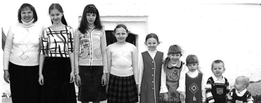
● НА ФОТО: МНОГОДЕТНАЯ МАТЬ В ЛЮБОМ СЛУЧАЕ ЗАСЛУЖИВАЕТ ВНИМАНИЯ ГОСУДАРСТВА