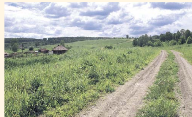
НА ФОТО: ВЪЕЗД В ДЕРЕВНЮ ВЕРХ-ИКИ

В деревне Верх-Ики Маслянинского района закрылся детский сад. Как сообщают местные жители, в здании планируют разместить гостиницу. Ранее в этом селе уже была закрыта школа.