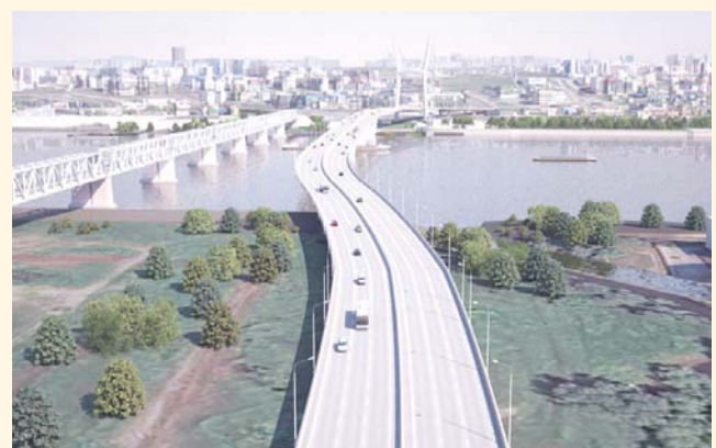
НА ФОТО: ПРОЕКТ ЧЕТВЕРТОГО МОСТА