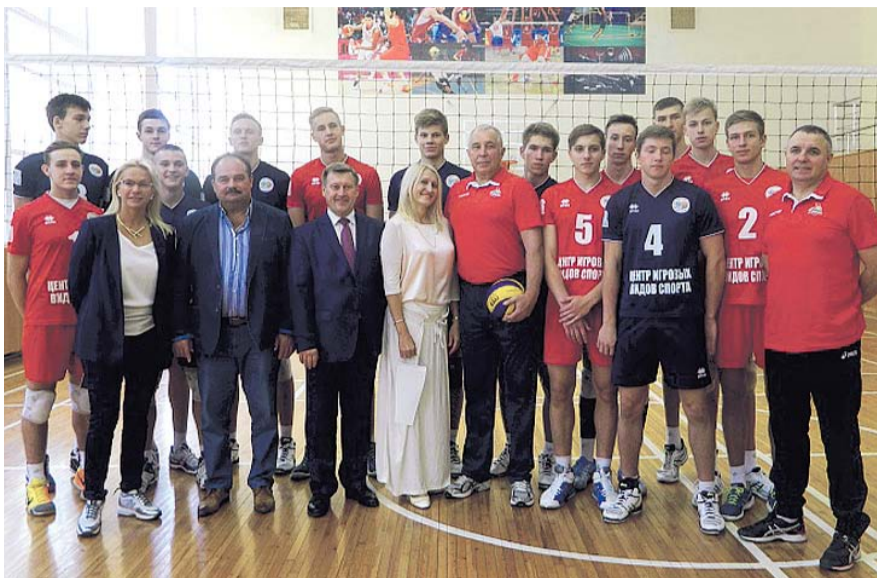
НА ФОТО: СПОРТСМЕНЫ В ОТРЕМОНТИРОВАННОМ ЗАЛЕ