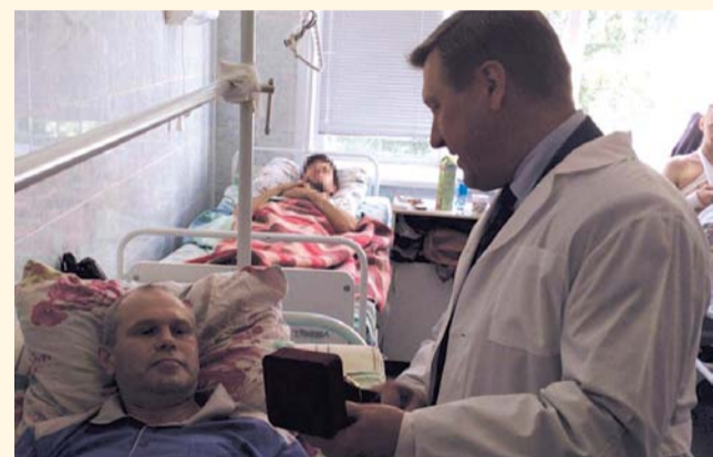
НА ФОТО: МЭР ВЫРАЗИЛ БЛАГОДАРНОСТЬ ПРАПОРЩИКУ ПОЛИЦИИ