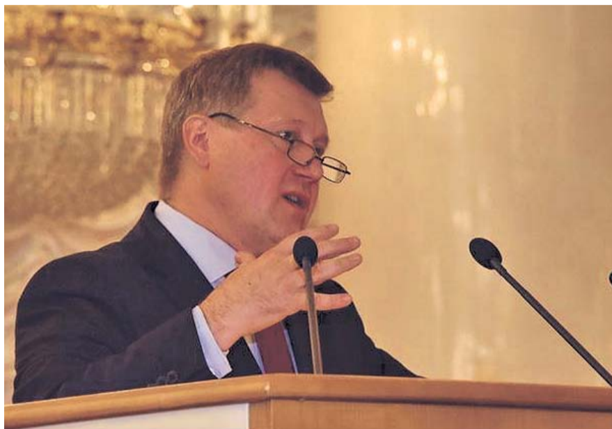
НА ФОТО: ВН

Форум открыл Председатель ЦК КПРФ Геннадий ЗЮГАНОВ . Количество экспертов-участников форума поражает: 1000 человек, среди них 130 учителей, 47 преподавателей вузов и колледжей, 25 докторов наук, 12 профессоров, 7 тренеров детско-юношеских спортивных школ, 8 воспитателей детских садов, 35 врачей и 16 медицинских сестер, 135 работников реабилитационных центров для инвалидов и 38 работников культуры. В Колонном