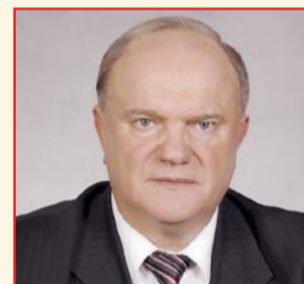
НА ФОТО: ГЕННАДИЙ ЗЮГАНОВ

6 сентября в перерыве Всероссийского социального форума Г.А. ЗЮГАНОВ выступил перед журналистами.