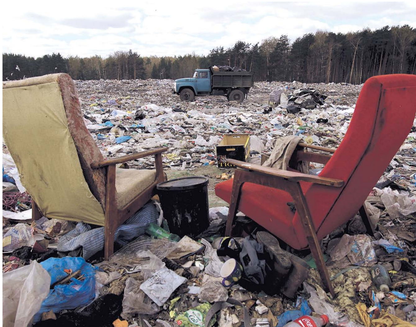
НА ФОТО: ПРОБЛЕМА УТИЛИЗАЦИИ ОТХОДОВ СТОИТ ПЕРЕД КАЖДЫМ РЕГИОНОМ, И НОВОСИБИРСКАЯ ОБЛАСТЬ — НЕ ИСКЛЮЧЕНИЕ