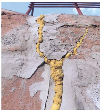
НА ФОТО: СТЕНА ГРОЗИТ ОБВАЛИТЬСЯ

Горожане уже отчаялись и не верят в разрешение наболевшей проблемы. По словам жителей, они уже обращались во все инстанции, но кроме покраски стены ничего не получили. Кроме этого, из-за некачественной застройки, а именно, того, что стена не имеет систем водоотведения и отмокания, возникают проблемы скопления воды, что привело к подмыванию грунта и затоплению подвала дома. Результат: проседание грунта на 1,5 метра, постоянная сырость.