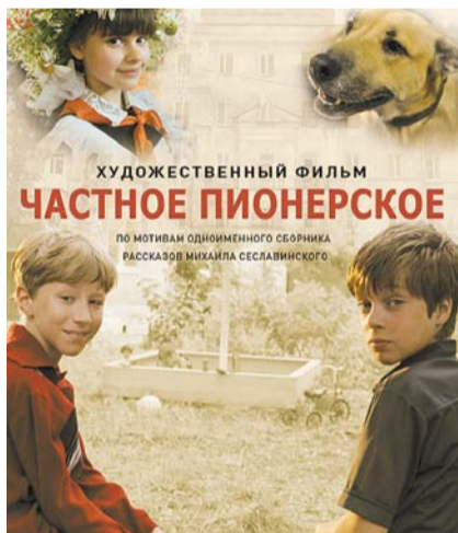
НА ФОТО: АФИША ФИЛЬМА

Уважаемая редакция! Прошу передать благодарность Толмачевской партийной организации КПРФ за неболь-