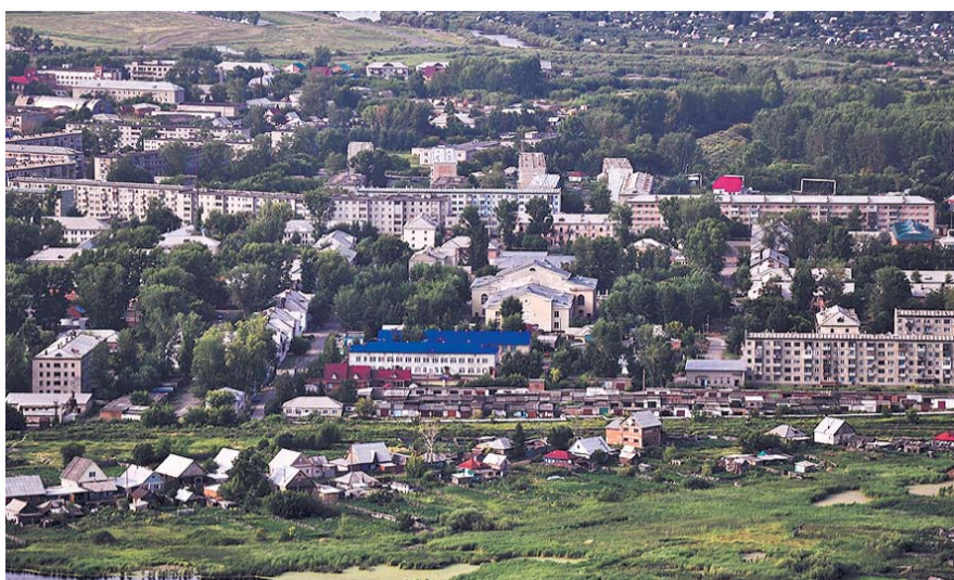
НА ФОТО: ЖИТЕЛИ МНОГOKВАРТИРНЫХ ДОМОВ НЕДОВОЛЬНЫ РАБОТОЙ УК