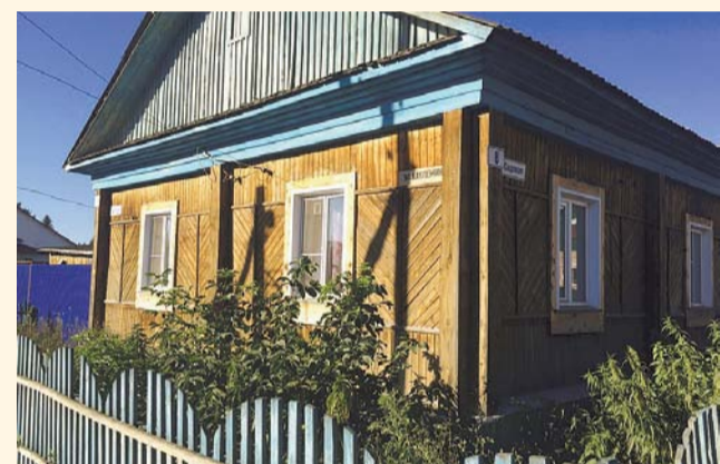
НА ФОТО: ОТРЕМОНТИРОВАННЫЙ ДОМ ПРОКУРОРА