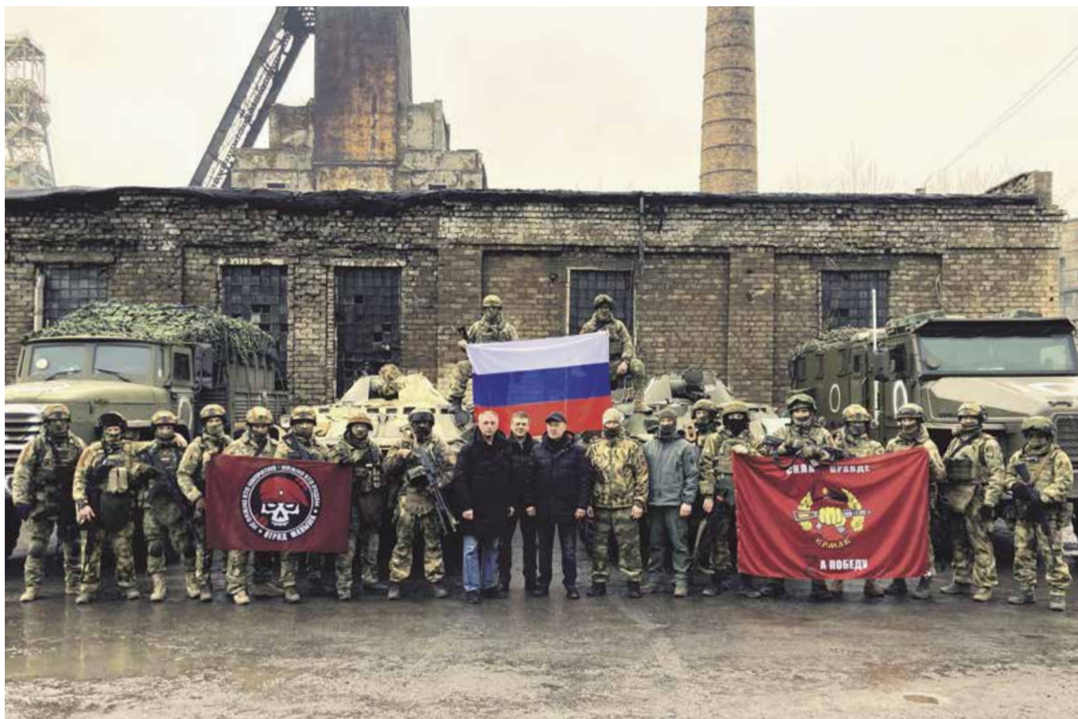
НА ФОТО: ПЕРВЫЙ СЕКРЕТАРЬ НОВОСИБИРСКОГО ОБКОМА КПРФ АНАТОЛИЙ ЛОКОТЬ С БОЙЦАМИ ИЗ НОВОСИБИРСКА