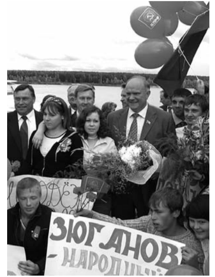
● НА ФОТО: СКАЛИНСКАЯ МОЛОДЕЖЬ ВСТРЕЧАЕТ ГЕННАДИЯ ЗЮГАНОВА. 2007 ГОД

Мне как делегату партийной отчетно-выборной конференции КПРФ хотелось бы подробнее остановиться на этом важном событии в жизни Колыванского района. Думаю, она оставила в душе у многих свой неизгладимый след. Лично у меня при выступлении пионеров Скалинской средней школы стоял ком в горле, а на глаза навернулись слезы, ведь я выросла в той среде: была октябренком, пионером, даже председателем совета дружины, секретарем комсомольской организации. Все это было давно, времена изменились, и казалось, что уже ничто никогда не напомнит о тех давних, советских. Но, оказывается, жизнь вносит свои коррективы.