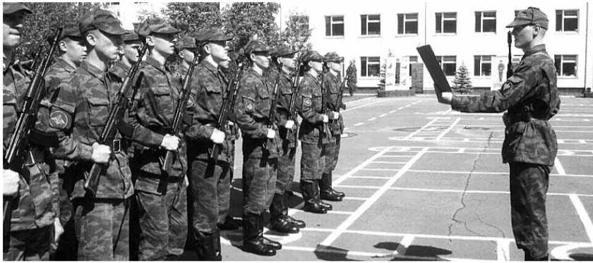
● НА ФОТО: СЕЙЧАС В АРМИЮ ТРЕБУЕТСЯ ЕЖЕГОДНО ПРИЗЫВАТЬ 700 ТЫСЯЧ ЮНОШЕЙ

Второй вызов — кризис пенсионной системы. Адекватный уровень пенсий может быть обеспечен, если соотношение работающих и пенсионеров составляет 3:1, в России это соотношение — 1,7:1. Отсюда растет дефицит пенсионного фонда, который в 2010 году составил 1 трлн. 166 млрд. рублей (3% ВВП).