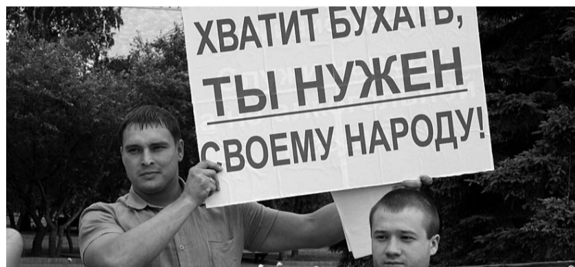
● НА ФОТО: ДЕПУТАТ ОЛЕГ ШЕСТАКОВ НА ПИКЕТЕ ПРОТИВ ПРОВЕДЕНИЯ ПИВНОГО ФЕСТИВАЛЯ