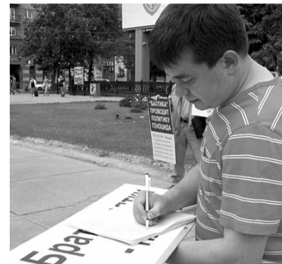
● НА ФОТО: ДЕПУТАТ АНДРЕЙ ЖИРНОВ ПОДПИСЫВАЕТ ОБРАЩЕНИЕ К ГУБЕРНАТОРУ

Коммунист Олег Шестаков отметил, что пиво является одним из наиболее токсичных алкогольных напитков, пора-