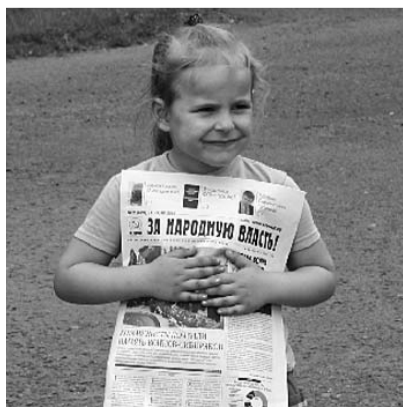
● НА ФОТО: НАШ САМЫЙ ЮНЫЙ ЧИТАТЕЛЬ

Организаторы требуют отдать помещение бывшего детского дома №2 под детский сад. Власти изначально говорили, что именно с этой целью и проводят реорганизацию детского дома. На самом деле этого не произошло, и здание пустует уже более двух лет, несмотря на