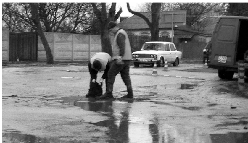
● НА ФОТО: ПРИ ТАКИХ «ВЫСОКИХ» ТЕХНОЛОГИЯХ ПОНЯТНО, ОТКУДА У НАС ТАКИЕ ДОРОГИ

Инструкции 60-70-х годов прошлого столетия по строительству автомобильных дорог, переписываются, датируются последними годами, объявляют, что это нанотехнологии, успокаивают, обещают что через 10 лет дороги будут хорошими. А строители продолжают нарушать технологический процесс в погоне за прибылью. Контроль в процессе строи-