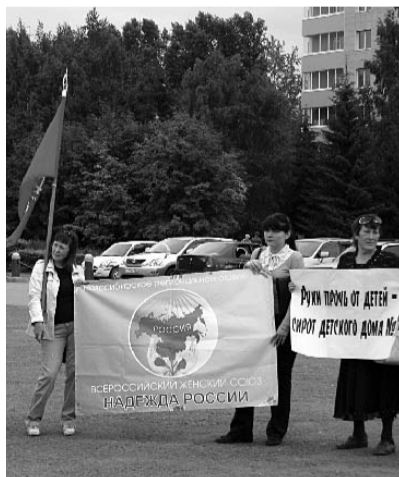
● НА ФОТО: ВЕРНЕМ ДЕТСКИЕ САДЫ ДЕТЯМ!

Реорганизации подверглось еще одно учреждение для детей: Областной детский дом №3, на базе которого организован кадетский корпус. Администрация Кировского района объяснила этот шаг тем, что нерационально использовать большую площадь для детского дома, и