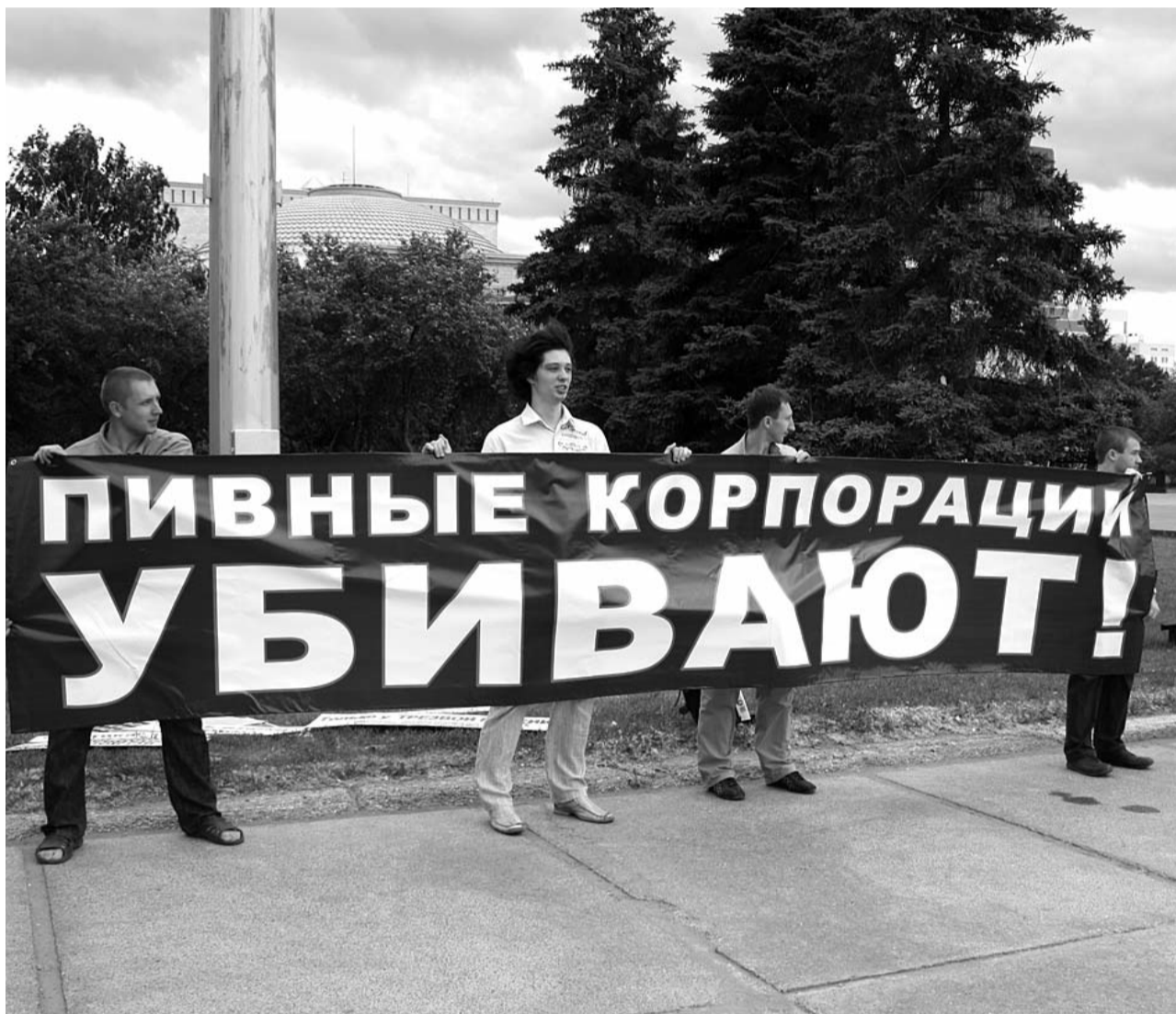
● НА ФОТО: НОВОСИБИРСКИЕ КОММУНИСТЫ ВЫШЛИ НА ПИКЕТ, ЧТОБЫ ПРИВЛЕЧЬ ВНИМАНИЕ К ПРОБЛЕМЕ ПИВНОГО АЛКОГОЛИЗМА