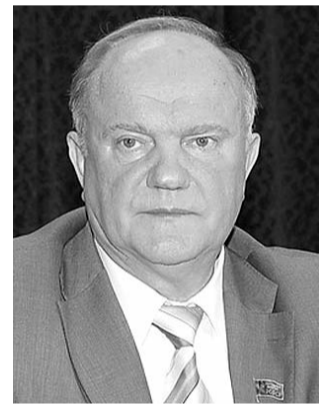
● НА ФОТО: ЛИДЕР КПРФ

Д орогие товарищи! Мы обсуждаем ключевой вопрос нашей жизни и работы. Необходимо вспомнить, что КПСС и Советская страна погибли прежде всего потому, что не ответили на мировоззренческие, идеологические вызовы, не осмыслили во всей полноте происходящее и не приняли вовремя диктовавшиеся жизнью решения. Приходится признать: машина пропаганды буржуазной идеологии оказалась на тот период сильнее.