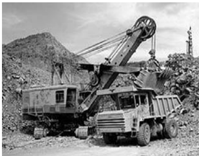
● НА ФОТО: НА ЗАВОДЕ СМЕНА СОБСТВЕННИКОВ, А КРАЙНИЕ, КАК ОБЫЧНО, — РАБОЧИЕ

В настоящее время происходит смена владельцев предприятия. Бывшие не хотят выплачивать долги, видимо, считая, что с них уже сняты все обязательства перед трудовым коллективом, а новые, естественно, не хотят брать эти долги на себя. Обыкновенная история, но страдают рабочие и их семьи, для которых работа на заводе стала единственным источником дохода после разорения вокруг лежащих сел и деревень.