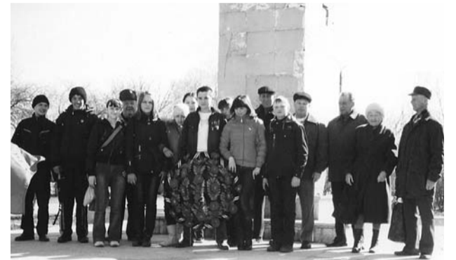
● НА ФОТО: КОММУНИСТЫ КОЛЫВАНИ И УЧАЩИЕСЯ 8 «Б» КЛАССА

В Колывани 22 апреля на центральной площади состоялся митинг жителей райцентра, посвященный 140-летию со дня рождения В.И. ЛЕНИНА . На митинг пришли ветераны партии, ветераны труда и учащиеся 8 «б» класса колыванской средней школы №1.