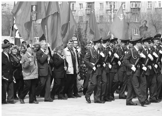
● НА ФОТО: НА МОНУМЕНТЕ СЛАВЫ 9 МАЯ 2009 ГОДА