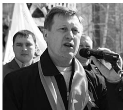
● НА ФОТО: ВЫСТУПАЕТ АНАТОЛИЙ ЛОКОТЬ

«Это не спортсмены проиграли Олимпиаду в Ванкувере, ее проиграло государство. Такими темпами мы проиграем и Олимпиаду в Сочи. Если продолжится монополизация власти «Единой Россией», то наше общество будет окончательно раздроблено. И еще одним доказательством этого является реше-