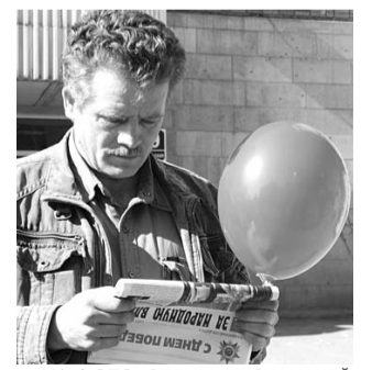
● НА ФОТО: СПЕЦВЫПУСК НАШЕЙ ГАЗЕТЫ ВЫЗВАЛ ИНТЕРЕС ЧИТАТЕЛЕЙ