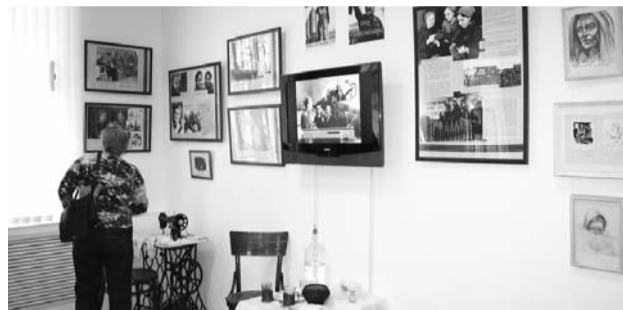
● НА ФОТО: ЭКСПОЗИЦИЯ МУЗЕЯ НОВОСИБИРСКА

Состоялось торжественное открытие музея города Новосибирска, открытого на базе Мемориального музейного центра им. Ю.В. КОНДРАТЮКА по адресу ул. Советская, 24. На мероприятии присутствовали мэр города Новосибирска и депутаты Совета депутатов города Новосибирска.