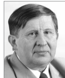
Автор материала: Анатолий КАЗАК, консультант фракции КПрФ в городском Совете Новосибирска

А членам партии «Единая Россия» можно дать хороший совет. Не надо больше ставить баннеры «нам есть чем гордиться», может пора пойти в храм и поставить свечку «на покаяние». Время пришло.