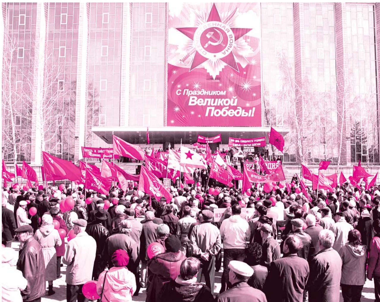
● НА ФОТО: МИТИНГ НОВОСИБИРСКОГО ОБКОМА КПРФ НА ПЛОЩАДИ ПЕРЕД ГПНТБ 1 МАЯ 2010 ГОДА