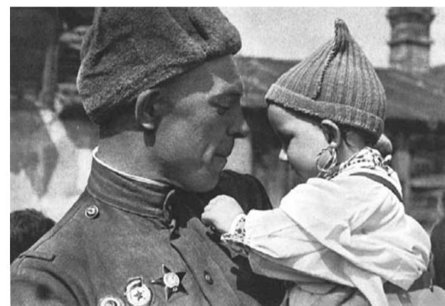
● НА ФОТО: СОВЕТСКИЙ ВОИН В ОСВОБОЖДЕННОЙ ПРАГЕ

После распада СССР, на волне «всеобщей либерализации», НТС полностью перенес свою работу в Россию и в 1996 году был зарегистрирован как обще-