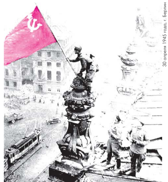
● НА ФОТО: ЗНАМЯ ПОБЕДЫ НАД РЕЙХСТАГОМ

6 Сомалийские пираты в восточной части Аденского залива 5 мая совершили попытку захвата танкера «Московский университет», принадлежащего «Новороссийскому морскому пароходству». Благодаря действиям экипажа захвата судна удалось избежать.