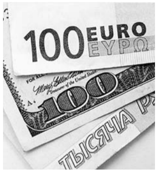
НА ФОТО: РУБЛЬ ДЕШЕВЕЕТ

Экономистами зафиксирован резкий рост стоимости доллара и евро. Цена за один доллар приблизилась к 40 рублям, а за один евро — более 50 рублей.