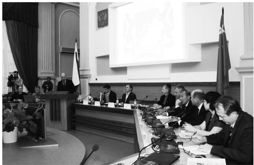
НА ФОТО: УЧАСТНИКИ «КРУГЛОГО СТОЛА» В МЭРИИ

2 октября в мэрии Новосибирска состоялся «круглый стол», посвященный 65-летию дипломатических отношений России и Китая. Его участники рассказали об истории возникновения и развития этих взаимоотношений, наметили дальнейшие пути сотрудничества двух государств и городов-побратимов.