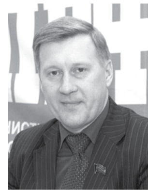
НА ФОТО: АНАТОЛИЙ ЛОКОТЬ

С коммунистическим приветом, первый секретарь Новосибирского обкома КПРФ, мэр Новосибирска Анатолий ЛОКОТЬ