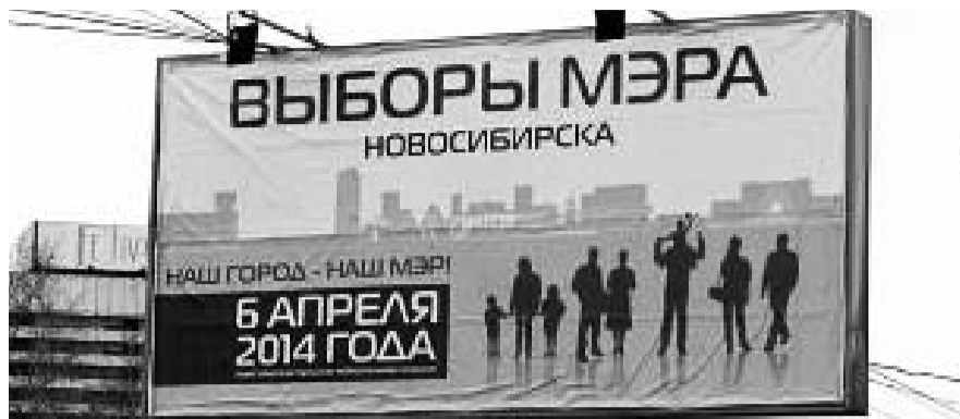
НА ФОТО: КОММУНИСТЫ ПРОДЕМОНСТРИРОВАЛИ ЭФФЕКТИВНОСТЬ РАБОТЫ