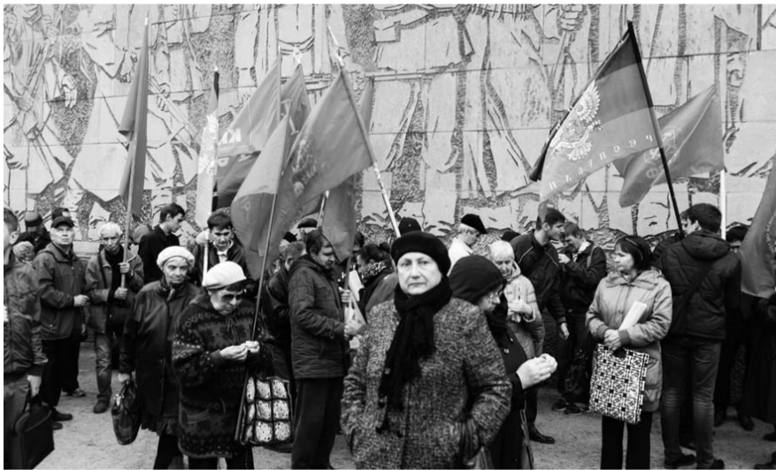
НА ФОТО: НА МИТИНГ ПРИШЛИ ДЕСЯТКИ НОВОСИБИРЦЕВ