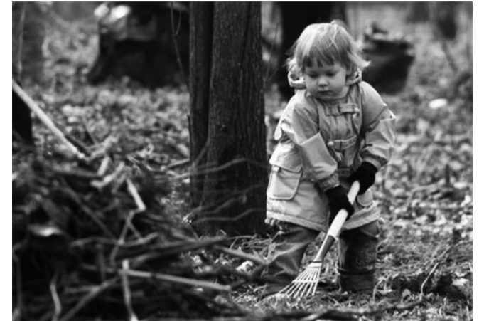
НА ФОТО: НА СУББОТНИК ПРИГЛАШАЮТ ВСЕХ!