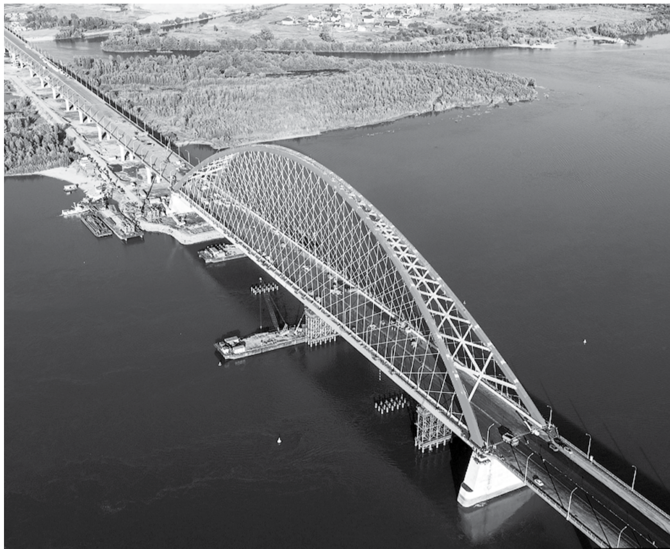
НА ФОТО: БУЗРИНСКИЙ МОСТ — СИМВОЛ РАЗВИТИЯ НОВОСИБИРСКА