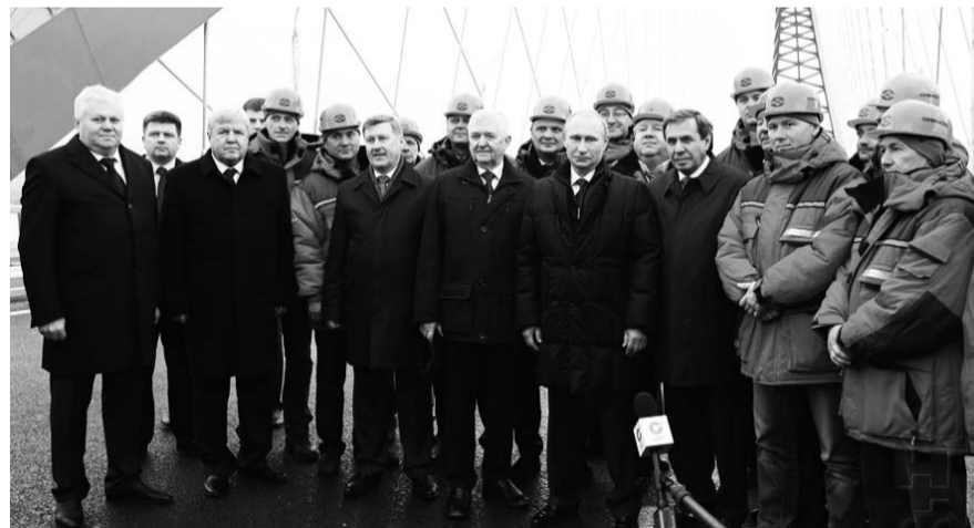
НА ФОТО: АНАТОЛИЙ ЛОКОТЬ В СОСТАВЕ ОФИЦИАЛЬНОЙ ДЕЛЕГАЦИИ НА ОТКРЫТИИ МОСТА

— Новосибирск как промышленный, транспортный и научный центр феде-