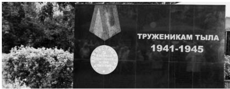
НА ФОТО: ПАМЯТНИК ТРУЖЕНИКАМ ТЫЛА ПЛАНИРУЕТСЯ ОТКРЫТЬ К 70-ЛЕТИЮ ПОБЕДЫ

— Обсуждая положение о совете, мы говорили о том, что в его составе не