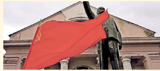
НА ФОТО: СТОИМОСТЬ ВОССТАНОВЛЕНИЯ — ПОРЯДКА СТА ТЫСЯЧ