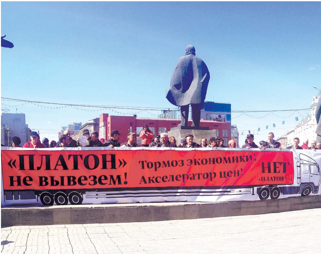
НА ФОТО: НОВОСИБИРСКИЕ ДАЛЬНОБОЙЩИКИ ЗАЯВИЛИ, ЧТО НЕ В СОСТОЯНИИ ОПЛАЧИВАТЬ РАСТУЩИЕ АППЕТИТЫ ГОСУДАРСТВА