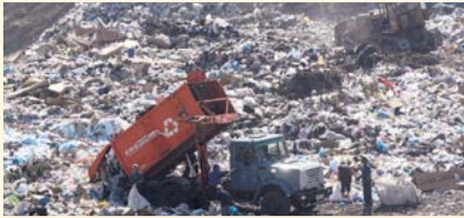
НА ФОТО: чиновнику ВАЖНЕЕ СВАЛКА

Руководитель Департамента природных ресурсов и охраны окру-