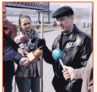
НА ФОТО: АНАТОЛИЙ ЛОКОТЬ

Дорогие земляки! 22 апреля в Новосибирске пройдет весенний общегородской субботник. Эта добрая традиция, существующая в нашем городе много лет, призвана объединить инициативных, неравнодушных людей, которые хотят видеть свой город чистым, уютным, благоустроенным.