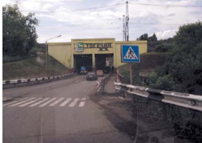
НА ФОТО: РАЗВИТИЕ — ТОЛЬКО НА СЛОВАХ

Что же касается перспектив района в целом, то таковые, кстати, даже, по оценкам представителей региональной власти, пока что оставляют желать лучшего. В районе, как сообщает сайт Заксобрания, фиксируется отток насе-