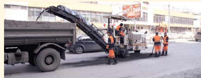
НА ФОТО: В СУТКИ РЕМОНТИРУЕТСЯ 1000 КВ. МЕТРОВ ДОРОГ