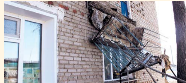
НА ФОТО: РУХНУВШИЙ БАЛКОН