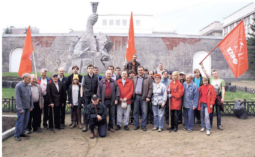
НА ФОТО: КОММУНИСТЫ НА СУББОТНИКЕ В СКВЕРЕ ГЕРОЕВ РЕВОЛЮЦИИ, 2016 ГОД

В Дзержинском районе коммунисты планируют после возложения цветов к памятнику Ленину на Трикотажной в 12-00 привести в порядок территорию возле памятника Феликсу Дзержинскому . А 3 мая