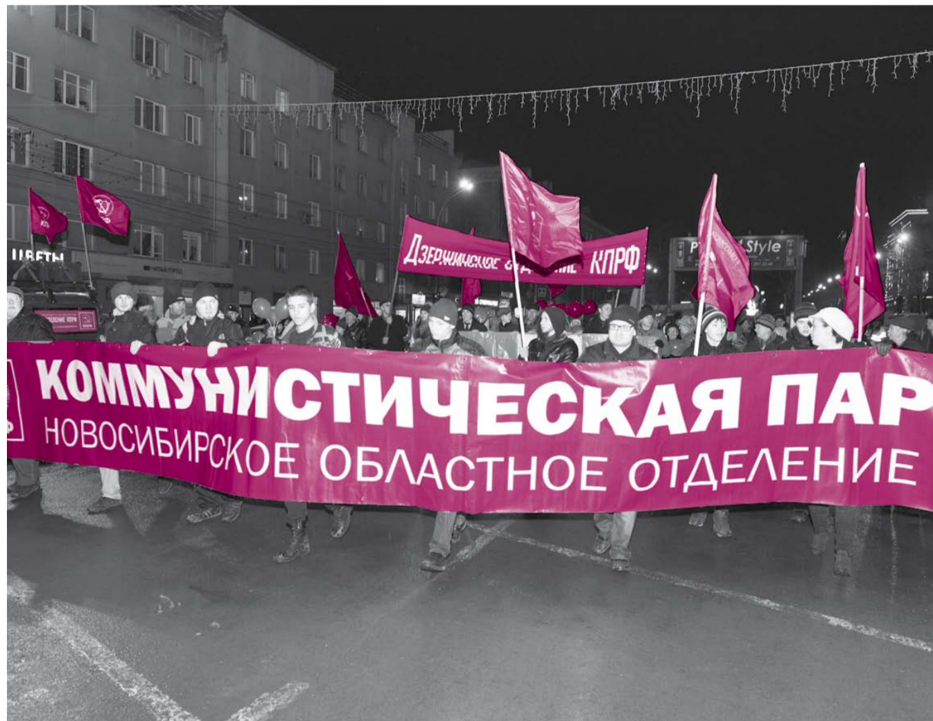
НА ФОТО: ФЕ