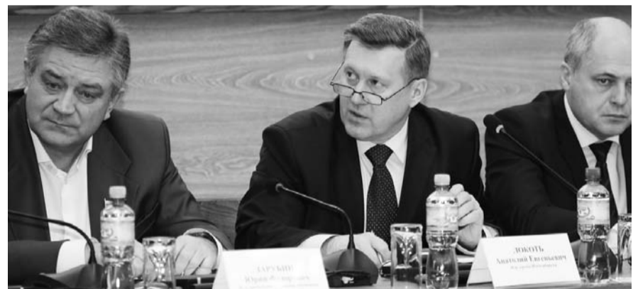
НА ФОТО: МЭР АНАТОЛИЙ ЛОКОТЬ КОНТРОЛИРУЕТ УБОРКУ СНЕГА В ГОРОДЕ