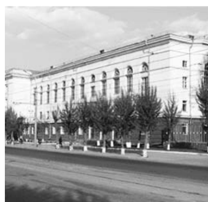
НА ФОТО: НПП ВОСТОК

Мэр Новосибирска Анатолий ЛОКОТЬ провел рабочее совещание на территории Научно-производственного предприятия «Восток», занимающегося производством электронных устройств и изделий микроэлектроники.