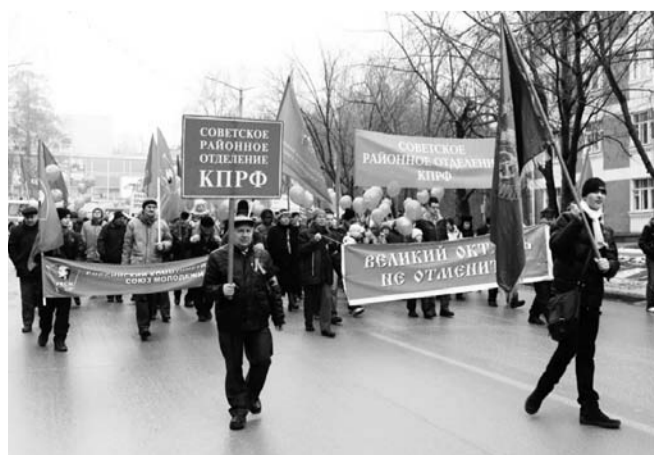
НА ФОТО: НА МИТИНГЕ В СОВЕТСКОМ РАЙОНЕ

СОВЕТСКИЙ РАЙОН. В демонстрации приняло участие