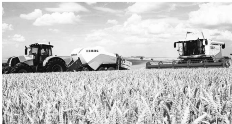
НА ФОТО: НОВАЯ СЕЛЬХОЗТЕХНИКА ПОЗВОЛИТ КРЕСТЬЯНАМ РАБОТАТЬ ЭФФЕКТИВНЕЕ

Депутаты отметили, что министр в своем докладе уделила много внимания пищевой промышленности, которая составляет 20% всей промышленности Новосибирской области, и сельскому хозяйству, но призвали обратить внимание при составлении плана на конкретные проблемы отрасли. Среди них — недоступность жилья для молодых специалистов, отсутствие поддержки для частных крестьянских хозяйств.