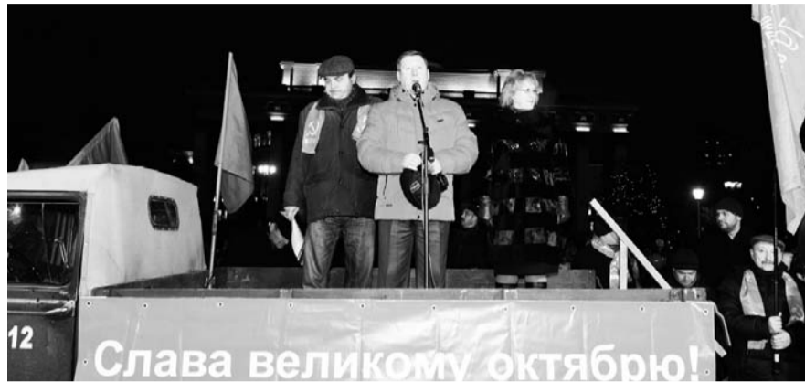
НА ФОТО: МЭР НОВОСИБИРСКА (В ЦЕНТРЕ) НА ИМПРОВИЗИРОВАННОЙ ТРИБУНЕ

Александр Абалаков напомнил собравшимся, что время Советского Союза — это время побед: победа в