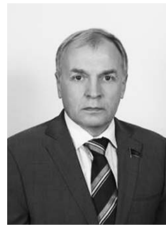
НА ФОТО: БОРИС КАШИН

Выступление депутата Госдумы Бориса КАШИНА на пленарном заседании 11 ноября по проекту закона о поправке к Конституции РФ «Об Администрации Президента Российской Федерации», внесенному фракцией КПРФ.