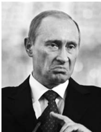
НА ФОТО: ВЛАДИМИР ПУТИН

О чем может говорить данное заявление со стороны «гаранта Конституции»? На мой взгляд, оно может говорить о том, что власть сегодня находится в состоянии крайнего замешательства и не знает, что делать, потому что единственный шанс избежать демонтажа российской государственности и действительно поднять Россию с колен — принять как руководство к действию Программу КПРФ и основанную на ней антикризисную Программу. То есть, по сути, обратиться к большевистской теории и практике, против чего выступают и будут выступать контролирующие государствен-