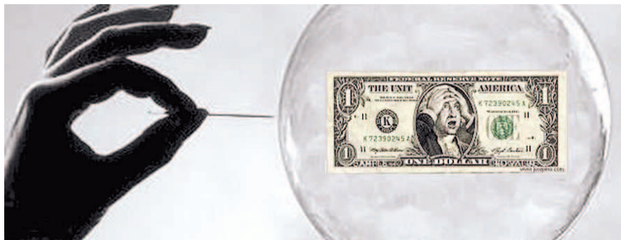
НА ФОТО: ЗА ДЕНЬГИ ПОКУПАЮТ ДЕНЬГИ, НАРАЩИВАЯ ДОЛГИ. КТО СТАНЕТ КРАЙНИМ?