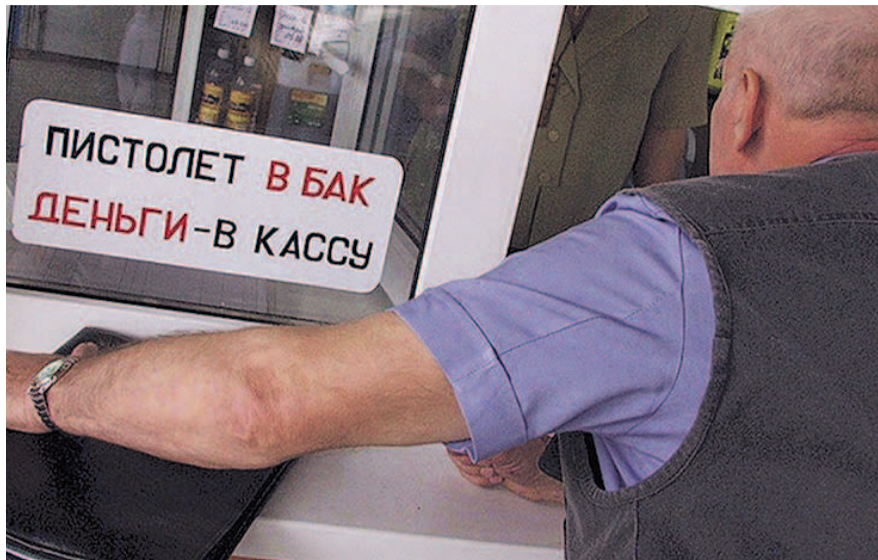
НА ФОТО: БЕНЗИН ДОРОЖАЕТ НЕСКОЛЬКО РАЗ В ГОД, ПРОВОЦИРУЯ ИНФЛЯЦИЮ

По мнению аналитиков, возможное объяснение выглядит так. Во-первых,