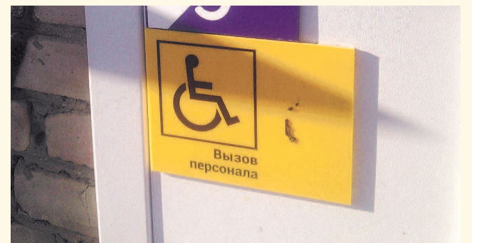
НА ФОТО: «ДОСТУПНАЯ СРЕДА» НЕДОСТУПНА