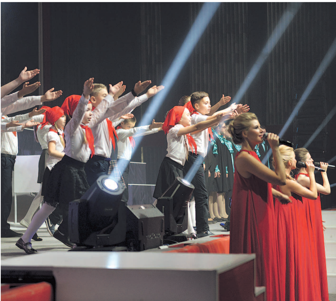
НА ФОТО: СОВРЕМЕННЫЕ ПИОНЕРЫ ПОЗДРАВИЛИ КОМСОМОЛЬЦЕВ ВСЕХ ПОКОЛЕНИЙ СО 100-ЛЕТИЕМ ВЛКСМ