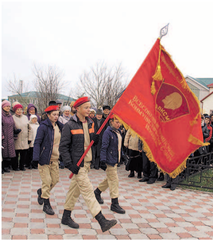
НА ФОТО: КОМСОМОЛЬСКОЕ ЗНАМЯ

Митинг, посвященный 100-летию ВЛКСМ, на котором присутствовало рекордное число жителей — более 200 человек, — прошел 29 октября в Убинском районе около обелиска в память борцов, павших за власть Советов. Ранее — 23 октября — здесь вскрыли капсулу времени с обращением торжественного собрания комсомольцев 1968 года к комсомольцам 2018-го.