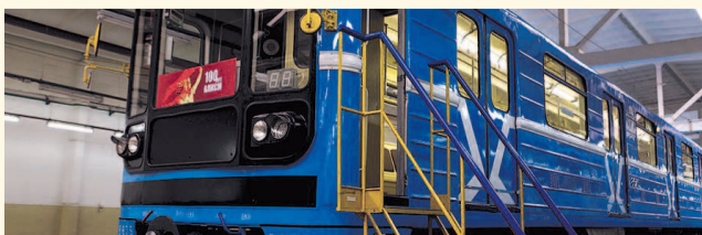
НА ФОТО: ОБНОВЛЕННЫЙ ВАГОН