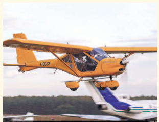
НА ФОТО: АЭРОПРАКТ-22

В Новосибирском государственном техническом университете запустили программу по подготовке пилотов для всех желающих «Соколы НГТУ».