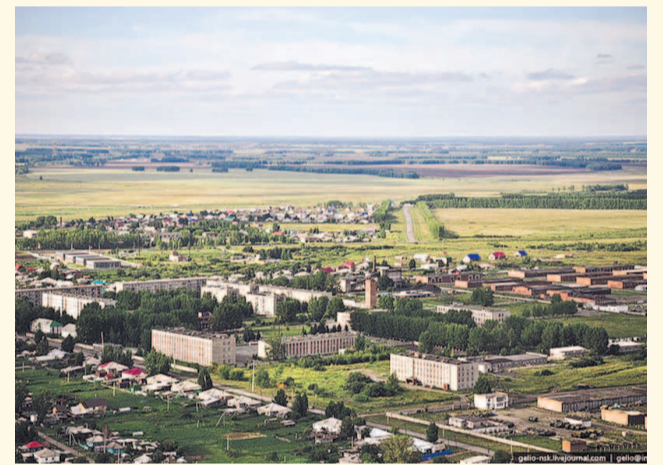
НА ФОТО: БЫВШЕЕ ЛЕТНОЕ ПОЛЕ В КОЧЕНЕВО