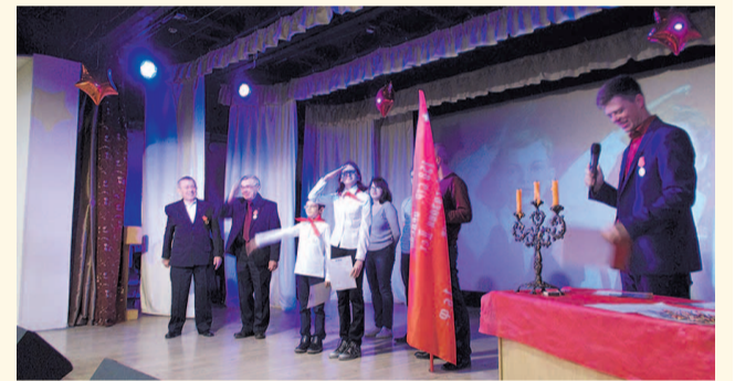
НА ФОТО: НОВОЕ ПОКОЛЕНИЕ ПИОНЕРОВ В КРАСНООБСКЕ