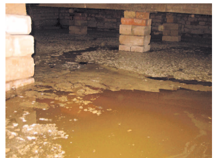
НА ФОТО: ПОДТОПЛЕННЫЙ ПОДВАЛ

Тем временем администрация города Оби информировала общественность о проведении еще одного аукциона — на выполнение работ по инженерным изысканиям и разработке проектно-сметной документации «Отвод поверхностных и грунтовых вод с территории г. Оби Новосибирской области». Лот с начальной ценой 3,6 млн рублей был выставлен на сайте roseltorg.ru . Согласно