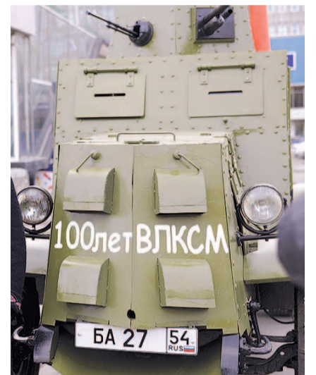
НА ФОТО: РЕТРО-ТЕХНИКА

После торжественной речи мэра для гостей праздника выступили творче-