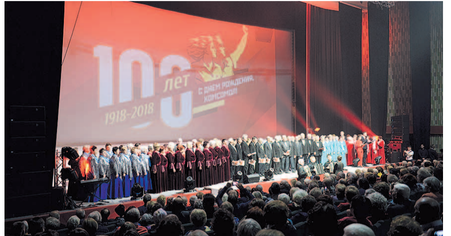
НА ФОТО: ЗАЛ КОНЦЕРТНОГО КОМПЛЕКСА БЫЛ ПОЛОН

Такие теплые воспоминания вызвали множество аплодисментов и доброго смеха. Далее на сцену были вынесены