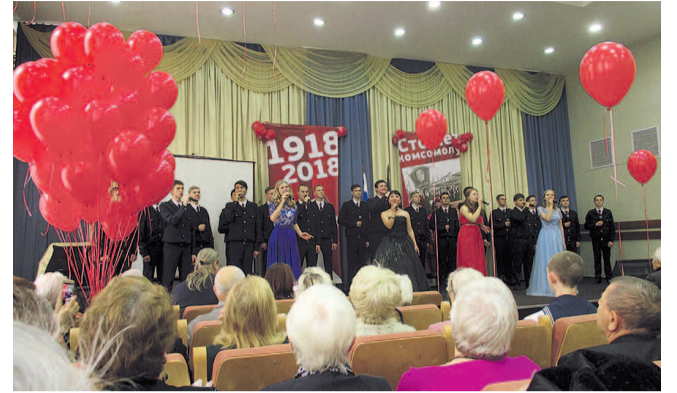
НА ФОТО: НА ПРАЗДНОВАНИИ 100-ЛЕТИЯ КОМСОМОЛА

Все три направления деятельности хора — хоровое пение, эстрадные песни, фронтовая агитбригада — были представлены и принимались бурно и на «УРА!». Это порадовало, тронуло до слез чувство и разум бывших комсо-