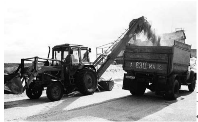
НА ФОТО: КОЛЛЕКТИВНОЕ ХОЗЯЙСТВО ЯВЛЯЕТСЯ НАИБОЛЕЕ УСТОЙЧИВОЙ И НАДЕЖНОЙ ФОРМОЙ В НАШЕ ВРЕМЯ