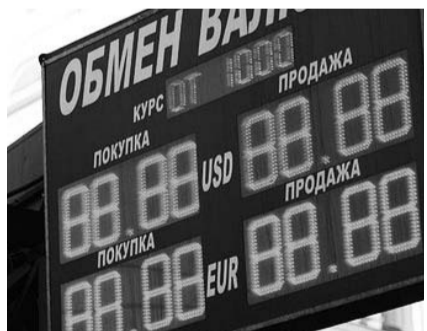
НА ФОТО: ПРЯМУЮ ВЫГОДУ ОТ ДЕВАЛЬВАЦИИ РУБЛЯ ПОЛУЧИТ «ЭЛИТА» СТРАНЫ

Как подсчитали «Известия», рост курса доллара и евро спровоцирует резкое подорожание ряда импортных