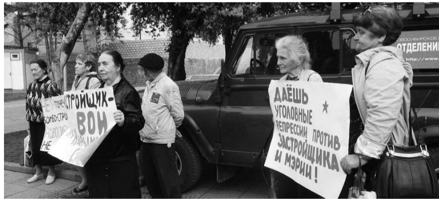
НА ФОТО: НЧАВШАЯСЯ ЕЩЕ В 2008 ГОДУ БОРЬБА ЗА НАРЫМСКИЙ СКВЕР ПРОДОЛЖАЕТСЯ

промиссы. Кто-то считает, что можно попробовать договориться с этой властью, но уверена, что как только начинается разговор о компромиссах с ними — это означает, что власть делает все, что ей нужно. Единственный способ — стоять на своей позиции до конца, только тогда можно что-то поменять. Вот последний пример: ул. Трудовая, 7 — в охранный зоне памятника хотели построить офисное здание на месте детской хоккейной коробки, но, даже несмотря на решение суда, площадка для них является открытой. Суды принимают половинчатые решения, оставляя власти возможность для новых действий. Точно так же было и в Нарымском сквере. Один суд мы выиграли, они другой проект сделали. И мы снова судились. Суд принял обеспечительные меры в адрес одного застройщика, они привлекли другого. Такие обманы будут продолжаться.