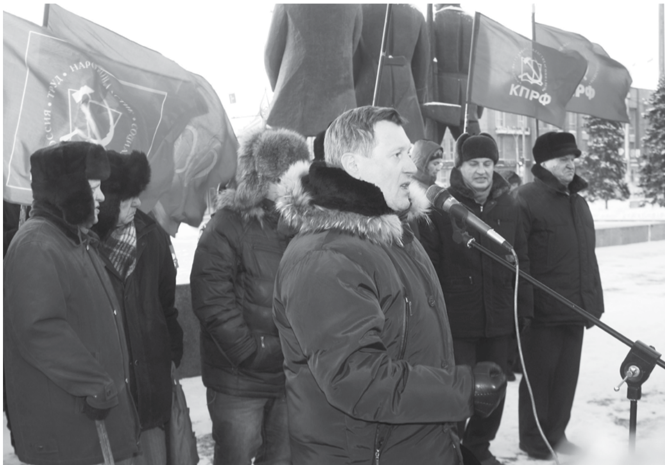
НА ФОТО: СТОИМОСТЬ РЕМОНТА ОДНОГО КВАДРАТА ОКАЗАЛАСЬ ОЧЕНЬ РАЗНОЙ В РАЗНЫХ РЕГИОНАХ