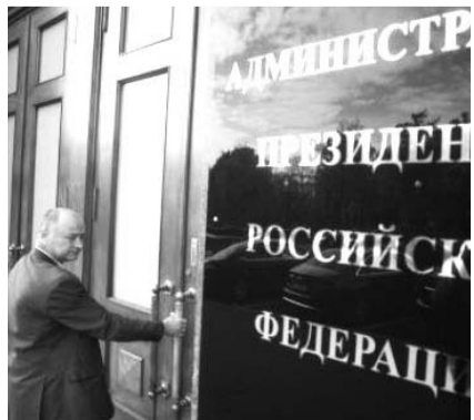
НА ФОТО: КРЕМЛЬ ГОТОВ ПРИЗНАТЬ ЛЕГИТИМНОГО МЭРА

строительную политику. Отметил, что мы намерены максимально консолидировать горожан, разные политические силы и общественные организации для решения проблем города Новосибирска. Кроме того, Володин был проинформирован о ходе избирательной кампании, в том числе о фактическом введении в средствах массовой информации политической цензуры. Администрация Президента России будет внимательно следить за ходом выборов в Ново-