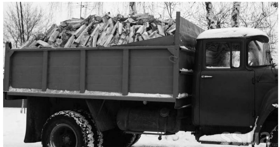
НА ФОТО: ТОЛЬКО КВИТАНЦИИ ТУТ НЕ ДАЮТ, А БЕЗ КВИТАНЦИЙ НЕ БУДЕТ ВОЗМЕЩЕНИЯ...