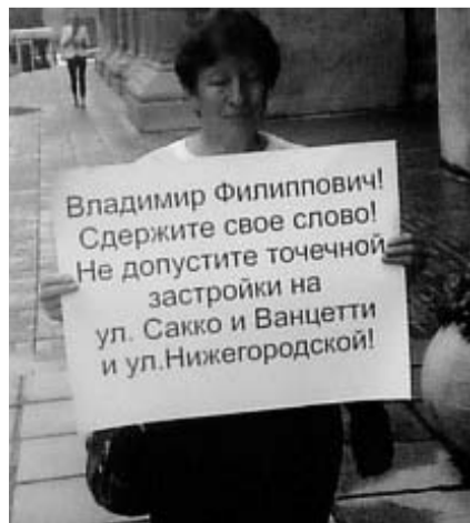
НА ФОТО: ЛЮДИ ХОТЯТ ЖИТЬ В КОМФОРТНОМ ДЛЯ СЕБЯ ГОРОДЕ

нию, есть понятие, что если человек против чего-то восстал, значит, у него могут быть «какие-то отклонения». Но не надо переигрывать и говорить так