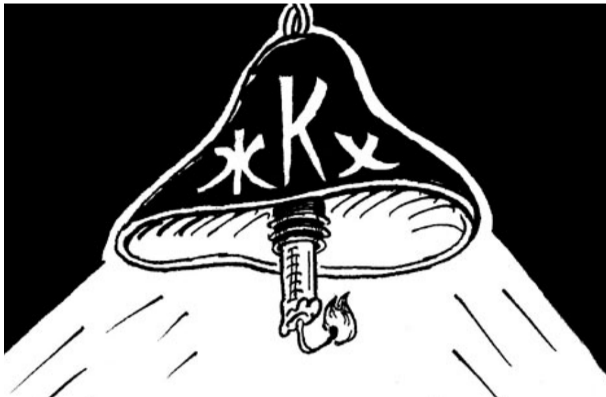
НА ФОТО: САМАЯ БОЛЬШАЯ ПРОБЛЕМА НОВОСИБИРСКА — ЭТО СФЕРА ЖКХ