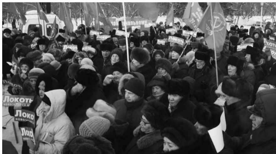
НА ФОТО: МНОГОЛЮДНОСТЬ МИТИНГА СТАЛА НЕПРИЯТНЫМ СЮРПРИЗОМ ДЛЯ ВЛАСТИ

Только очень острая проблема могла заставить собраться людей в такой холод