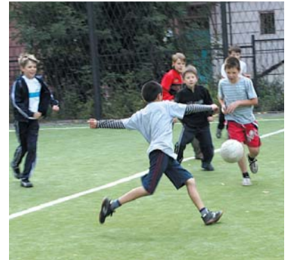
● НА ФОТО: НАШИ БУДУЩИЕ СПОРТИВНЫЕ НАДЕЖДЫ — ЗДЕСЬ, ВО ДВОРАХ

Организуя спортивные мероприятия, коммунисты и сами не прочь показать себя на спортивном поприще. При Новосибирском обкоме КПРФ существует команда по мини-футболу, воз-