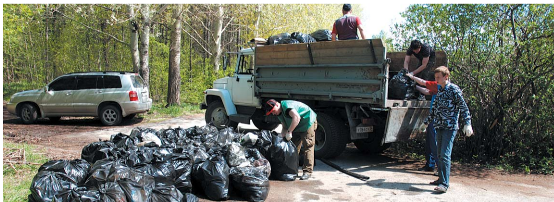
● НА ФОТО: АКТИВИСТЫ СОБРАЛИ 200 МЕШКОВ МУСОРА, КОТОРЫЕ СМОГЛИ ВЫВЕЗТИ ТОЛЬКО НА 5 ГРУЗОВИКАХ

« Мы объединились, чтобы привлечь внимание к проблеме заброшенности Ботсада, добиться надлежащего ухода и благоустройства этой территории. Мы выступаем за передачу территории в муниципальную собственность и выделение средств на благоустройство Ботанического сада »