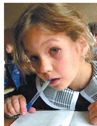
● НА ФОТО: А ХВАТИТ ЛИ ДЕНЕГ У РОДИТЕЛЕЙ?..

В условиях мирового кризиса правительства западных стран взяли курс на сокращение социальных расходов. Правительство России действует в рамках этой тенденции. Не сумев создать диверсифицированную экономику, которая ныне целиком зависит от экспорта энергоресурсов, финансовый блок правительства не нашел ничего лучшего как начать резать расходы по социальным статьям. И реформа бюджетной сферы идет в главном русле этой нынешней политики правительства.