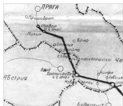
● НА ФОТО: ОКОНЧАНИЕ ПУТИ 303 СТРЕЛКОВОЙ ВЕРХНЕДНЕПРОВСКОЙ ДИВИЗИИ СИБИРЯКОВ-КУЗБАССОВЦЕВ