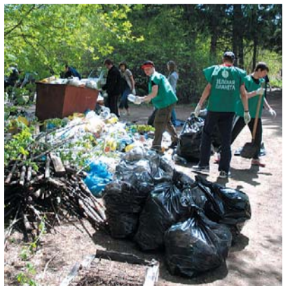
● НА ФОТО: СДЕЛАЕМ БОТСАД ЧИСТЫМ!

«Наш сад — не свалка!» — заявили организаторы, и за несколько часов работы собрали 200 мешков мусора, для выво-