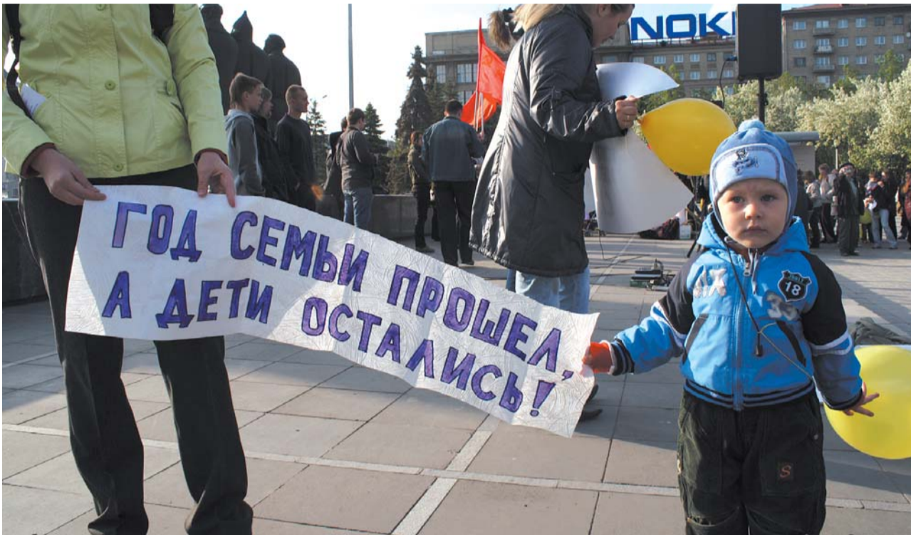
● НА ФОТО: 1 ИЮНЯ В МИТИНГЕ «ЗА ДОСТУПНОЕ ДОШКОЛЬНОЕ ОБРАЗОВАНИЕ» НА ПЛОЩАДИ ИМ. ЛЕНИНА УЧАСТВОВАЛИ И САМИ ДЕТИ