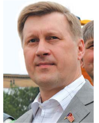
● НА ФОТО: АНАТОЛИЙ ЛОКОТЬ НА «ДНЕ ПРАВДЫ-2009»

Мы поговорили о фестивале левой прессы «День Правды» с первым секретарем Новосибирского обкома КПРФ, депутатом Госдумы Анатолием ЛОКТЕМ .