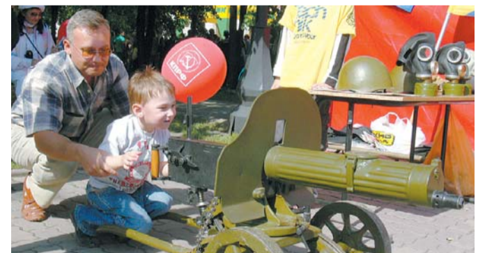
● НА ФОТО: ЗНАМЕНИТЫЙ ПУЛЕМЕТ «МАКСИМ» ВЫЗВАЛ ЖИВОЙ ИНТЕРЕС У ГОСТЕЙ ФЕСТИВАЛЯ «ДЕНЬ ПРАВДЫ-2008»

— В этом году мы придаем особое значение празднику и проводим его с максимальной политической амплитудой. Именно поэтому мы пригласили на праздник наших товарищей по региону, которые также представят левые издания своей областей. Это коммунисты Омска, Алтая, Кузбасса, Томска, Красноярска, и даже Читы и Бурятии. В прошлом году также участвовали партийные организации, но в этом году они представлены