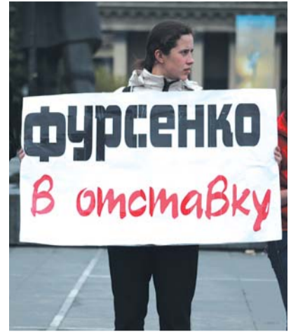
● НА ФОТО: ВЫ ПОДДЕРЖИВАЕТЕ?

А уже во вторник 1 июня на площади Ленина Новосибирска состоялся митинг против коммерциализации образовательных учреждений и за доступное дошкольное образование. В митинге приняли участие КПРФ и комсомольцы, всего присутствовало около 200 человек. Организатором мероприятия выступило «Движение за доступное дошкольное образование», участники которого борются за то, чтобы их дети смогли ходить в детский сад. Нехватка мест в детсадах вынудила родителей выйти на акцию протеста.